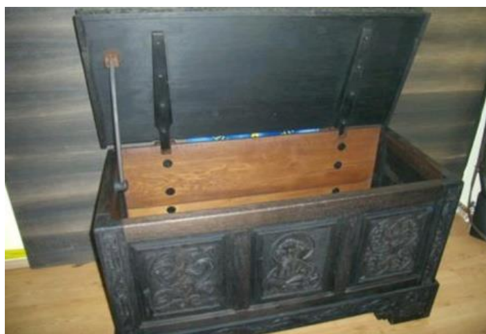
Slika 5. Unikatna škrinja od abonosa