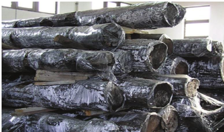
Slika 1. Stabla abonosa izvučena iz vode i obavijena plastičnom folijom (slika preuzeta iz Sinković i sur. 2009)