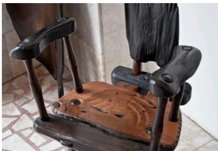
Slika 3. Unikatne stolice od abonosa

Upotreba abonosa za izradu dragocjenih i skupocjenih predmeta veoma je popularna zbog toga jer je svaki predmet potpuno unikatni i raznolik u svojoj boji i smjerovima godova. Prilikom izrade predmeta od abonosa poštuje se oblik i struktura drveta, te se ističe ljepota nesavršenosti. Abonos je osim zbog estetike vrijedna sirovina i zbog svoje rijetkosti, starosti i trajnosti (Sinković i sur. 2009).