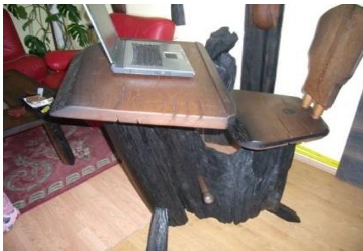
Slika 4. Unikatni stol od abonosa