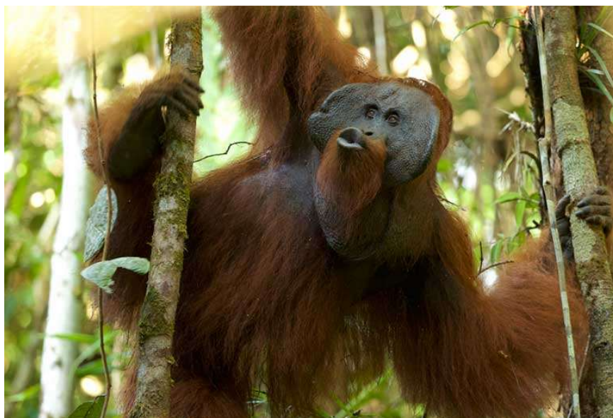
Slika 3. Odrasli mužjak proizvodi „kiss squeak“, Nacionalni park Gunung Palung u Zapadnom Kalimantanu

Drugi specifičan tip glasanja je „kiss squeak“ pri kojem orangutan podiže glavu i pući usne proizvodeći zvuk nalik poljupcu. Za razliku od „long call“ glasanja, ovaj zvuk orangutani ne ispuštaju spontano, već kao reakciju na drugu jedinku i u znak prijetnje. „Kiss squeak“ često se javlja u kombinaciji sa zvukom opisanim kao „grumph“ koji se smatra upozorenjem. „Kiss squeak“ sam po sebi ne mora nužno značiti prijetnju, ali pokazuje agonistički stav prema drugoj jedinki; u većini situacija mogao bi se shvatiti kao znak razdraženosti i nezadovoljstva. Ovaj zvuk može biti usmjeren prema drugim orangutanima, ljudima ili glasnim smetnjama (Rijksen 1978). Mitani (1985) navodi da je ovaj tip glasanja čest kod ženki pri prisilnoj kopulaciji. „Kiss squeak“ može biti djelomično izmijenjen proizvodi li se uz pomoć dlana ili lišća te će zvuk biti jasniji i smatra se da su ove inačice karakteristične za pojedinu populaciju te se šire učenjem (De Boer i sur. 2015).