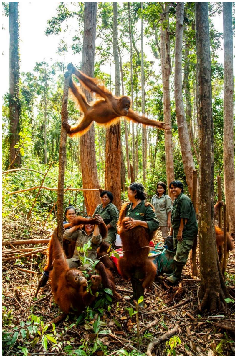
Slika 3. Grupno učenje u šumi ( Forest School) u sklopu Borneo Orangutan Survival Foundation.