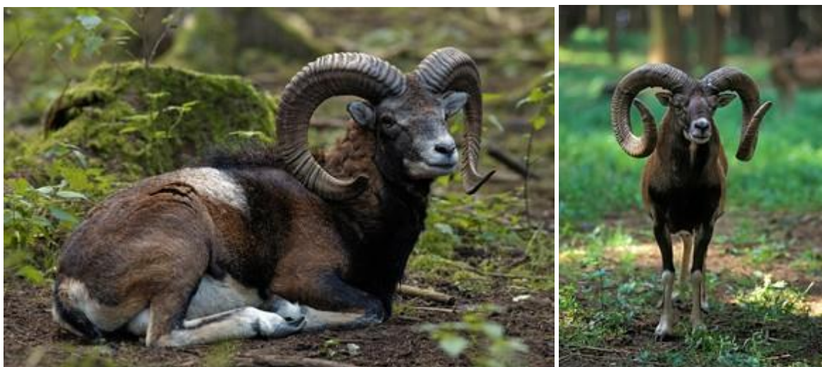
Slika 11. Obični muflon ( Ovis ammon )