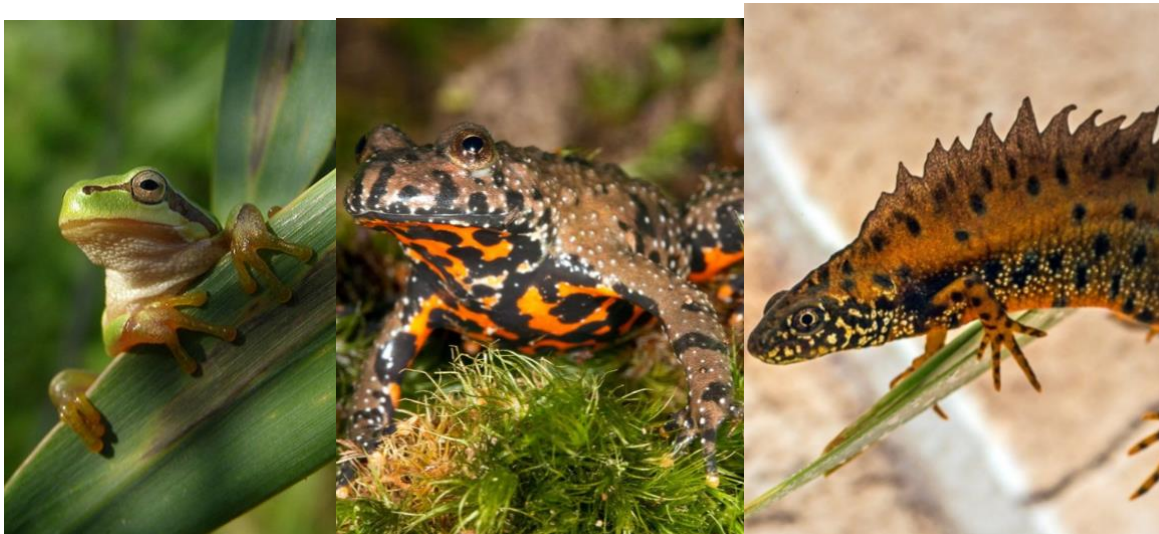
Slika 8. Vodozemci Kopačkog rita A) obična gatalinka ( Hyla arborea )

Faunu vodozemaca Kopačkog rita čini 11 vrsta, od ukupno 20 vrsta vodozemaca Republike Hrvatske. Vodozemci su svojom biologijom vezani uz močvarna i vodena staništa, a nestanak vodenih površina drastično smanjuje broj vodozemaca. Kopački rit je područje vrijedno posebne zaštite, kao stanište potencijalno ugroženih vrsta obalnih, vlažnih i vodenih staništa, za vrste kao što su veliki panonski vodenjak ( Triturus cristatus dobrogicus ) (Slika 8C), crveni mukač ( Bombina bombina ) (Slika 8B) i obična gatalinka ( Hyla arborea ) (Slika 8A). Fauna vodozemaca je ugrožena razvojem poljoprivrede, melioracijama i kanaliziranjem vodotoka te uništavanjem i fragmentacijom staništa (Benčina i sur., 2010).