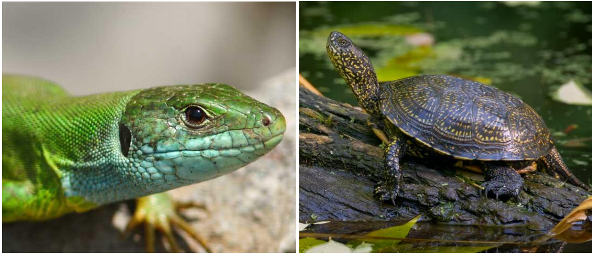
Slika 9. Gmazovi Kopačkog rita A) zelembać ( Lacerta viridis ) B) barska kornjača ( Emys orbicularis )

natrix ), kockasta vodenjača ( Natrix tessellata ) i barska kornjača ( Emys orbicularis ). Ostale vrste gmazova rasprostranjene su na višim terenima koji gotovo nikad nisu plavljeni.