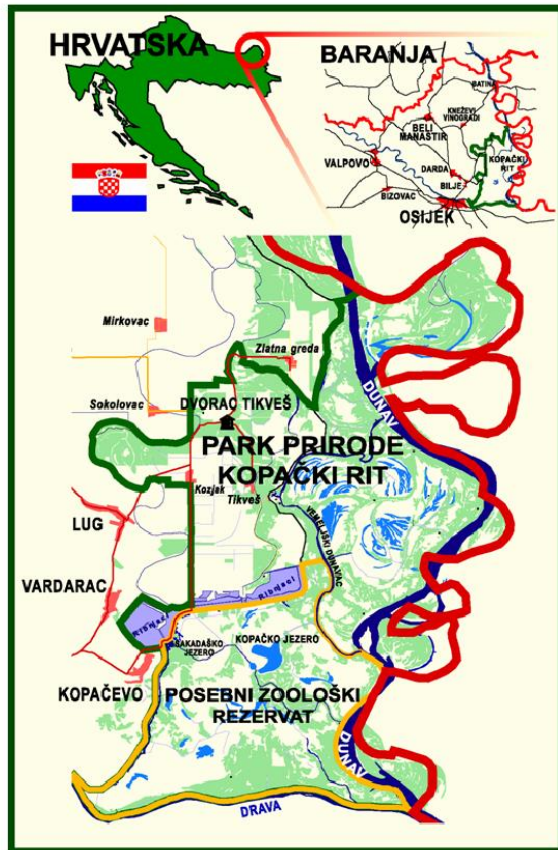
Slika 4. Prikaz geografskog položaja Kopačkog rita (Benčina i sur., 2010).

Miholjca na zapadu. Kopački rit se prostire između 45° 32' i 45° 47' sjeverne geografske širine te 18° 45' i 18° 59' istočne geografske dužine (Slika 4). Nadmorske visine terena kreću od 78 m (dno Kopačkog jezera) do 86 m i tako pripadaju najnižem dijelu Baranje ( https://pp-kopacki-rit.hr/jupp-kopacki-rit/ ).