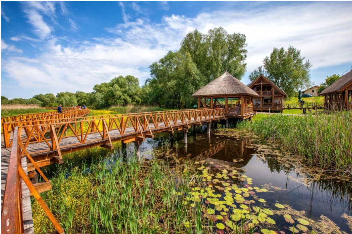
Slika 3. Dio Parka prirode Kopački rit uz upravnu zgradu ( https://novo.hr/u-park-prirode-kopacki-rit-ulaze-se-11-milijuna-kuna/ )

Biološku stanicu „Albertina“. Nakon Drugog svjetskog rata dvorac se nacionalizira i koristi se kao rezidencijalno lovačko središte kojim upravlja Državno dobro „Belje“, a od 60-tih godina Lovno-šumsko gazdinstvo „Jelen“. Ukazom Sabora Republike Hrvatske Kopački rit 1967. godine postaje Upravljeni prirodni rezervat. Nakon Domovinskog rata Vlada Republike Hrvatske 1997. godine osniva Javnu ustanovu Park prirode Kopački rit koja je preuzela upravljanje (Slika 3) ( www.pp-kopacki-rit.hr ).