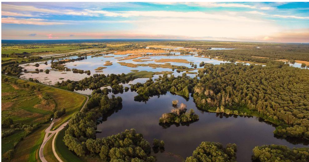
Slika 1. Primjer močvarnog područja – Kopački rit ( https://www.croatiaweek.com/wild-croatia-deers-kopacki-rit/ )

Močvarna staništa prekrivaju mali dio Zemljine površine, 4 do 6% površine kopna, ali pripadaju najvažnijim ekološkim sustavima Zemlje. Močvare nalazimo na svim kontinentima, osim Antarktike, i u svim klimatskim regijama, od najviših planina pa sve do oceana. Zdrava močvarna područja pohranjuju i pročišćavaju vodu, sprječavaju obalnu eroziju te ublažavaju posljedice suša i poplava. U močvarnim su područjima pohranjene velike količine ugljika pa obnavljanjem i očuvanjem takvih staništa povećavamo svoju sposobnost prilagođavanja klimatskim promjenama. Bitno je napomenuti da su močvarna staništa ključna za razvoj agrikulture i ribarstva, stoga pametnim upravljanjem močvarnim staništima možemo osigurati dugoročni izvor hrane i povećati bioraznolikost samog staništa ( www.wetlands.org ). Močvaru čini tlo natopljeno najčešće slatkom vodom (Slika 1). Stanište je brojnih biljnih i životinjskih vrsta. Na močvarnim staništima nalazimo zajednice koje vole vodom natopljeno mineralno i organsko tlo, a opstaju samo uz konstantan višak vode ( www.voda.hr ). Močvarna staništa su najugroženiji ekosustavi, zbog isušivanja, onečišćenja i prekomjernoga iskorištavanja resursa. U Hrvatskoj je zabilježeno 3.883 lokaliteta koji se mogu izdvojiti kao močvarno područje i 11 velikih močvarnih kompleksa, ukupne površine veće od 800 000 ha te niz manjih močvarnih cjelina (Duplić i sur., 2015).