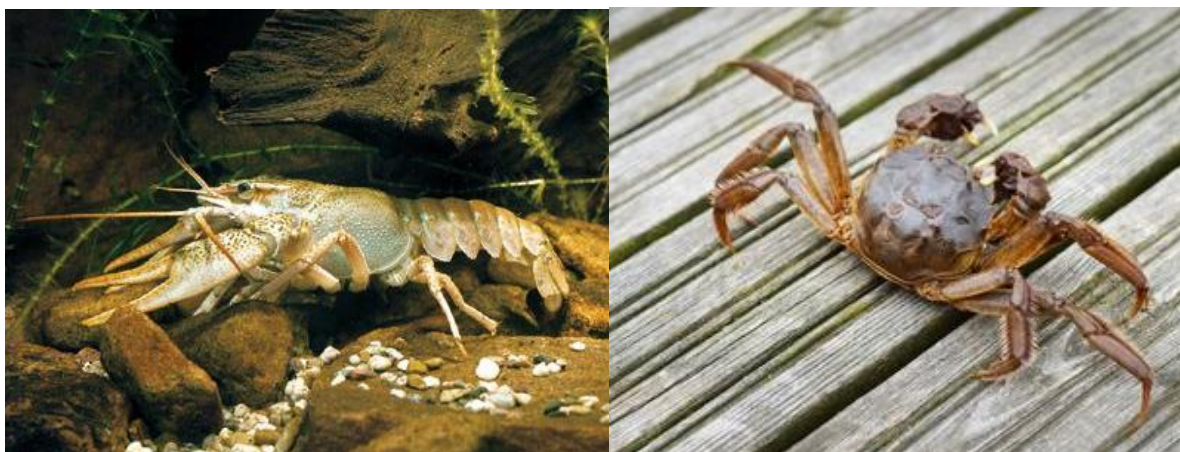
Slika 5. A) Autohtoni dekapodni rak s područja Kopačkog rita i rijeke Dunav ( Astacus leptodactylus ), B) Invazivna vrsta kineske rakovice ( Eriocheir sinensis )