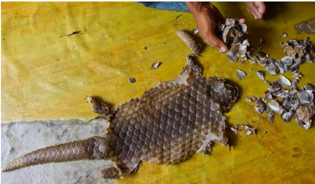
Slika 2: Prikaz kože i ljuski od pangolina

(MINGOR 2017). Zbog visokog profita ilegalna trgovina je vrlo unosna i uključuje financijski motivirane lokalne lovce, kriminalne skupine, dužnosnike, prodavače i potrošače (Smith i sur. 2017). Kina čini najveće svjetsko tržište ilegalnim životinjama i njihovim dijelovima (Wilson Center 2016). Ilegalna trgovina glavni je uzročnik smanjenja bioraznolikosti i populacija divljih vrsta, dovodeći ih pred izumiranje (Nijman i sur. 2018.). Pangolini ( Pholidota ) su sisavci s kojima se najviše ilegalno trguje. Sve vrste pangolina su zaštićene. Unatoč tome jako su traženi u području Azije, naročito Kini i Vijetnamu, gdje se konzumira njihovo meso, a ljuske se koriste u tradicionalnoj medicini za liječenje astme, reume, artritisa (slika 2). Godine 2019., samo za potrebe medicine, uhvaćeno je 195 000 jedinki pangolina, a u rasponu od 10 godina trgovalo se s više od milijun jedinki (WWF 2022).