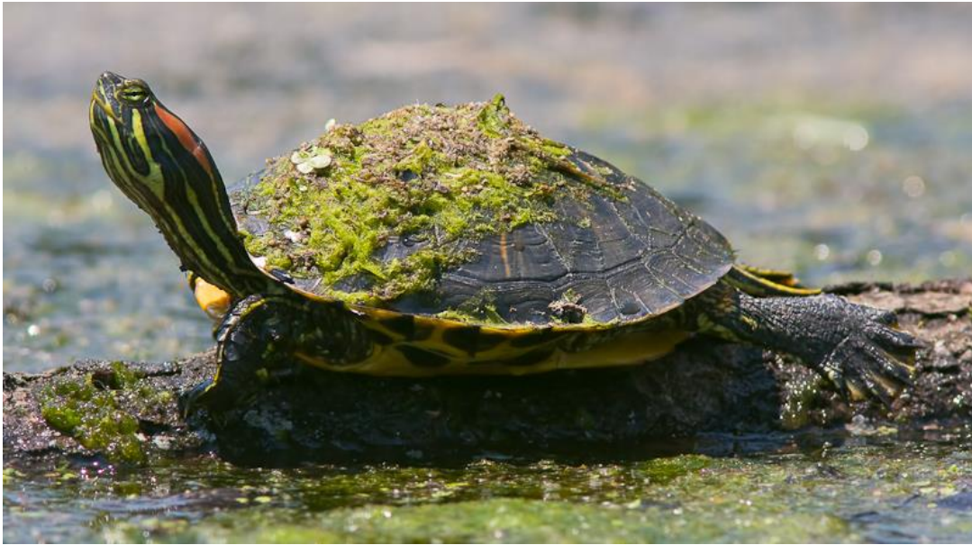
Slika 7: Invazivna vrsta, crvenouha kornjača ( Trachemys scripta )(preuzeto iz https://zoopalic.com/zivotinje/gmizavci/crvenouha-kornjaca/ )

Upravljanje invazivnim vrstama zahtjeva velike financijske troškove. Tako godišnje USA izdvoji oko 120 milijardi dolara (Dorcas i sur. 2012). Zbog toga fokus bi trebao biti na sprječavanju uspostave invazivnih vrsta. Poznavanje ponude i potražnje tržišta te bolje razumijevanje razloga za puštanje ljubimaca u prirodu dalo bi veće mogućnosti za sprječavanje uspostave invazivnih vrsta (Lockwood i sur. 2019). Usporedbom staništa vrsta također bi se mogla predvidjeti vjerojatnost da životinja postane invazivna u novom staništu (Sinclair i sur. 2021).