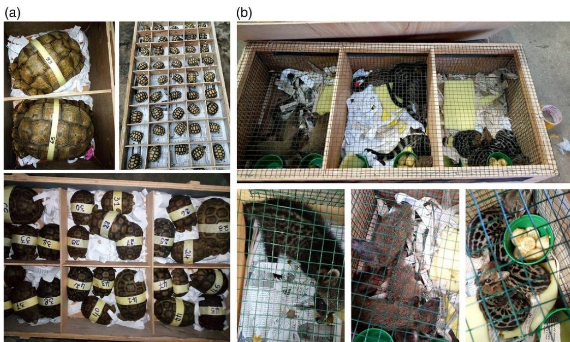
Slika 5: Prikaz načina transporta životinja (preuzeto iz Harrington i sur. 2021)

Veliki stres životinje doživljavaju i tijekom transporta, naročito ilegalnog. Životinje većinom prolaze i kroz nekoliko posrednika prije nego dođu do finalnog kupca (Robinson i sur. 2018). Smrtnost tijekom ilegalnog transporta je iznimno visoka, a procijenjuje se da za svaku čimpanzu koja je ljubimac, barem je 10 jedinki uginulo zbog metoda lova i transporta (Euro group for animals 2020). Često je transportni prostor malen i onemogućava kretanje. Harrington i sur. (2021) proveli su analizu Facebook profila dvaju izvoznika divljih životinja na području Toga u razdoblju od 2016-2020. U oglasima u kojima je vidljiv cijeli kavez u kojem se nalazi životinja, gledana je količina prostora, zaklon, broj jedinki i pristup vodi. Na slikama većinom se moglo izbrojati od jedne do dvadesetak životinja, s iznimkama gdje je u istom prostoru bilo i do stotinjak jedinki. Ni na jednoj slici nije uočeno nikakvo obogaćenje prostora niti zaklon, a 85% nije sadržavalo izvor vode. (slika 5)