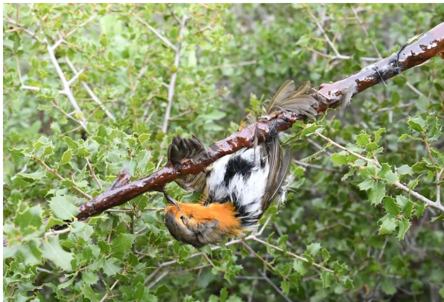
Slika 4: Uginuli crvendać sa zalijepljenim krilom, kljunom i nogama u ljepljivoj zamci

Metode hvatanja životinja iz prirode često su nespecifične i mogu uloviti neželjenu vrstu životinje (Euro group for animals 2020). Osim direktnog lova koriste se i zamke koje mogu biti neletalne ili letalne, ovisno o namjeni životinje. Neke od zamki koje se koriste su kavezi, mreže, omče, jame, nazubljene stupice i ljepljive zamke. Životinje mogu uginuti od ozljeda, gladi ili biti napadnute od drugih životinja. Unatoč zabranama u nekim državama Europe hvatanje ptica ljepljivim zamkama je još uvijek zastupljeno. Ljepila se nanose na grane drveća blizu kojih su postavljeni kavezi u kojima se nalaze ptice. One svojim pjevom dozivaju divlje jedinke koje slijetanjem na obližnje grane budu uhvaćene u ljepljivo. Ptice hvatane ovakvom metodom mogu ozlijediti perje i udove, a često i ugibaju (Slika 4) (Willsher 2019).