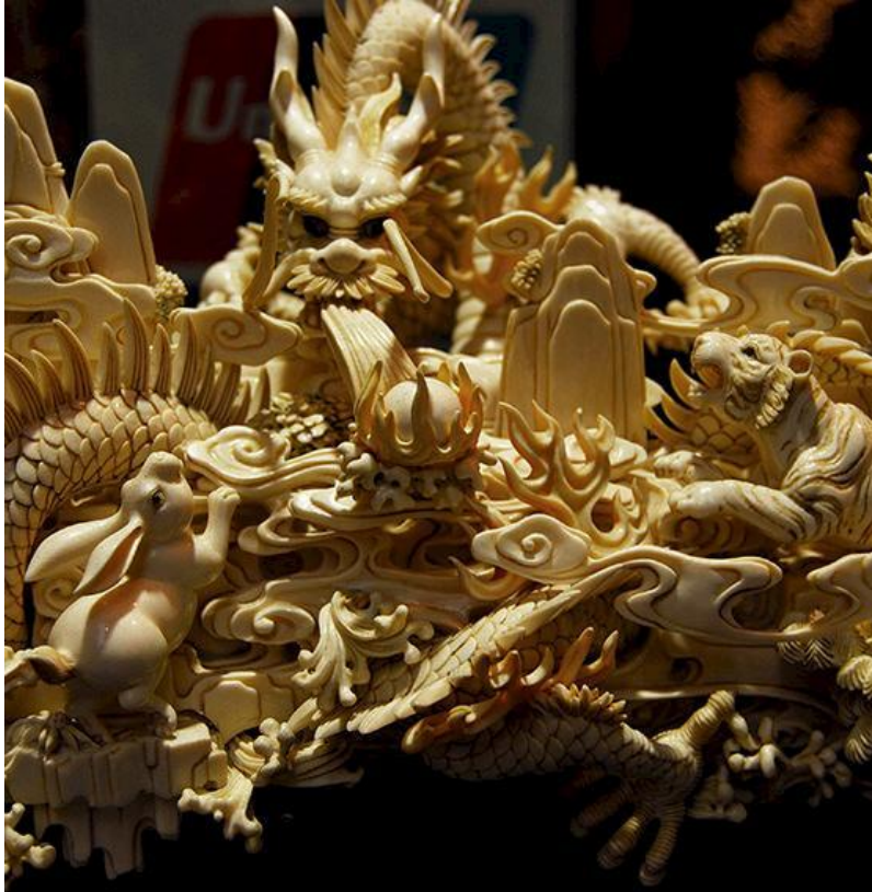
Slika 3: Ukasni predmet izrađen od bjelokosti

ukrasnih predmeta (slika 3). Takvi predmeti simboli su moći i statusa. U 2012. godini zbog potražnje je ubijeno 22 000 slonova (MINGOR 2017), a u razdoblju od 2009. do 2016. populacija slonova je pala za 30% (Traffic 2020).