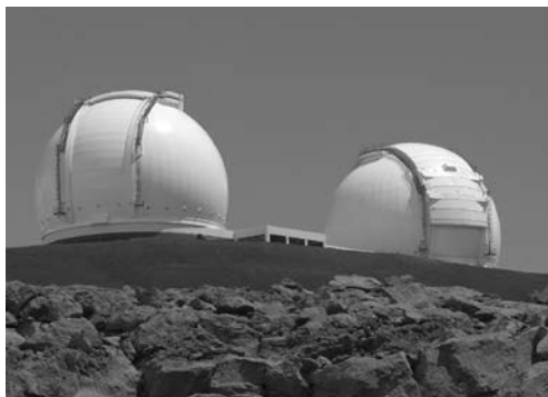
Teleskopi Keck, Mauna Kea, Havaji.

U tom periodu uvidjelo se da se kvazari nalaze u središtima drugih galaksija. Pitanje koje se nameće je što je sa središtem naše galaksije: je li i tamo crna rupa. Nadalje, kako možemo razlikovati crnu rupu od neke druge nakupine materije. Ako je masa objekta u središtu toliko velika da oko njega kruže zvijezde, možemo pratiti njihove putanje, doznati koliko traje jedan krug te koliko blizu priđu središtu. Iz toga bi se moglo odrediti koliko je središnja masa zbijena. Iz toga bismo mogli zaključiti je li izgrađena od poznate materije ili je gušća od bilo koje druge poznate. Ovo zadnje bi značilo da se radi o crnoj rupi.