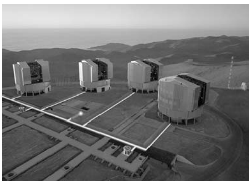
Very Large Telescope, Paranal, Čile.

Najveća prepreka toliko velikim teleskopima za postizanje potrebne oštine je atmosfera na Zemlji koja uzrokuje izobličenja slike. Jedna od prvih tehnika korištenih za poboljšanje rezolucije bazirala se na tome da se umjesto jednog dugog perioda snimanja (ekspozicije) koristi više kratkih koji se međusobno kombiniraju uz korekciju pomaka. Time se eliminiraju deformacije slike koje nastaju zbog gibanja masa zraka u atmosferi. Nadalje, razvoj tzv. adaptivne optike u teleskopima omogućio je postizanje dovoljne preciznosti da se sitni pomaci zvijezda mogu razaznati. Daljnji razvoj tehnika omogućio je poboljšanje rezolucije od ukupno 1000 puta kroz period od 30-tak godina u kojem se pratilo zvijezde. Za više detalja pogledati [2].