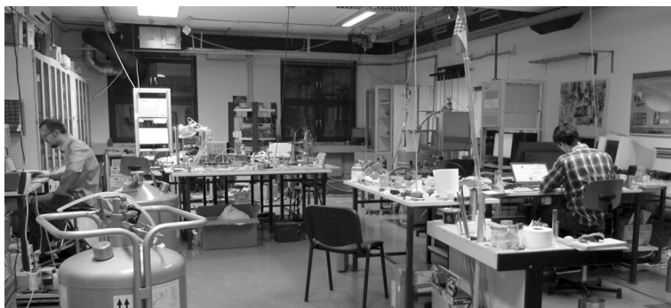
Slika 3. Laboratorij za NMR čvrstog stanja Fizičkog odsjeka PMF-a Sveučilišta u Zagrebu uspostavljen je u okviru EU projekta SOLeNeMaR (2009–2012) pod vodstvom prof. dr. sc. Miroslava Požeka.

Simetrija parametra uređenja i mehanizam sparivanja Cooperovih parova su jedni od najintrigantnijih problema aktualne fizike čvrstog stanja. U pniktidima supravodljivo sparivanje ne nastaje zbog konvencionalnog elektron-fonon vezanja (ionskih vibracija koje djeluju privlačno između dva elektrona) kakvo je dano BCS teorijom, već je posljedica nekonvencionalnog mehanizma sparivanja uslijed elektron-elektron Coulombske interakcije.