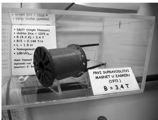
Slika 1. Prvi supravodljivi magnet u Zagrebu ( \text{NbZr} , B = 3.4\text{ T} ) konstruirao je prof. dr. sc. Amir Hamzić 1972. godine.

Primjena supravodiča danas, u moćnim magnetima koji se nalaze u istraživačkim i dijagnostičkim uređajima te u vrlo preciznim (SQUID) magnetometrima, samo je manji dio mogućnosti primjene koje se mogu otvoriti ako se otkriju supravodljivi materijali s dovoljno visokim kritičnim temperaturama (temperatura ispod koje materijal postaje supravodljiv), magnetskim indukcijama i gustoćama električne struje. Za primjenu u tehnologiji je ključno da kritična temperatura bude iznad temperature tekućeg dušika (77 K, -196.15^{\circ}\text{C} ) jer je tekući dušik mnogo jeftiniji od ostalih kriogenih tekućina (helij, vodik) i lako se transportira. Kod klasičnih supravodiča (metali i njihove legure s nižim kritičnim temperaturama) teorijski okviri su dobro razrađeni (mikroskopska BCS teorija iz 1957. godine u kojoj se opisuje stvaranje Cooperovih parova elektrona koji se ponašaju kao bozoni – subatomske čestice cjelobrojnog spina i specifičnih svojstava koja omogućuju kretanje bez gubitaka energije). Nasuprot tome, brojni istraživači zadnjih desetljeća nastoje usavršiti teorijske modele drugog tipa materijala – visokotemperaturnih supravodiča [Bednorz & Müller, 1986]. Najvišu kritičnu temperaturu 92 K ( -181.15^{\circ}\text{C} ) imao je oksidni kuprat \text{YBa}_2\text{Cu}_3\text{O}_7 otkriven 1987. godine. Hrvatski fizičari aktivno se uključuju u eksperimentalna i teorijska istraživanja visokotemperaturne supravodljivosti, pregled je već dan u MFL-u (Barišić & Barišić, 2015–2016).