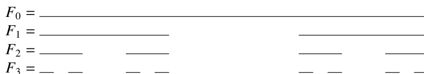
Slika 1.2: Prva četiri koraka konstrukcije Cantorovog skupa

Prva četiri koraka konstrukcije prikazana su na slici 1.2