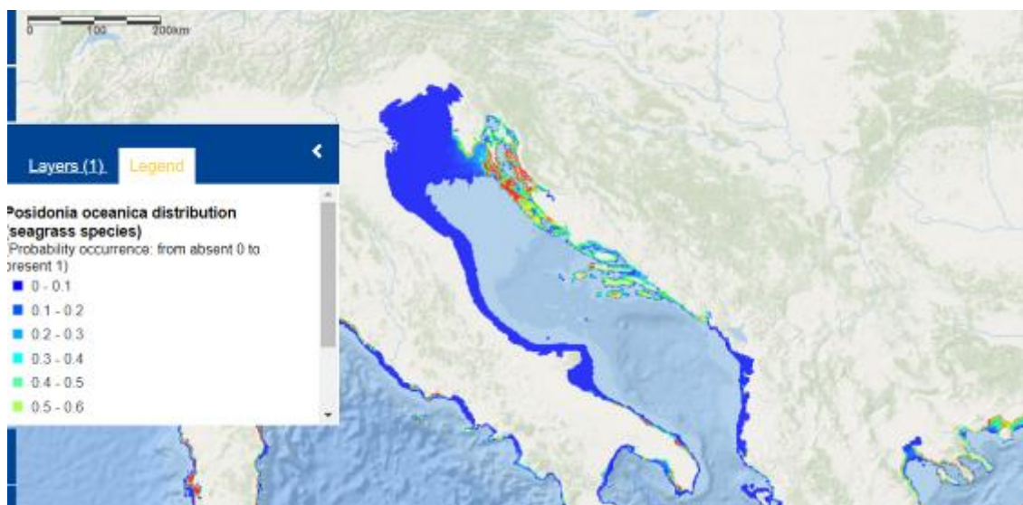
Slika 3. Uvećani prikaz rasprostranjenosti Posidonia oceanica za područje Jadrana. (Photo: EMODnet).

Kao što je vidljivo na slikama Posidoniju je moguće pronaći duž cijele hrvatske obale Jadrana, naročito u moru kod Kvarnera i Kvarnerskih otoka, sjevernog djela Zadarske županije te na južnim otocima Hvaru, Visu i Lastovu. Pošto cvijetnice Posidonije imaju značajnu ulogu u poboljšanju kvalitete morske vode, apsorpciji CO 2 iz atmosfere, zaštiti obale od udara valova,