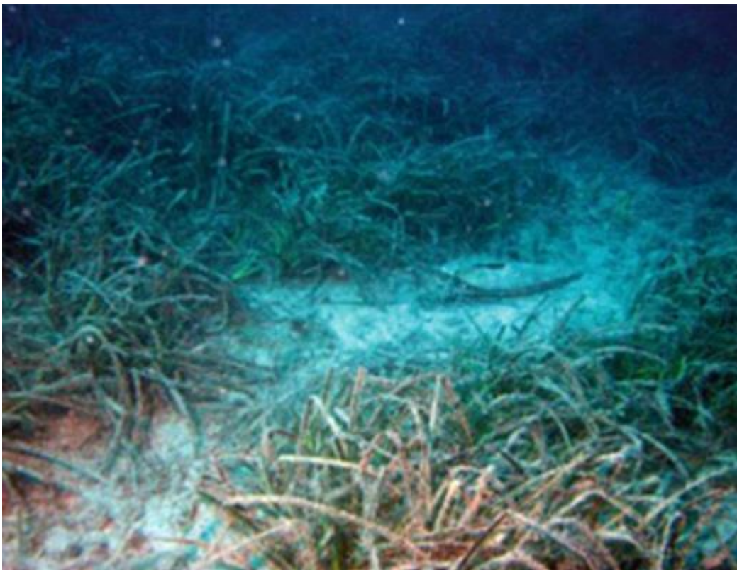
Slika 1. Ugroženost Mediteranske endemskih vrsta Posidonia oceanica i Pinna nobillis je direktni učinak ljudskog djelovanja na okoliš..

Gradnja luka i uvala, rekreativna plovidba, otpuštanje balasta i sidrenje jedan su od glavnih uzroka uništavanja prirodnog habitata i unošenja invazivnih vrsta. Primjer je sidrenje unutar cvjetnica Posidonije ( Posidonia oceanica ) koje ima utjecaj na samo stanište i na povezane organizme. Također sidrenje može oštetiti individualno vrste kao što je zabilježeno kod masovnog izumiranja Periske ( Pinna nobilis ).