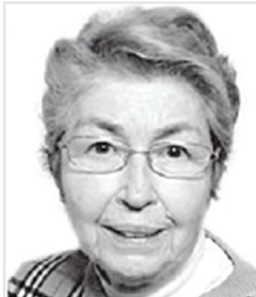
Vesna Švarcer (1935. – 2022.), izvanredna profesorica Medicinskog fakulteta Sveučilišta u Rijeci, pionirka upotrebe gama-sonde za određivanje akumulacije joda u štitnjači i jedna od utemeljiteljica nuklearne medicine u Rijeci 1965. Koautorica je udžbenika Vježbe iz fizike u četiri izdanja. Dobitnica je Zahvale za napredak hrvatske nuklearne medicine 1993.