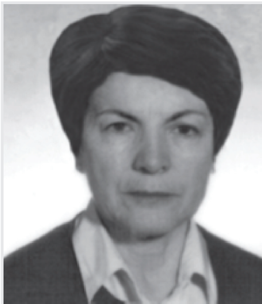
Branka Mikuličić (1929. – 2014.), istaknuta metodičarka nastave fizike, gimnazijska profesorica, stručna savjetnica na PMF-u, autorica udžbenika, radnih bilježnica, priručnika te zbirki zadataka iz fizike. Dobitnica je nagrade „Davorin Trstenjak“ za doprinos unapređivanju školske literature (1986.). (MFL, 2014. – 2015., 298)