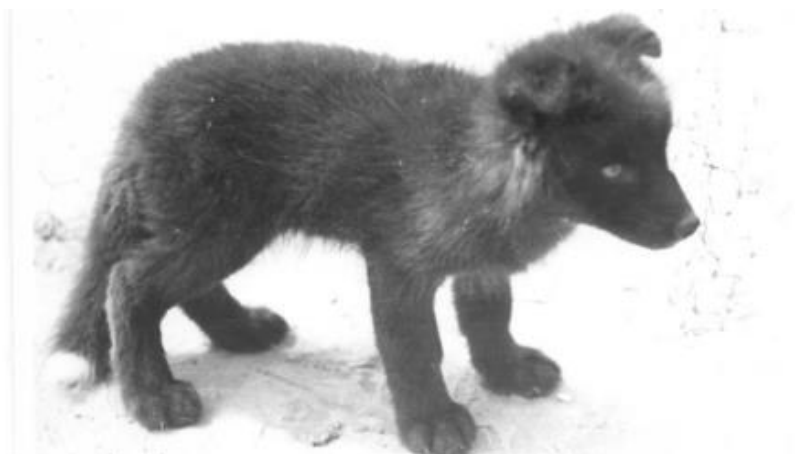
Slika 7. Jedinka s klempavim (spuštenim) ušima (Dugatkin 2018)