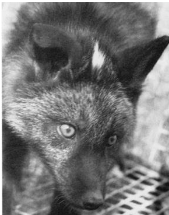
Slika 8. Jedinika s bijelom mrljom na čelu (Trut 1999)

U sljedećim su se generacijama uočili i zavijeni repovi (Trut 1999). Između 15. i 20. generacije zabilježene su lisice s kraćim repovima i nogama (Trut 1999). Tijekom 1980-ih godina (10. do 20. generacija) izgled lisica toliko se promijenio da je jednom prilikom stanovnik predgrađa Novosibirska koji je prolazio pored farme, zamijenio lisicu za psa lutalicu (Dugatkin i Trut 2019). Provedena su mjerenja glave lisica te je zaključeno da su im njuške postale kraće i šire, a lubanje manje (Dugatkin i Trut 2019). Ujedno su uočene jedinice s nepravilnim zagrizom (eng. underbite and overbite ) (Trut 1999). Kod divljih lisica postoji spolni dimorfizam koji se manifestira kao razlika u veličini – mužjaci imaju veće lubanje te su prisutne razlike u proporcijama; no ta se razlika smanjila kod pripitomljenih lisica (Trut 1999).