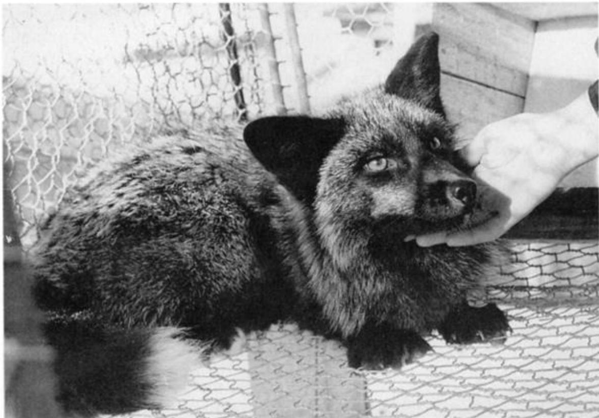
Slika 3. Demonstracija ponašanja lisice pitome populacije (Trut 1999)