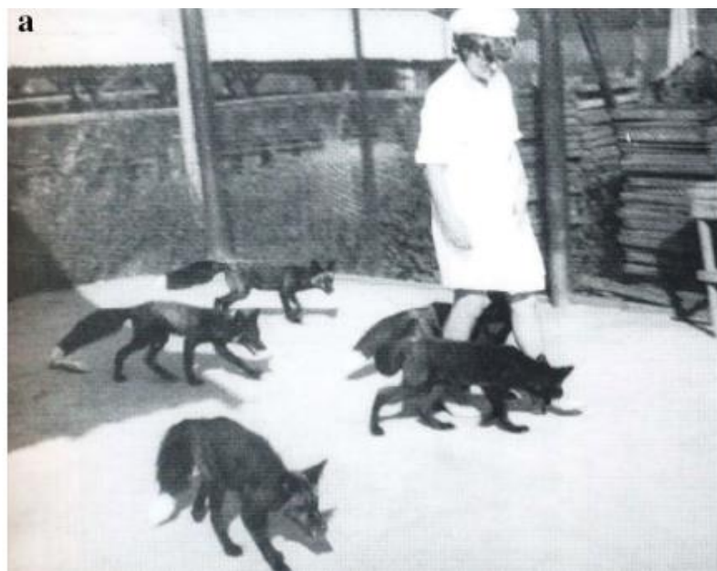
Slika 4. Ljudmila Trut u društvu pitomih lisica (Dugatkin 2018)

Prvo što se može primijetiti kod pitomih lisica jest njihova prijateljska nastrojenost prema čovjeku. Na početku eksperimenta većina je lisica prilikom hranjenja režala i micala se od ljudi. Sljedeće generacije bile su neznatno mirnije, promjene u ponašanju bile su suptilne, međutim pojavile su se brže od očekivanog (Dugatkin i Trut 2019). Prvo ponašanje nalik na psa bilo je mahanje repom, a uočeno je kod samo jednog lisičića u četvrtoj generaciji. Sljedeće su generacije bile izrazito pitomije, a u šestoj se generaciji pojavilo još psećeg ponašanja – prevrtanje na leđa, trljanje uz ljude, traženje glađenja, lizanje, cviljenje kao zahtijevanje pažnje (Dugatkin i Trut 2019). Već u prvom desetljeću eksperimenta uočene su velike promjene. Najpitomije jedinke dopuštale su da ih se nosi te su stvorile čvrste emocionalne veze s ljudima čak do mjere da su im dopuštali da ih se gleda u oči što se u prirodi smatra izazovom koji dovodi do agresije (Dugatkin i Trut 2019). Do sredine 1980-ih godina većina se najpitomijih lisica odazivala na svoja imena i pokazivala ostala ponašanja slična psećima (Dugatkin i Trut 2019).