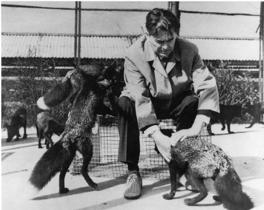
Slika 1. Dmitrij Beljajev u društvu pripitomljenih lisica (Trut 1999)

Domestifikacija ili pripitomljavanje je evolucijski proces koji je bitan dio naše povijesti. Omogućio nam je lakše iskorištavanje genetičke raznolikosti organizama iz naše okoline, ali je i tim organizmima zajamčio opstanak i sigurnost od izumiranja (Opašić 2010). Najstariji i najpoznatiji slučaj pripitomljavanja jest pas kojega je čovjek pripitomio iz vuka oko 15 000 god. pr. Kr. Kako bi nastupile promjene koje se vide u prelasku vuka u psa, potreban je dug period. Osim znanstvenicima, pripitomljavanje je tema zanimljiva i piscima – roman za mlade „Pax” autorice Sare Pennypacker, prati dječaka koji je pokušao pripitomiti lisičića koji je ostao bez majke. Ruski zoolog i genetičar Dmitrij Beljajev zainteresirao se za pitanje procesa pripitomljavanja psa, stoga je odlučio simulirati taj proces. Za modelni organizam odabrao je lisicu koja je bliski srodnik vuka te bi mogla vjerno prikazati promjene koje su nastupile u pripitomljavanju psa prije 17 000 godina (Dugatkin i Trut 2019). Cilj je ovoga rada prikazati promjene u ponašanju i izgledu lisica koje su nastupile u ovom eksperimentu.