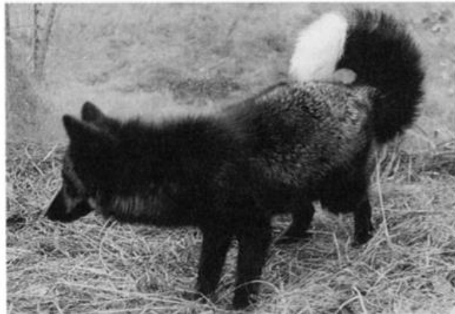
Slika 9. Jedinke s kratkim repom (gore) i zavnutim repom (dolje) (Trut 1999)