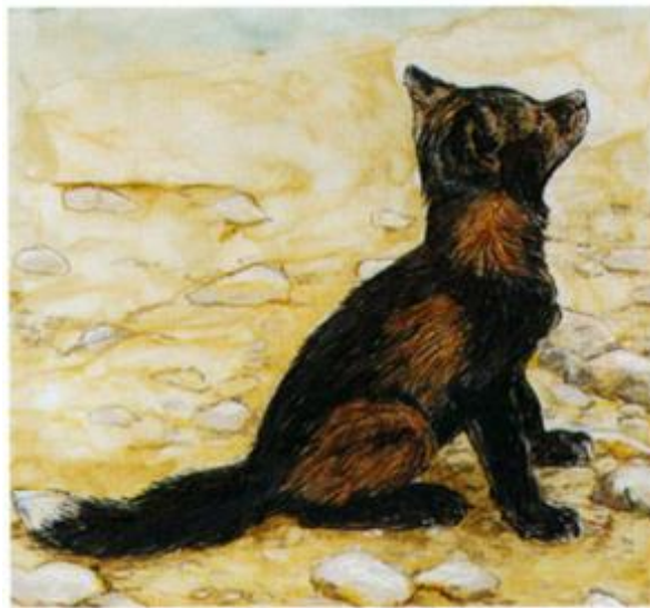
Slika 6. Ilustracija koja prikazuje išaranost krzna (Trut 1999)

Prve promjene u izgledu počele su se pojavljivati oko 10. generacije. Najprije je uočena išaranost krzna (Trut 1999). Usto se u toj generaciji pojavila se ženka koja je zadržala klempave (spuštene) uši karakteristične za mladunce te mužjak s bijelom mrljom u obliku zvijezde na čelu (Dugatkin i Trut 2019). Beljajev je gen koji utječe na depigmentaciju na čelu nazvao „zvijezda“ radi karakterističnog izgleda, a pokazalo se da utječe na migraciju melanoblasta koji su odgovorni za pigmentaciju krzna (Trut 1999).