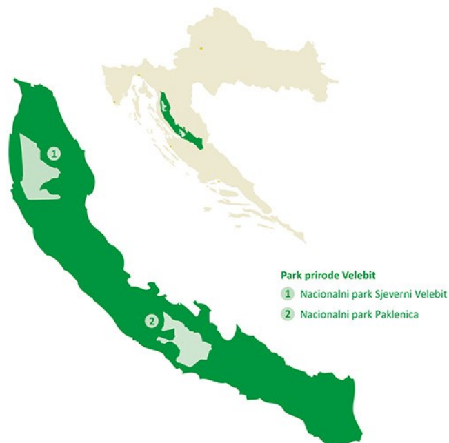
Sl. 1: Prikaz Sjevernog Velebita unutar granica Parka prirode Velebit te unutar granica RH

Prema članku 113. Zakona o zaštiti prirode (2020), nacionalnim parkom smatra se prostrano te pretežno neizmijenjeno područje kopna ili mora koje karakteriziraju iznimne i višestruke prirodne vrijednosti koje obuhvaćaju jedan ili više neznatno izmijenjenih ekosustava. Nadalje, namijenjeni su očuvanju izvornih prirodnih i krajobraznih vrijednosti, a mogu imati znanstvenu, kulturnu, odgojno-obrazovnu ili rekreativnu namjenu. U nacionalnim parkovima su također strogo zabranjene sve gospodarske uporabe prirodnih dobara te bilo koje djelatnosti koje ugrožavaju izvornost prirode. U Hrvatskoj postoji 8 nacionalnih parkova, a najmlađi od kojih je Sjeverni Velebit koji je radi svoje bogate raznolikosti krških oblika, živoga svijeta i krajobraza na malom prostoru 1999. proglašen nacionalnim parkom (MINGOR, 2023a). Smješten je u Ličko-senjskoj županiji, unutar administrativnih granica Grada Senja, a nalazi se u blizini Jadranskog mora, svega 2 km istočno od obale, a otprilike 15 km južno od Senja. Njegova površina obuhvaća 109 km 2 te se u potpunosti nalazi unutar Parka prirode Velebit (Plan upravljanja, 2007; Sl. 1).