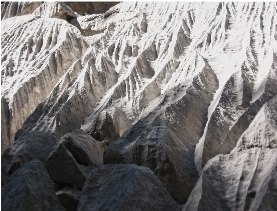
Sl. 4: Krški reljefni oblik – grižine

Oblikovanje i učestalost grižina ili izjedlina posljedica je međuovisnosti raznih prirodnih značajki poput geoloških, klimatskih, pedoloških, vegetacijskih i geomorfoloških, no čak i pod utjecajem antropogenog djelovanja (Perica i dr., 1999). Dok se grižine kao oblik javljaju najviše u nižim dijelovima Velebita i to na jugozapadu, počevši čak i od morske obale, česte su i u višim predjelima na Sjevernom Velebitu (NP Sjeverni Velebit, 2023d). Jedna od osnovnih odlika ovoga reljefnog oblika je njegova iznimna međusobna raznolikost te način nastanka (Bögli, 1980, prema Perica i dr., 1999). Oblikovanje grižina uvjetovano je nagibom padina, litološkim osobinama stijena te stupnjem njihove raspucalosti. S druge strane, njihov izgled uvjetovan je odnosom nagiba padine prema nagibu slojeva, stupnjem pokrivenosti (karbonatnih) stijena tlom i vegetacijom, tj. stupnjem ogoljenosti stijene što nadalje uvjetuje način na koji djeluje korozijska (Perica i dr., 1999).