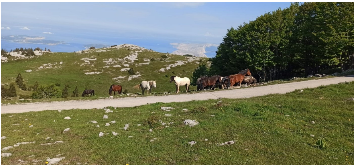
Sl. 12: Održavanje travnjaka ispašom konja na području Zavižana

Druga ustanovljena prijetnja je krivolov – od uspostave Parka i nadzora nad njime zabilježeno je tek nekoliko slučajeva krivolova unutar njegova područja i neposredne blizine.