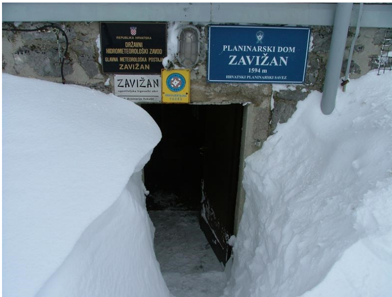
Sl. 3: Snijeg kako u potpunosti visinom prekriva ulaz u planinarski dom Zavižan

Unatoč tome što se najveći dio oborina spusti u hladnom dijelu godine, za topli dio su karakteristične grmljavine, prema čemu je Gromovača, vrh u blizini Zavižana, dobila i ime. Također, dok snijeg može pasti i tijekom cijele godine, a ne samo u zimskim mjesecima, intenzivnije snježno razdoblje može trajati čak i dulje od sedam mjeseci, dok se u udolinama i ponikvama može zadržati i ponekad kroz cijelu godinu, što se događa u takozvanim jamama snježnicama (NP Sjeverni Velebit, 2023b). Visina snijega koji padne na Zavižanu nerijetko dosegne i do iznad 130 centrimetara te se može dogoditi da visinom u potpunosti prekrije ulaz u planinarski dom (Sl. 3).