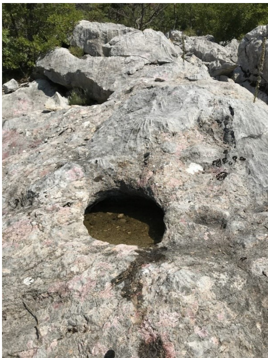
Sl. 5: Krški reljefni oblik – kamenica