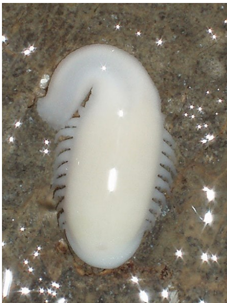
Sl. 10: Velebtiska pijavica