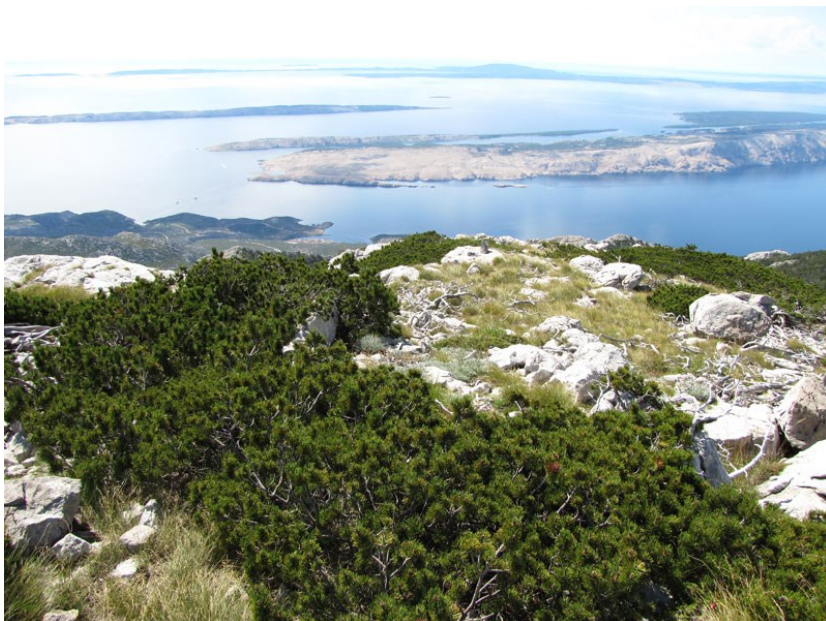
Sl. 8: Bor krivulj na vršnom pojasu Sjevernog Velebita