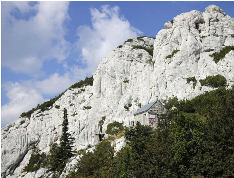
Sl. 6: Hajdučki i Rožanski kukovi

unutar pukotinskih sustava karbonatnih stijena, kao i duž slojnih ploha i ostalih diskontinuiteta unutar stijena. Špiljama smatramo objekte s horizontalnim ili blago nagnutim kanalima, dok pod jame spadaju speleološki objekti s vertikalnim ili strmo nagnutim kanalima čini je ukupni nagib veći od 45° (NP Sjeverni Velebit, 2023e).