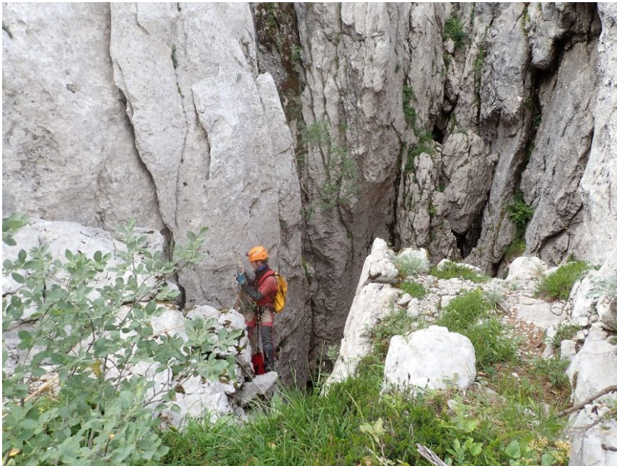
Sl. 7: Ulaz u Lukinu jamu

danas. Također je 2011. godine zabilježena prisutnost leda do dubine od 560 m ispod razine ulaza, što je najdublje zabilježeni led unutar svih speleoloških objekata u svijetu, a pretpostavlja se da može biti star i više od 400 godina. Također su zabilježene sige u još dubljim područjima. Lukina jama – Trojama također sadrži duboka sifonska jezera. U ovoj jami je prvi put otkriven endem velebitska ili Meštroljeva pijavica (NP Sjeverni Velebit, 2023f).