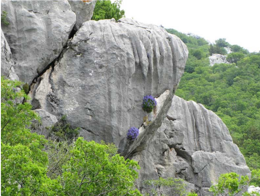
Sl. 9: Biljka kamenjarka kako raste iz pukotine u stijeni

kamenjare su dom i nekoliko drugih endemskih vrsta i podvrsta, čega najveći broj ima u Hajdučkim i Rožanskim kukovima – to su životinje poput velebitske gušterice, dinarskog voluhara i spomenute velebitske pijavice (NP Sjeverni Velebit, 2023i).