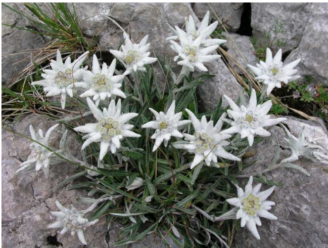
Sl. 11: Runolist

Velebita česti su i borealni (sjeverni) i arкто-alpski (sjeverno-alpski) florni elementi, što je djelomice posljedica oledbi kroz prošlost – zamrzavanjem je biljkama postajalo prehladno pa su se počele seliti južno, no otapanjem leda im se dogodilo suprotno te im je postajalo prevruće, zbog čega su opstale samo na vrhovima planina. Nakon toga se svaka vrsta počela razvijati zasebno ovisno o lokalnim uvjetima pa je tako Velebit postao jedan od četiri hrvatska središta endemizma. Do sada je unutar Parka zabilježeno više od 950 biljnih vrsta i podvrsta, od kojih je oko 40 lokalno rasprostranjenih strogih endema (NP Sjeverni Velebit, 2023k). Neke zaštićene biljne vrste unutar Parka su planinski stolisnik, kitajbelov pakujac, zimzelena medvjетка, hajnaldova nevesika, valdštajnov zvončić, hrvatska gušarka, klinčić kamenjar, osmica, planinski kotrljan, žuti srčanik, ilirska perunika, hrvatska sibireja i runolist, (NP Sjeverni Velebit, 2023k) koji nastanjuje pukotine vapnenačkih stijena uglavnom na sjevernim stranama. Runolist (Sl. 11) je, iako danas nije neposredno ugrožen, pripisan u kategoriju preventivno zaštitnog značenja. Runolist je također glacijalni relikv te je vrlo dobro prilagođen ekstremnim uvjetima staništa (Jolić, 2019).