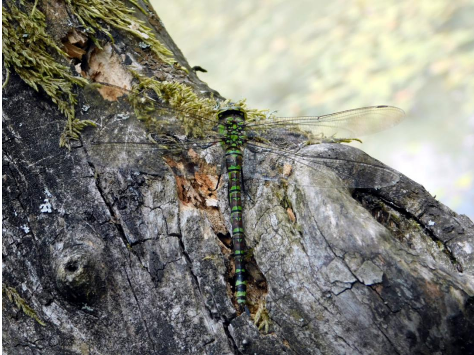
Slika 1: Anisoptera ili debelostruko vretence, Aeshna cyanea (Muller 1764)