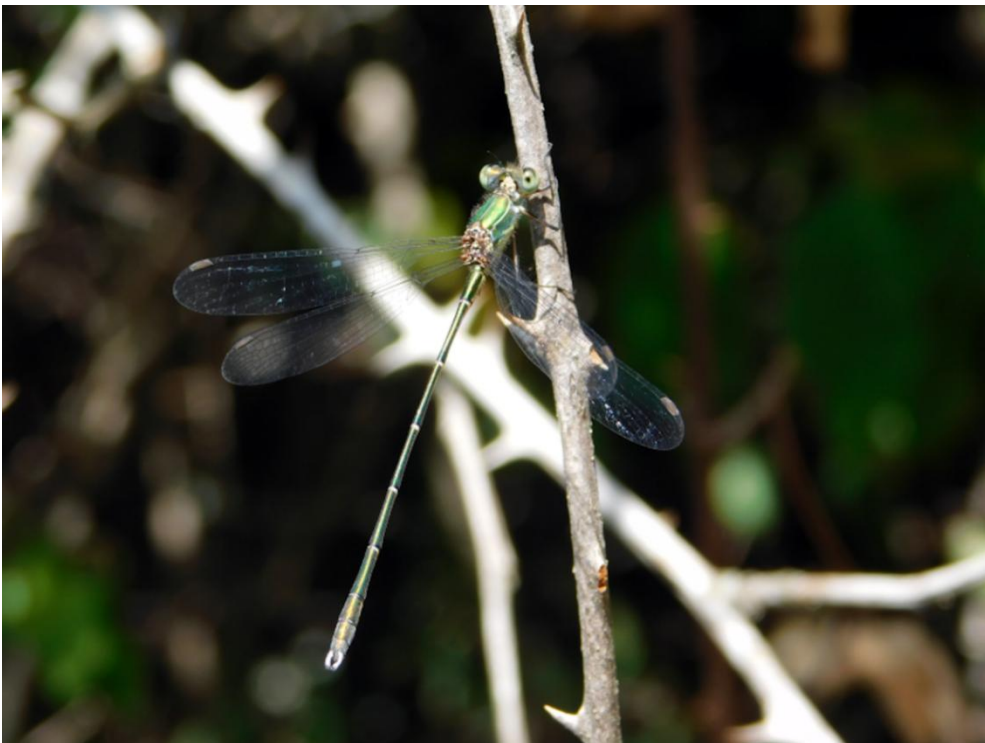
Slika 2: Zygoptera ili tankostruko vretence, Lestes parvidens (Artobolevsky 1929)