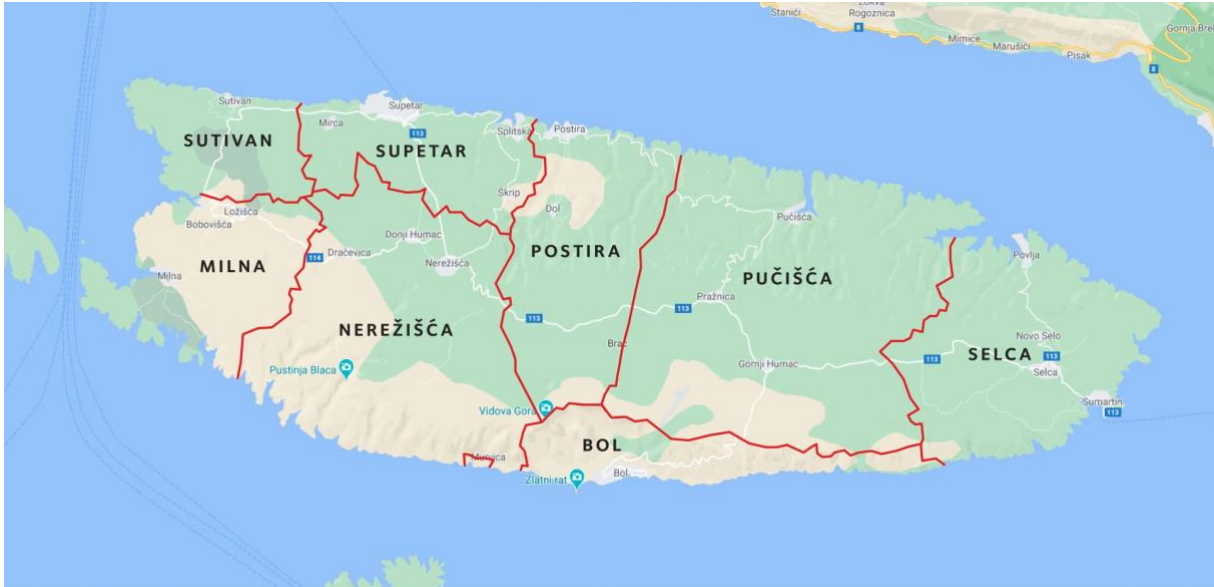
Sl. 2. Općine otoka Brača

jedna od najpopularnijih turističkih destinacija u srcu sezone, što zbog prirodnih ljepota i obale, a što zbog Zlatnog rata koji se u turističkom smislu probio na svjetsku scenu kao turistički fenomen i jedna od najpopularnijih plaža u ovom dijelu Jadrana.