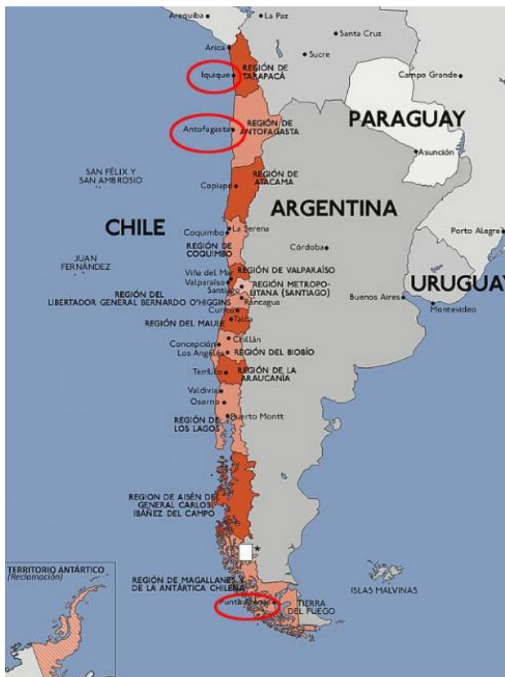
SL. 3. Pokrajine Tarapaca, Antofagasta i Magallanes