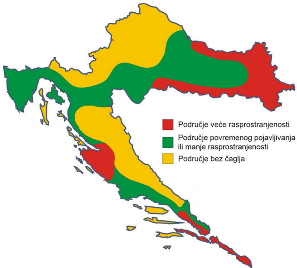
Slika 5. Rasprostranjenost čaglja u Hrvatskoj 2014. godine. Preuzeto iz Anonymus 2015.

Na slici 5 prikazana je karta Hrvatske 2014. godine s nešto skromnijom rasprostranjenosti čagljeva nego je to danas slučaj.