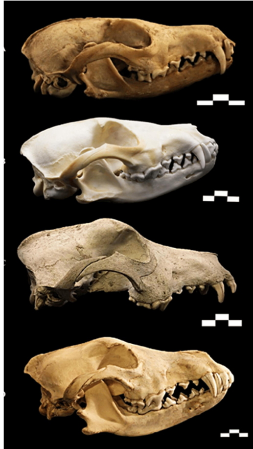
Slika 3. Lubanje porodice pasa ( Canidae ) gledano od gore prema dolje: 1. Lisica ( Vulpes vulpes ); 2. Zlatni čagalj ( Canis aureus ); 3. Pas ( Canis lupus familiaris ); 4. Vuk ( Canis lupus ).