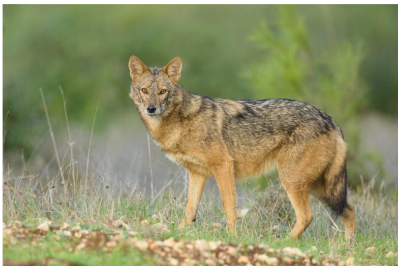
Slika 1. Zlatni čagalj ( Canis aureus ).

Zlatni čagalj ( Canis aureus ), prikazan na slici 1, autohtona je vrsta na prostoru Republike Hrvatske, a pripada porodici pasa i sitnoj dlakavoj divljači (Janicki i sur. 2007). Izvorno je prisutan u jugoistočnoj Europi, odnosno Balkanskom poluotoku (Pyšková i sur. 2016) i južnoj Aziji (Janicki i sur. 2007). Tradicionalo je smatran nativan i u sjevernoj Africi, no genomska istraživanja 2015. godine pokazala su divergenciju između euroazijske i afričke populacije. Prema tome, afrička populacija smatra se različitom vrstom, srodnija vuku ( Canis lupus ), nazivlja Canis anthus (Koepfli i sur. 2015).