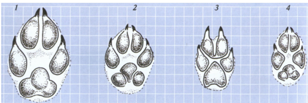
Slika 4. Trag divljači i omjer veličine traga: 1. Vuk ( Canis lupus L. ); 2. Pas (njemački ovčar); 3. Zlatni čagalj ( Canis aureus aureus L. ); 4. Lisica ( Vulpes vulpes L. ).