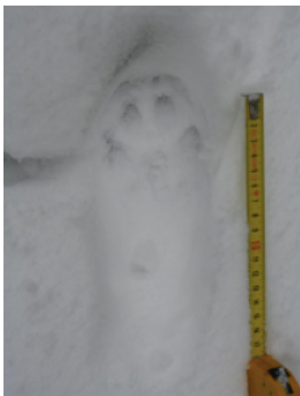
Slika 5. Trag šape risa u snijegu. Prikupljanje tragova kretanja neizostavan je dio monitoringa risova.

Praćenje rijetkih i neuhvatljivih vrsta poput risa, koji se skriva u gustim šumama, predstavlja izuzetno izazovan zadatak za istraživače i biologe. Veliki problem predstavlja nemogućnost direktnog prebrojavanja jedinki u prirodi. Iz tog razloga znanstvenici koriste inovativne metode poput neinvazivnog genetskog uzorkovanja, koje uključuje prikupljanje tragova kretanja, dlaka, izmeta, sline i urina (slika 5). Osim toga, kamere zamke postavljene u staništima risova pružaju dodatne informacije o njihovoj prisutnosti i aktivnosti.