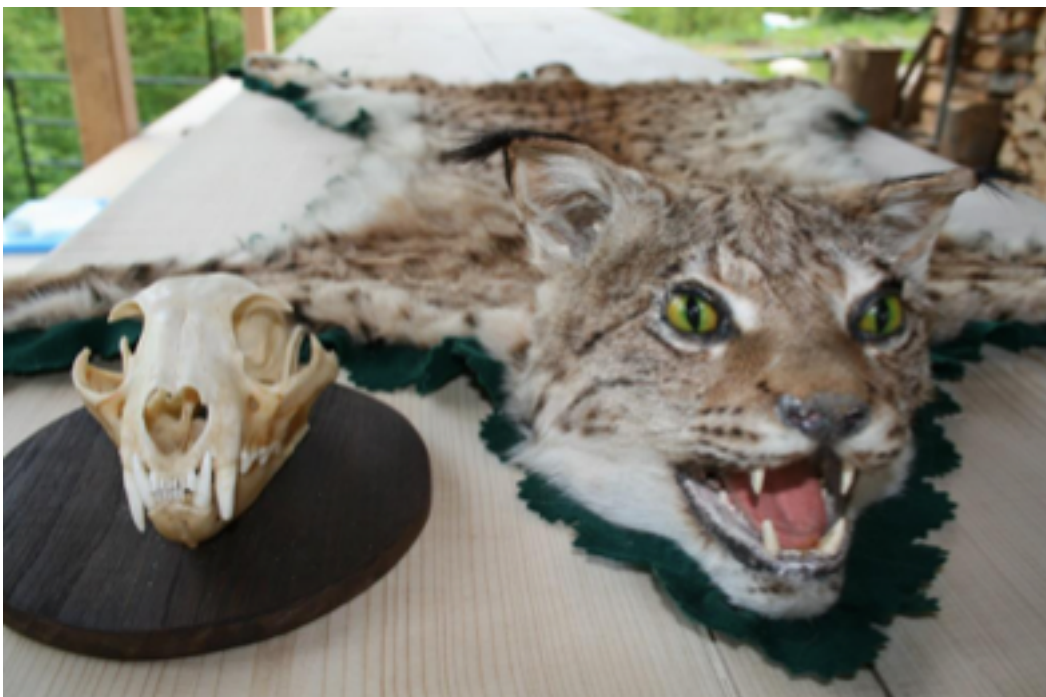
Slika 4. Krzno i lubanja ulovljenog risa.

Početak 20. stoljeća u Europi pa tako i u Hrvatskoj uočava se nestanak risova. Ova činjenica nije nimalo iznenađujuća s obzirom na njihove tadašnje uvijete u okolišu. Lov na risove je bio prečesta pojava toliko da su se uz pomoć njihovih kostiju i krzna, koje su ljudi čuvali kao ukras, proučavala te uspoređivala genetika tadašnjih i sadašnjih vrsta u okolišu (slika 4). Istraživači su uzimali lubanje i kosti risova, što su ih ljudi čuvali kao nagradu iz lova, te pomoću njih uspoređivali genetičke nasljednosti prijašnjih vrsta risova s reintroduciranim vrstama.