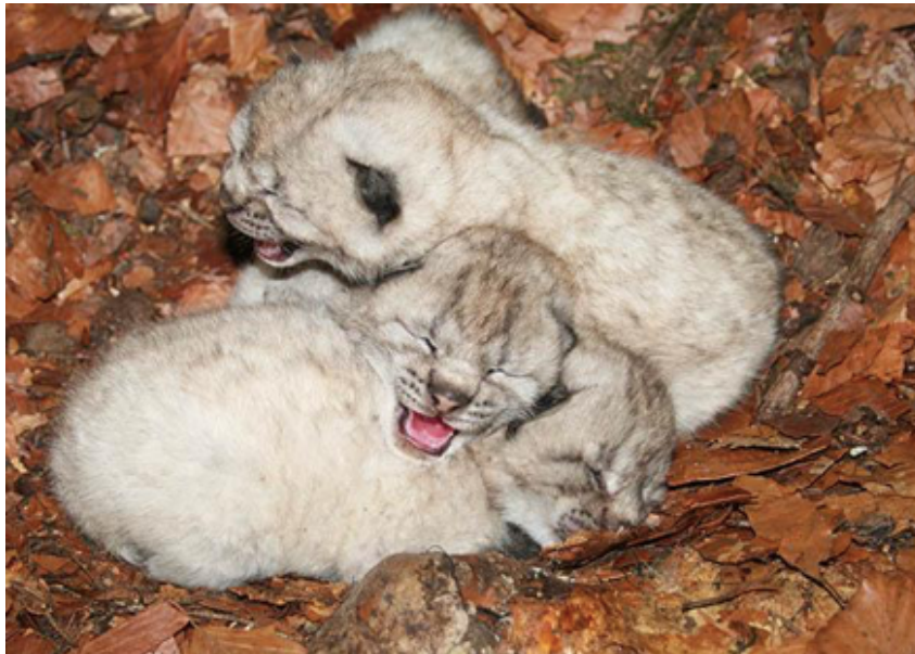
Slika 2. Prikaz mladunčadi risa u majčinom brlogu

Majku krenu pratiti u lov s tri mjeseca te se do godinu dana starosti zadržavaju s njom. Velika je smrtnost u prvih godinu dana života, jedva 50 % preživi. Prilikom odvajanja od majke mladunčad se još godinu dana drži zajedno pri pronalasku vlastitog životnog prostora, a stopa preživljavanja im je tek 50%.