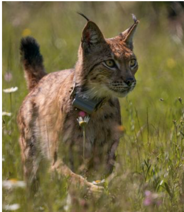
Slika 1. Čuperak crnih dlačica na vrhovima ušiju i crni vrh repa prepoznatljive su karakteristike risa.

Boja krzna varira o geografskom području i godišnjem dobu. Zimi je krzno dugo i gusto dok je boja pretežito siva, a ljeti kratko i smeđe. Krzno je prekriveno crnim pjegama što svaku jedinku čini jedinstvenom. Vrh repa je crne boje što predstavlja još jednu karakteristiku za raspoznavanje risa od drugih velikih mačaka (slika 1). Pandže uvlače kao domaće mačke, tako ih čuvaju od trošenja i osiguravaju oštrinu. Oštre ih na korama drveća, a osim za hvatanje plijena njihova uloga značajna je i u penjanju.