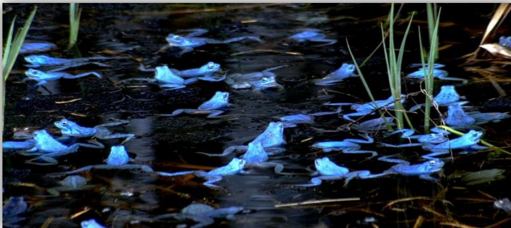
Slika 19. – Rana arvalis – mužjaci za vrijeme parenja

Razdoblje parenja je u rano proljeće i traje kratko. Mužjaci imaju parne vokalne vrećice ispod grla i za vrijeme parenja poprime plavu boju (Sl. 19). Mužjaci ženke privlače glasanjem, te ih hvataju oko prsa prednjim nogama (URL 3).