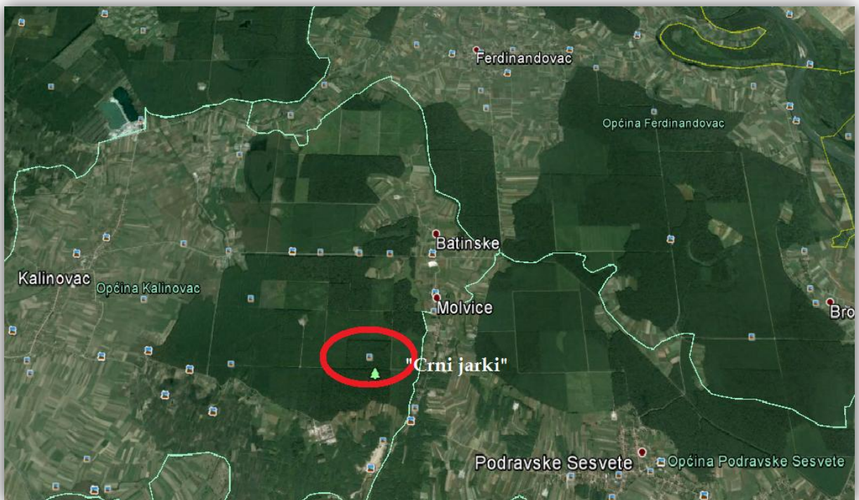
Slika 1. – Položaj Posebnog rezervata šumske vegetacije „Crni jarki“

Rezervat se nalazi na području omeđenom 17^{\circ} 09' 45'' i 17^{\circ} 10' 56'' istočne geografske dužine i 46^{\circ} 00' 05'' i 46^{\circ} 01' 50'' sjeverne geografske širine. Čitavo područje nalazi se na teritoriju općine Kalinovac (Sl. 1).