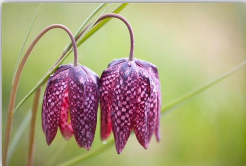
Slika 5 . – Kockavica ( Fritillaria meleagris L.)

U sloju prizemnog raslinja karakteristična je i kockavica. Kockavica ( Fritillaria meleagris L.) je proljetnica purpurnih cvjetova sa svjetlijim i tamnijim šarama koje tvore uzorak šahovnice, po čemu je i dobila svoj hrvatski naziv (Sl. 5). Budući da se nalazi u Crvenoj knjizi kao osjetljiva vrsta (VU), kockavica je strogo zaštićena vrsta. Glavni je uzrok njezine ugroženosti gubitak staništa uslijed negativnog čovjekovog djelovanja (melioracija, urbanizacija, pretvaranje livada u oranice ili građevinsko zemljište) (Boršić, Posavec Vukelić, 2011.).