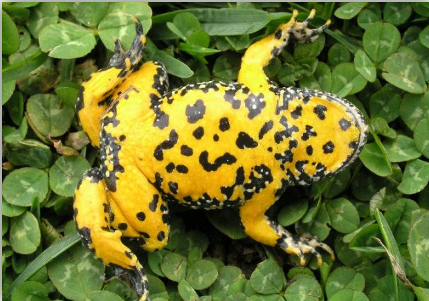
Slika 21. – Bombina variegata – jarko obojen trbuh

Mogu doživjeti 24 godine u zatočeništvu. Ličinke su biljojedne te se hrane algama i vodenim biljem. Mladi i odrasli love često na kopnu puževe, stonoge, kukce i ličinke kukaca, a povremeno se hrane i u vodi, uglavnom račićima, vodenim kolutićavcima, kukcima, ličinkama kukaca. Koža preobraženih mukača luči otrovne tvari koje ih čine nejestivima za mnoge vrste. Suočeni s napadačem, često se uvrću ili preokreću, pokazujući jarko obojen trbuh (Sl. 21), signal da su otrovni (URL 3).