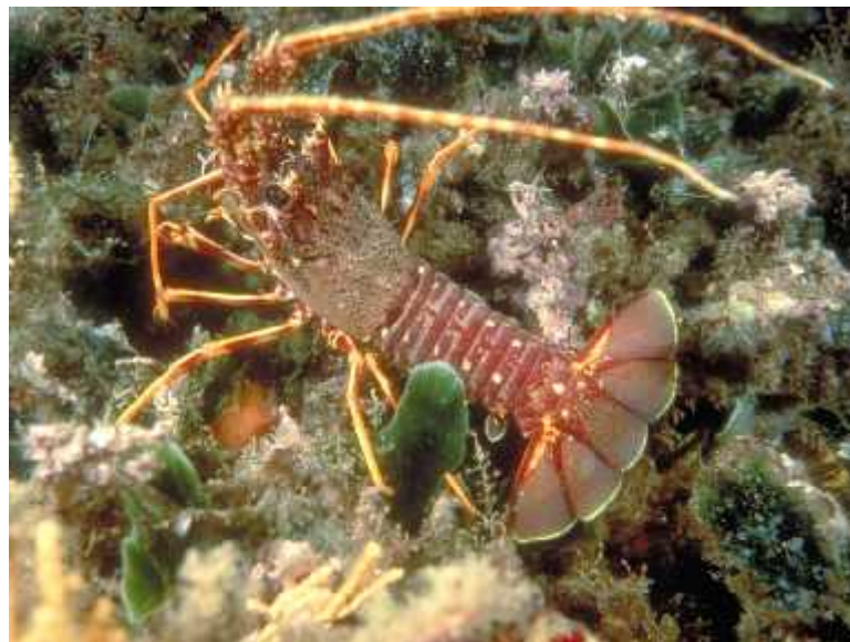
Slika 1. Jastog

brže rastu u toplijim vodama. Jastozi nalikuju hlapovima ( Homarus gammarus ), ali za razliku od njih nemaju kliješta, a stražnja ticala su im vrlo duga ka, duža od tijela. Oklop im je obično s lijeve strane naranaste boje, s tamnijim dugim i vrstnim trnovima usmjerenim prema naprijed, dok im je trbušna strana svijetle (bijele) boje, ali zabilježeni su i crveno-ljubiasti i smeđi primjerci. Hodaju po morskom dnu, ali mogu i plivati (Slika1). Svejedi su, iako se njihova prehrana uglavnom temelji na bodljikašima, mekušcima (puževima i školjkašima), ali inkama kozica, koluti avcima, mahovnjacima i algama. Socijalne (društvene) su životinje (sakupljaju se u skupine), ali njihovi međusobni socijalni kontakti nisu dobro proučeni. Na njima se mogu prikrivati i živjeti neki mnogo vrstni etinaši (cjevaši), školjkaši, mahovnjaci i rakovi lupari. Brojnost populacija jastoga se znatno smanjuje što se vidi u smanjenom ulovu i prosječno manjoj duljini ulovljenih jastoga. Razlozi tomu su mnogobrojni: od prekomjernog izlova do promjene ekoloških uvjeta na njihovim staništima.