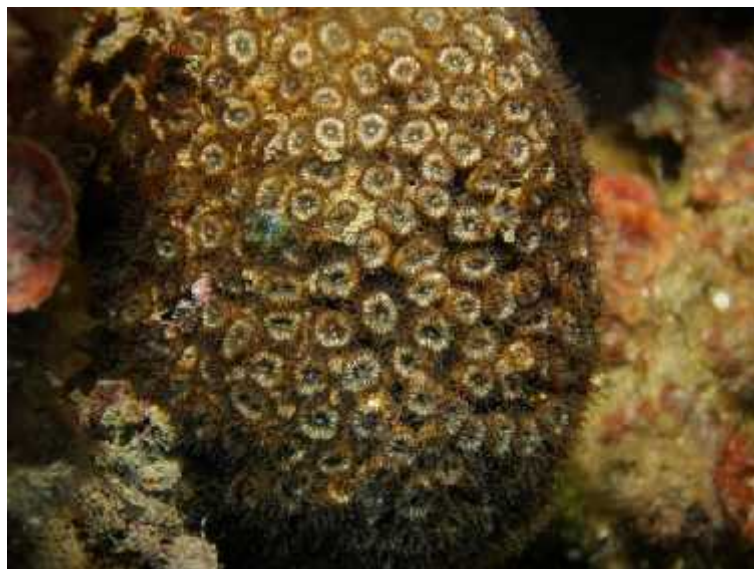
Slika 3. Vrsta Cladocora caespitosa

Kao i većina koralja ova vrsta ugrožena je zbog antropogenog onečišćenja teškim metalima ili prevelikom sedimentacijom koja im smeta. Jedan od novijih problema je i izbjeljivanje polipa zbog gubitka simbiotskih algi zooksantela uslijed globalnog zagrijavanja mora te se tako smanjuje brzina rasta koralja. Alge osim boje koralju daju kisik i fotosintetske proizvode koji mu služe kao hrana te vrše ulogu izlučivanja otpadnih tvari koje su produkt metabolizma koralja. Rizik od izumiranja je za ovu vrstu uvelike povećan neprestanim sakupljanjem zbog suvenira te već spomenutim korištenjem različitih ribarskih alata čime se fizički uništavaju kolonije koralja (Kružić, 2007).