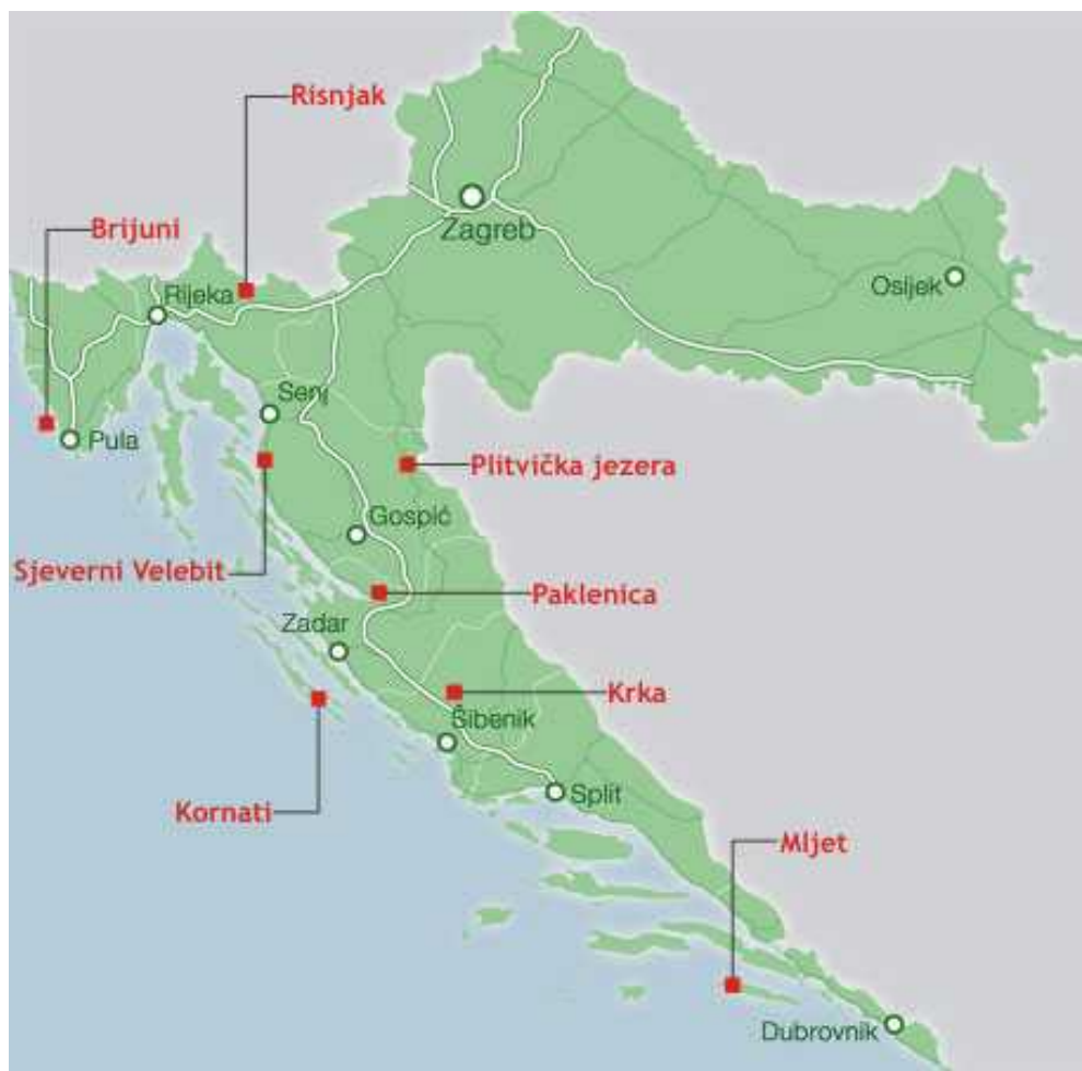
Slika 1. Geografski položaj nacionalnih parkova u Republici Hrvatskoj ( www.camping.hr/hr/hrvatska/nacionalni-parkovi )

NP Sjeverni Velebit najve im je dijelom prekriven šumama, a osim šuma ovdje nalazimo i travnjake, stijene, kamenite vrhove, dok cjelokupno podru je sadrži mnoštvo krških oblika na površini i u podzemlju. Upravo takva raznolikost staništa utje e na raznolikost biljnog i životinjskog svijeta. Unutar Parka nalazi se i strogi rezervat Hajdu ki i Rožanski kukovi, te mnoštvo speleoloških objekata i planinarskih staza (Brali , 2005).