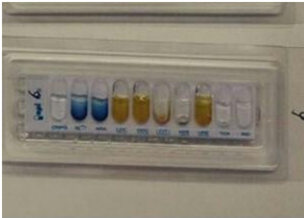
Slika 1. Izgled pozitivnog Api testa za P. aeruginosa .

Za potvrdu sojeva smo koristili test na citokrom oksidazu te komercijalni biokemijski niz API 20E/NF (Slika 1). Citokrom oksidaza testom smo dokazivali proizvodnju enzima citokrom C oksidaze. Taj enzim, ukoliko je prisutan u ispitivanoj bakterijskom kulturi, u prisutnosti atmosferskog kisika katalizira oksidaciju fenilendiamina iz testa do tamnoljubičaste komponente indofenola (Stilinović i Hrenović, 2009). Test se izvodio na način da se malo bakterijske kulture mikrobiološkom ušicom nanijelo na disk natopljen sa dimetil p-fenilen diaminom. Pojava ljubičaste boje se smatrala pozitivnom reakcijom. API komercijalni test sadrži niz supstrata za određivanje biokemijskih reakcija te daje odgovor o kojoj je bakteriji riječ. API test se izvodio prema uputama proizvođača. Uzorkom bakterijske kulture su napunjene jažice sa supstratima te je test inkubiran 24 h na 37 °C, u vlažnom okolišu. Vlažan okoliš je postignut tako što su okolne jažice bile prelivene fiziološkom otopinom. Prema boji reakcija smo očitali rezultate te prema njima, u predviđenom komercijalnom programu (Apiweb, BioMerieux) pronašli o kojoj se bakteriji radi. Za pokus smo odabrali 10 različitih sojeva P. aeruginosa koji su potvrđeni API testom i testom na citokrom oksidazu, a izdvojeni su iz različitih uzoraka vode.