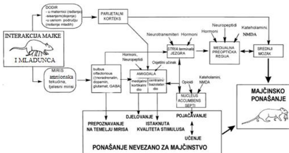
Slika 2. Funkcionalna neuroanatomija i neurokemija u regulaciji majčinskog ponašanja (NMDA = N-metil-D-aspartat)

U slučaju prvog majčinstva jedinice, primjećuje se pojačana ekspresija c-fos u većem broju regija mozga. Neke od ovih regija su dio zajedničkog puta koji vodi ka ekspresiji majčinskog ponašanja, dok drugi utječu na procese učenja, pamćenja, na procesuiranje osjeta itd. Samo neke od ovih regija zaslužne su za zadržavanje majčinskog ponašanja kroz duže vrijeme, a njihova aktivnost je ovisna o iskustvu, tj. nužna je uspostava interakcije između majke i potomka. Regije mozga koje su aktivne kodiskusne majke, ali ne i kod neiskusne majke su parijetalna kora, bazolateralna amigdala i medijalno preoptičko područje (MPOA). U slučaju povrede MPOA-e nastaju manjkavosti i u hormonalnim i u iskustvenim komponentama majčinskog ponašanja, pa je ovo područje vjerojatno zaslužno za prijelaz s hormonske na nehormonsku regulaciju ovog fenomena.