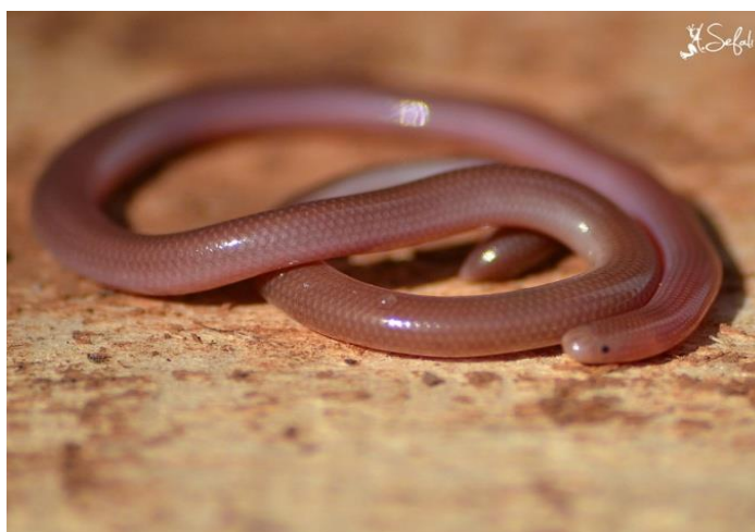
Slika 2. Sljeparica ( Typhlops vermicularis )

U Hrvatskoj postoji podatak o nalazu samo jedne jedinke sljeparice (sl. 2) na Dugom otoku u Parku prirode Telašćica. Jedinku je prikupio dr. Peter Weish tijekom ranog jutra ispod stijene oko 300 m jugozapadno od mjesta Sali u srpnju 1977. godine (Grillitsch i sur. 1999). Unatoč relativno čestim pretraživanjima lokaliteta od strane hrvatskih i inozemnih istraživača, do danas nije zabilježen ni jedan novi nalaz (Jelić 2013). Potrebno je provesti detaljna istraživanja kako bi se utvrdilo je li vrsta stvarno prisutna na tom području (Jelić i sur. 2012b).