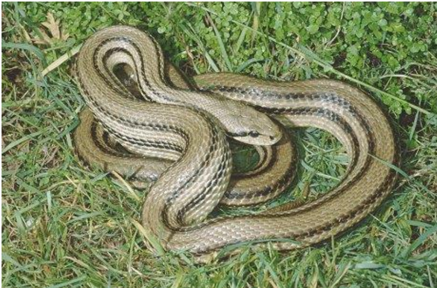
Slika 5. Četveroprugi krivosas ( Elaphe quatuorlineata )

Krivosas (sl. 5) je najduža europska zmija koja može narasti i preko 200 cm (poznati su primjerci i do 240 cm), ali u prosjeku su dugačke oko 150–160 cm. Temeljna boja s gornje strane je smečkasta, s po dvije tamne pruge na leđima sa svake strane tijela (ukupno četiri), po čemu je i dobio naziv. Trbušna strana je svijetla i samo u nekih jedinki posuta tamnim pjegama. Robusnog je i mišićavog izgleda, glava je dobro izražena, a iza očiju ima tamnu prugu. Spolni dimorfizam je vrlo slabo izražen. Mladi imaju drugačiji uzorak šara pa na svijetlosivoj do smečkastoj podlozi imaju tamne mrlje (na leđima i bokovima) te se na prvi pogled mogu zamijeniti s crnokrpicom ( Telescopus fallax ). Promjene u obojenosti započinju oko jedne godine starosti tj. pri 50–60 cm duljine. Tijekom rasta ispoljavaju karakteristike oba izgleda, a s 3–4 godine (oko 120 cm dužine) u potpunosti završe s promjenom obojenosti te nastupa spolna zrelost (Böhme i Ščerbak 1993; Schulz 1996).