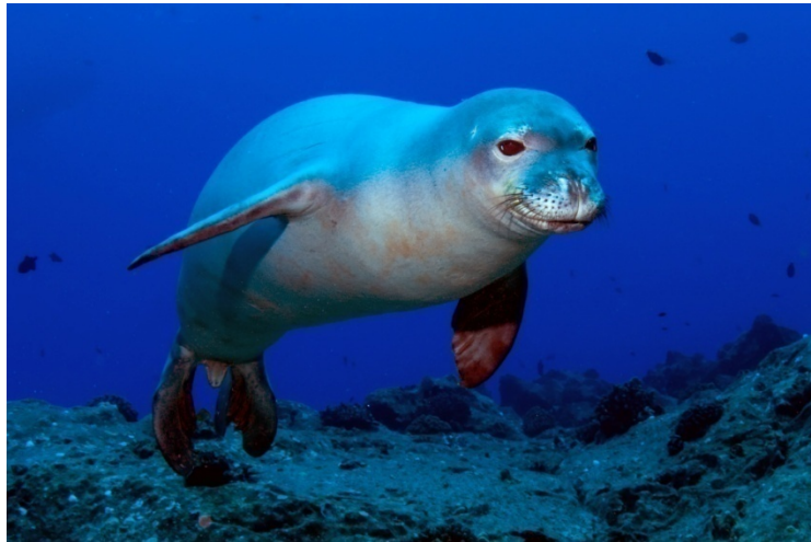
Slika 2. Sredozemna medvjedica ( Monachus monachus )

Sredozemne medvjedice su se odlično prilagodile na život u moru, tijelo im ima oblik torpeda, sa okruglom glavom iz koje izvire samo njuška, dok uške uopće nemaju (Sl. 2). Kada su pod vodom imaju relativno dobar vid i sluh, bolje vide objekte koji se kreću, a slabije one koji su statični, međutim kod lova im najviše pomažu njihove osjetne dlake. Nalaze se oko širokih nozdrva, te sa svake strane imaju pet redova osjetnih dlaka, a u svakom redu imaju pet do osam brkova koji su veoma osjetljivi i pomažu im u detektiranju pokreta riba u vodi, što im znatno olakšava lov. Kao što je već spomenuto, prosječna dužina im je oko 2,4 metra, a težina do 300 kilograma. Sredozemne medvjedice se smatraju najvećom vrstom tuljana te su unutrašnjom građom i anatomijom gotovo identične ostalim tuljanima. Ono što ih čini drugačijim od ostalih tuljana je to da ženke posjeduju 2 para bradavica koje mogu uvući.