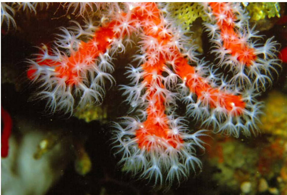
Slika 1. Corallium rubrum

Crveni koralj, koji je po svom sastavu mineral, izgleda kao biljka, no zapravo je životinja, zadivljuje ljude još od davnina. Njegova uporaba počinje još u doba paleolitika, oko 20 000 godina prije Krista. Crteži koralja mogu se naći i na zidovima starih Egipćana, Grka i Rimljana, koji su ga također koristili i za izradu nakita. Po legendi, Grci su smatrali da je koralj nastao od algi koje su se okamenile nakon što su bile prekrivene Meduzinom krvlju. Također se smatralo da crveni koralj štiti od zla, daje zemlji plodnost, čuva brodove te da tjera mržnju iz domova. U antičko doba se koralj is Sredozemnog mora mijenjao za jantar is područja Sjevernog more, a u srednjem vijeku se nosio komadić koralja kao zaštita protiv uroka. Također se koristio u medicinske svrhe.