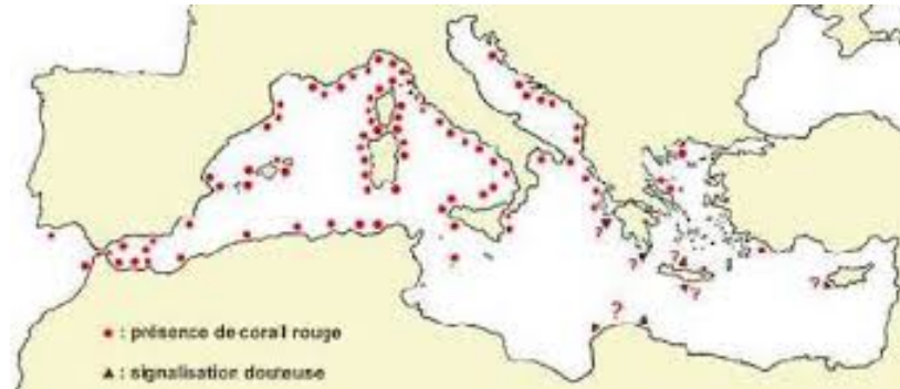
Slika 2.: Rasprostranjenost crvenog koralja u Sredozemnom moru (kružići prikazuju mjesta pojave vrste, a trokutići i upitnici mjesta na kojima se sumnja na njihovu pojavu)

moru crveni koralj nalazimo duž cijele istočne obale od Istre do Albanije, uglavnom na vanjskoj strani Jadranskih otoka.