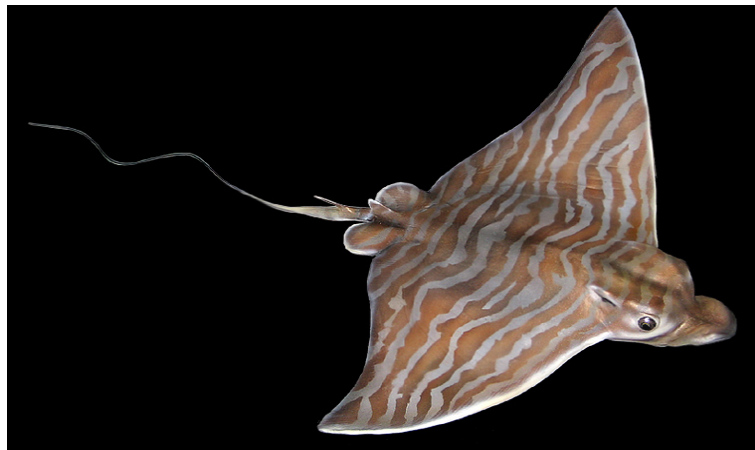
Slika 3. GOLUB ĆUKAN ( Pteromylaeus bovinus )

Golub ćukan (Slika 3.) je izgledom dosta sličan kosiru, ima nešto dužu njušku, ali najviše se razlikuje po tome što ima desetak tamnih poprečnih pruga po leđima koje kod starijih primjeraka gotovo nestaju. Voli nešto veće temperature pa je češći u južnom dijelu Jadrana. Semipelagična je, priobalna vrsta. Naraste preko 2 m u dužinu i do 80 kg. Tijelo mu je spljošteno kao i kod svih goluba, s izduljenim bočnim perajama, kao krilima koje završavaju oštro. Ima izduljenu njušku, ravnu, koja podsjeća na pačji kljun, u ustima ima 7 redova ravnih zuba. Svijetlo smeđe je boje. Rep je vrlo dug i završava poput dugačkog biča. Bodlja je velika i dobro razvijena i nalazi se uz sam početak repa. Ponekad se nađu primjerci s dvije ili više bodlji u repu. Bodlja je izgrađena od tvrdog, kosti sličnog materijala (vazodentin). Duž bodlje postoji duboki žlijeb u kojem se nalazi otrovno žljezdano tkivo. Otrov se stvara i u ovojnici bodlje, a također i u koži repa uz bazu bodlje. (Wölfl, 1994)