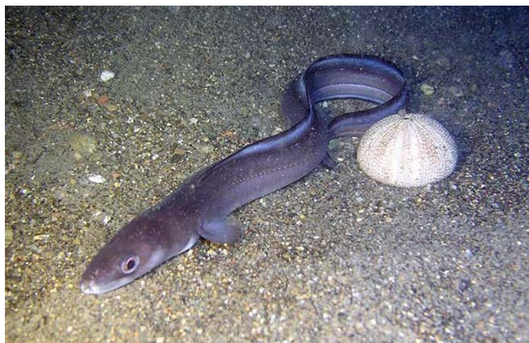
Slika 20. UGOR ( Conger conger )