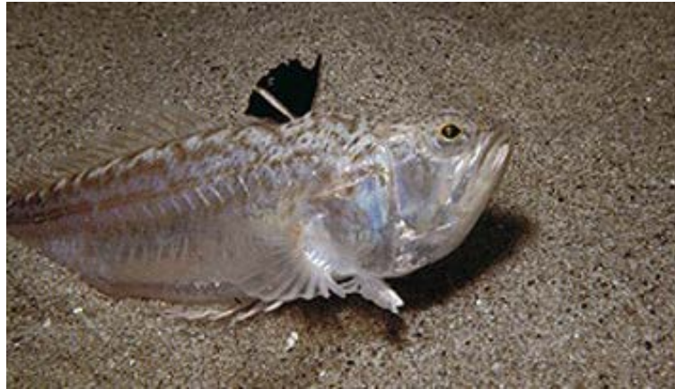
Slika 8. PAUK ŽUTAC ( Trachinus vipera )

sustav te oštećivanja crvenih krvnih zrnaca. Kod nekih ljudi otrov paukova ne djeluje, dok su neki razvili imunitet višestrukim ubadanjem (Wölfl, 1994).