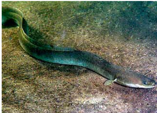
Slika 19. JEGULJA ( Anguilla anguilla )

na dubine 6-7 tisuća m gdje se mrijeste i ugibaju (Jardas, 1996). Mlade jegulje koje se Golfskom strujom vraćaju prema Europi bočno su spljoštene i posve prozirne. Putem se razvijaju u male prozirne zmijice, te su dugo smatrane posebnom vrstom riba zvanim "staklenke". Nakon 1-3 godine putovanja stižu natrag u Jadransko more, te pronalaze pogodne pritoke u kojima će živjeti i razvijati se. Najpogodnije područje u nas je delta Neretve, gdje je jegulja i najpoznatija i vrlo cijenjena riba. Na koji god način je pripremali, mora proći termalnu obradu na visokoj temperaturi jer njena svježa krv otrovna i sadrži ihtiokemotoksine (kao i murina i ugor) koji mogu izazvati trovanje u ljudi.