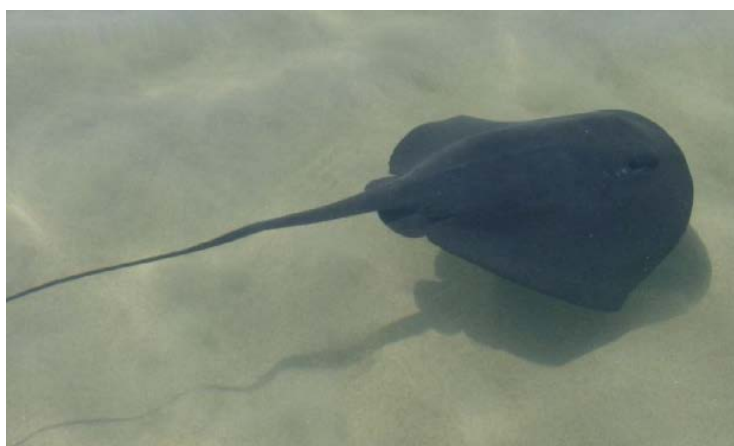
Slika 6. LJUBIČASTA ŽUTUGA ( Dasyatis violecea )

Ljubičasta žutuga (Slika 6.) živi najdublje i dosta je rijetka u Jadranu. Kozmopolit je u tropskim i suptropskim morima, a najbrojnija je na obalama Indonezije. U Mediteranu je difuzno rasprostranjena. Pelagička je i sedentarna vrsta, živi do 250 m dubine. Odozgo je tamnoljubičasta, kako i samo ime kaže, a odozdo svjetlija sa smeđim obodom prsnih peraja. Hrani se manjom ribom i beskralješnjacima, uključujući i meduze. Rep je dugačak i bičast s jednom ili dvije harpunasto nazubljene bodlje te kratkim i uskim kožnim naborom odozgo. Bodlje na repu treba se čuvati jer je otrovna (Jadras, 1996).