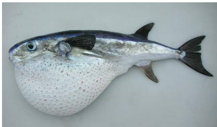
Slika 21. SREBRNOPRUGA NAPUHAČA ( Sphoeroides pachygaster )