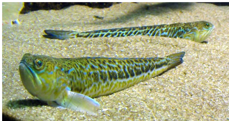
Slika 9. PAUK BIJELAC ( Trachinus draco )

Pauk bijelac (Slika 9.) najzastupljeniji je od svih paukova. Živi na pjeskovitim i muljevitim dnima. Prosječna mu je duljina oko 25 cm. Žućkastosive ili bijelosive je boje, s crnim ili smeđim prugama na bokovima. Meso mu je vrlo cijenjeno, a u Danskoj se razvio i poseban ribolov na ovog pauka, čiji godišnji ulov doseže i 1000 tona. Ovog pauka se još naziva i ranj, pjeskuljar, bilac i pržinar. Od svih uboda paukovki kod nas, najviše ih prouzroči ova vrsta. Otrovnii aparat se sastoji od bodlji u prvoj leđnoj peraji, i kratkih, jakih bodlji na škržnom poklopcu. Bodlje su u tankoj kožnoj ovojnici iz koje viri oštri vrh. Na bodlji je uzdužna brazda u kojoj se blizu vrha nalazi spužvasto žljezdano tkivo. Slično zmijskim otrovima, otrov pauka djeluje neurotoksično i kemotoksično (Wölfl, 1994).