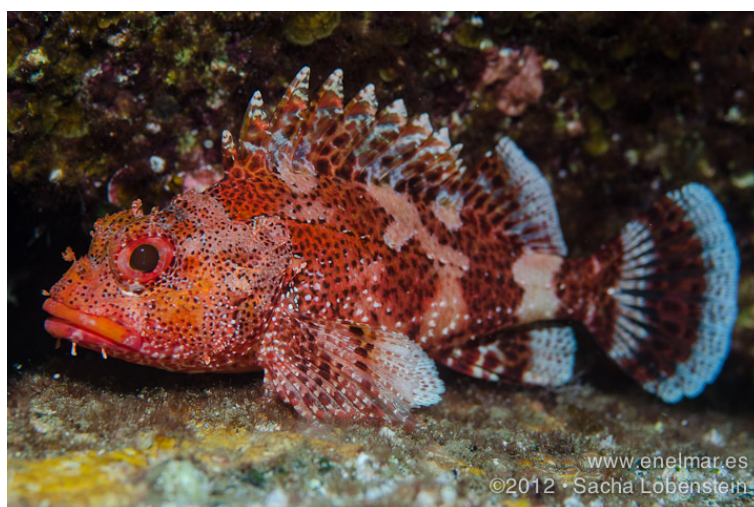
Slika 16. BODEČNJAK ( Scorpaena maderensis )

Kod nas se još naziva i mali bodečnjak (Slika 16.). Ovo je mala riba, težine do 150 g, najveći primjerak uhvaćen je imao 14 cm. Boja mu je crvenkastosmeđa s nekoliko tamnijih pojasa po tijelu, ovisno o bojama i obliku dna okoline. Živi na kamenitom terenu, na dubinama 20-40 m, gdje je vrstan grabežljivac koji se hrani manjim životinjicama i ribama. Kao i većina riba iz svoje porodice i ova riba ima otrovan ubod, vrlo bolan. Kod nas je najčešći na južnom Jadranu. Iako je jestiva, zbog svoje veličine i velikog broja sitnih drača, nema značajniju ulogu u prehrani ( www.hr.wikipedia.org ).