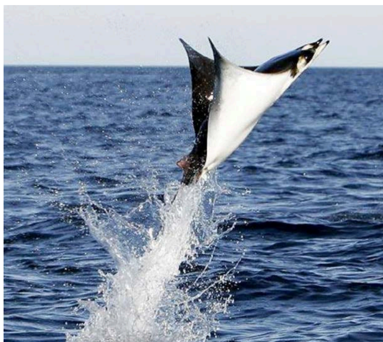
Slika 1. GOLUB UHAN ( Mobula mobular ) ( www.filmatidimare.altervista.org )