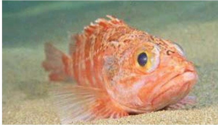
Slika 17. BODEČNJAK VELIKI ( Helicolenus dactylopterus dactylopterus )