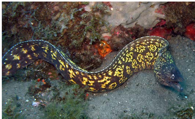
Slika 18. MURINA ŽUTOŠARKA ( Muraena helena )

murine češća je na južnom dijelu naše obale, pa je tako i najbrojnija u Dubrovačko-Neretvanskoj županiji. Danju se radije zadržavaju u procjepima i rupama, a noću izlaze i love plijen. Solitarna je vrsta. Spada među najopakije lovce u moru. Često napada hobotnice veće od sebe odgrizajući im krakove, vrteći se pri tom kao svrdlo. Po danu je vrlo radoznala i voli promatrati okolinu (Ugarković, 2006). Ima u krvi ihtiokemotoksine kao jegulja i ugor. Kada se izolirani toksin ubrizga rakovici Eriphia spinifrons , ona ugiba za 30 sekundi. Kod ljudi koji su se otrovali ingestijom sirove krvi javlja se mučnina, povraćanje, pojačana salivacija, i opća slabost. U teškim slučajevima javlja se parestezija oko ustiju, respiratorne smetnje, paraliza i smrt. Ugriz murine je vrlo bolan i te rane teško zarastaju (Wölfl, 1994). Murina je agresivna i grize kada se uhvati udicom ili podvodnom puškom. Neki smatraju da je to naša najagresivnija riba.