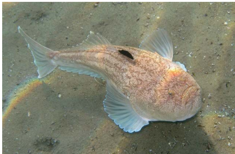
Slika 12. BEŽMEK ( Uranoscopus scaber )

U porodicu paukovki pripada još i bežmek (Slika 12.). Naziva se batovina, čaća, batoglav ili pušac. I on živi na pješčanim dnima, a na škržnim poklopcima ima zavinute bodlje. Međutim, još se uvijek ne može tvrditi da je bežmek otrovan. Neki ljudi navode da su nakon bežmekova uboda osjećali trnce oko rane, laganu bol, a pojavilo se i crvenilo. Drugi tvrde da i nakon jačih uboda nisu, osim mehaničkog oštećenja, osjećali neke posebne simptome. Ako bežmek i jest otrovan, otrov mu je puno slabiji nego otrov ostalih paukovki. Glava mu je velika, kvadratna, odozgo spljoštena, u odnosu na ostatak tijela te prekrivena hrapavim koštanim pločama. Usta su mu okrenuta prema gore. Boje je smedesive, lagano ispjegane, trbuh bijel. Bentoska je vrsta, živi uz samu obalu pa sve do 200 m dubine