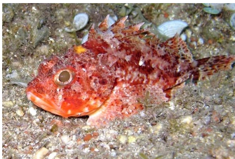
Slika 15. ŠKARPINICA ( Scorpaena notata )

Kod nas se još naziva i bodeč crveni, bodečić crveni, škrpinica. Škarpinica (Slika 15.) je mala riba, težine do 200 g, najveći primjerak uhvaćen je imao 24 cm. Jako slični svojoj većoj rođakinji škarpini. Živi na kamenitom terenu, na dubinama, od 5 do 700 m, gdje je vrstan grabežljivac koji se hrani manjim životinjicama i ribama. Kao i većina riba iz svoje porodice i ova riba ima otrovan ubod, vrlo bolan, a kod osjetljivijih ljudi može uzrokovati i probleme ( www.hr.wikipedia.org ).