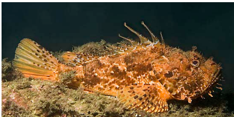
Slika 14. ŠKARPUN ( Scorpaena porcus )