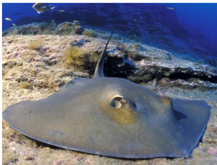
Slika 5. ŽUTUGA ( Dasyatis pastinaca )