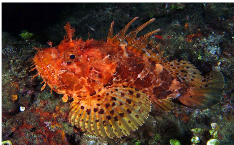
Slika 13. ŠKARPINA ( Scorpaena scrofa )