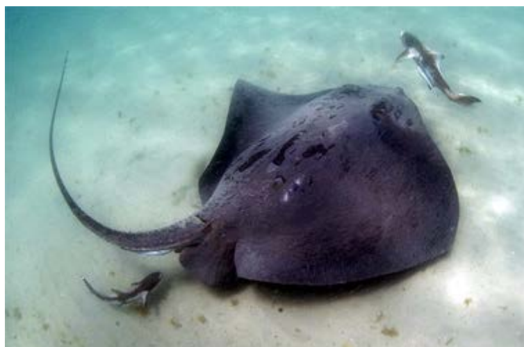
Slika 4. ŽUTUGA DRAČOREPA ( Dasyatis centroura ) ( www.flmnh.ufl.edu )

Najveća vrsta porodice žutuga je žutuga dračorepa (Slika 4.) ili šiba dugorepka. To je atlantska vrsta koja je u Jadranu dosta rijetka. Može se naći u srednjem i južnom dijelu Jadrana, najčešće na 10-250 m dubine. Ukupna težina može iznositi i do 300 kg što je uvrštava u najveće ražolike ribe u Jadranu, a može narasti i do 4 m. Kod nas nije toliko popularna jer se rijetko lovi i jede. Češće se pojavljuje u toplijim mjesecima bliže obalama. Tamno smeđe i maslinaste je boje. Ima dosta duži rep od ostalih vrsta koji joj bude dug do 2,5 m, rep joj je ukrašen i velikim brojem sitnih bezopasnih bodlji te jednom velikom otrovnom bodljom. Bodlja je dobro razvijena, nazubljena i nalazi se dalje od tijela ribe, tako da njome može zamahnuti. Ima kožnu ovojnica a otrovne žlijezde se nalaze u žlijebu bodlje. Rane zadane bodljom su najčešće razderotine ili ubodne. Glavni simptom je bol. Može se javiti i pad krvnog tlaka, povraćanje, proljev, znojenje, tahikardija i paraliza skeletne muskulature (Wölfl, 1994).