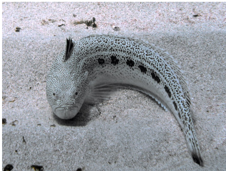
Slika 10. PAUK CRNAC ( Trachinus araneus )

Pauk crnac (Slika 10.) je najrjeđi pauk koji obitava u Jadranu. Najveći je od svih, naraste do 50 cm dužine i 1,80 kg težine, no mogu biti i veći. Razlog rijetkosti je i taj što rjeđe obitava pliće kao ostale vrste, a drži se otvorenog mora, brakova i pučinske strane otoka, do 100 m dubine. Po izgledu je dosta sličan mrkulju, a razlika je u 6-7 većih crnih mrlja raspoređenih vodoravno po bočnoj liniji (Ugarković, 2006). Otrovní aparat se sastoji od bodlji u prvoj leđnoj peraji, i kratkih, jakih bodlji na škržnom poklopcu. Bodlje su u tankoj kožnoj ovojnici iz koje viri oštri vrh (Wölfl, 1994).