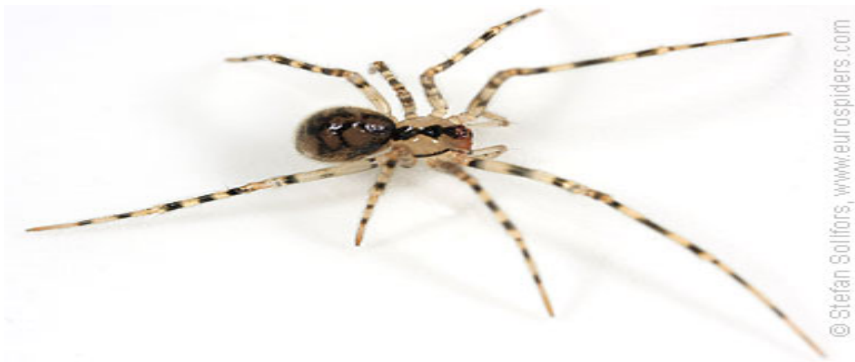
Slika 2.: Nesticus cellulanus Clerck, 1757 . Predstavnik roda Nesticus .

vrsta sa podvrstama (Slika 1.). U Europi je Nesticus predstavljen sa preko 23 vrste od čega su četiri predstavljene kao endemične na Pirinejskom poluotoku. Vrsta iz spomenutog roda koja se opisuje u ovom radu je Nesticus baeticus sp. n. Ona nastanjuje kršne krajeve planina Cazorla I Segura te nacionalni park Las Villas gdje je pronađena u 8 špilja. Područje je vapnenačkog podrijetla, bujno i vlažno sa nekolicinom horizontalnih i vertikalnih špilja srednje veličine. Primjerci te vrste koji su korišteni kao uzorci za ovaj rad su bili generalno locirani nekoliko metara unutar zone mraka ili prema dubljoj unutrašnjosti špilje te su se intenzivno uzorkovali.