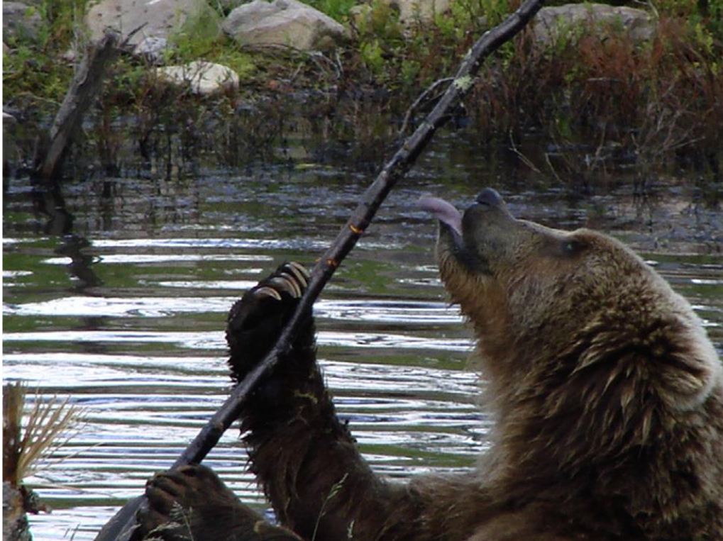
Slika 2: Smeđi medvjed ( Ursus arctos ), Švedska (Stenvinkel i Johnson, 2013.).

Ursidae nalazimo američkog crnog medvjeda ( Ursus americanos ), smeđeg medvjeda ( Ursus arctos ) i grizlija ( Ursus arctos horribilis ).