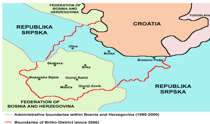
Slika 4. Položaj distrikta u odnosu na entitete i susjedne države

Bosna je oduvijek bila raskrižje kultura i mjesto sukobljavanja susjednih središta moći. Upravo zbog svog položaja uvijek je imala nestabilnu državnu organizaciju, bez obzira u čijem sastavu je bila. Značajka Bosne je položaj uz smjerove velikih prodora: bila je klin turskog prodora u Europu i zemlja prve linije austrougarskog prodora na istok. U Jugoslaviji dobiva drugačiji položaj, postaje jezgra ali samo u prostornom i geostrateškom smislu, ne i u političkom. Gravitacijski Bosna je sa sjevera, zapada i juga upućena na Hrvatsku prema kojoj se široko otvara iz svoje gorske jezgre. Takva veza sa istočne strane, tj. sa Srbijom ne postoji zbog rijeke Drine koja predstavlja prepreku (Klemenčić, 1997).