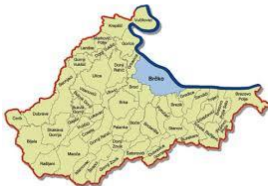
Slika 5. Položaj okolnih naselja Brčkog