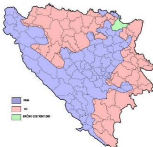
Slika 1. Geografski položaj Brčko distrikta