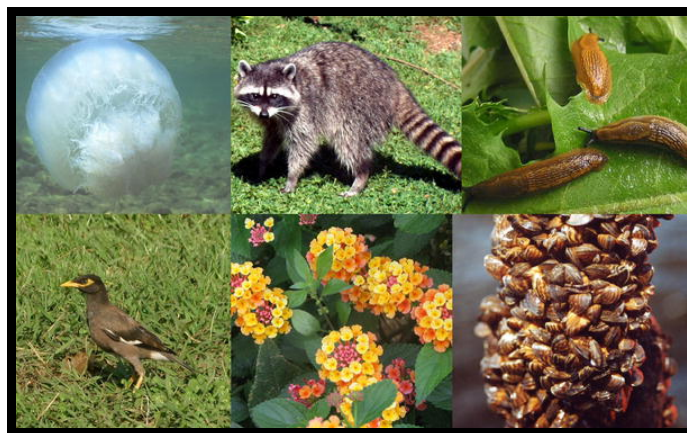
Slika 1. Biološka raznolikost

Sam Zg ZOO sudjeluje u Europskom programu zaštite za uzgoj ugroženih vrsta životinja među kojima se nalaze i pet zvijeri o kojima ću ja pisati u svom završnom seminarskom radu. To su: afrički gepard ( Acinonyx jubatus jubatus ), grivasti vuk ( Chrysocyon brachyurus ), crveni panda ( Ailurus fulgens ), snježni leopard ( Uncia uncia ), te kineski leopard ( Panthera pardus japonensis ).