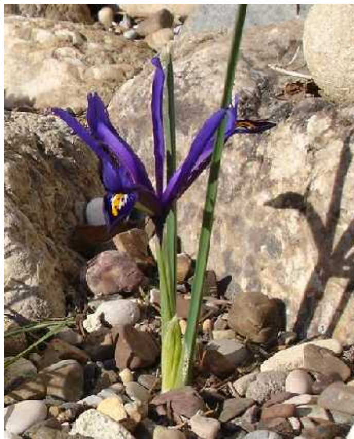
Slika 12. Iris reticulata Bieb. (fotografirao Marko Doboš)

Iris reticulata Bieb. (sl. 12) najbolje je poznata vrsta iz ovoga malog podroda. Krajem zime cvjeta cvjetovima koji mogu biti obojeni plavo ili ljubi asto. Postoje mnogi prirodni, ali i umjetni varijeteti. Biljke sa cvijetom su visoke od 7 do 14 cm, a staništa su im od Turske, Irana, Iraka, bivšeg SSSR-a, gorje Kavkaz i Transkavkaška regija. (Köhlein 1981., http://www.pacificbulbsociety.org/pbswiki/index.php/ReticulataIris )