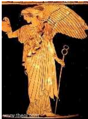
Slika 1. Božica Irida

Naziv Iris dolazi od grčke božice duge te glasnice bogova Iride (sl. 1). Starogrčke legende pišu da je božica Irida ljudima prenosila poruke bogova pomoću duge. Vjerovalo se da bi tamo gdje bi duga dotaknula zemlju, izrastao cvijet iris. Legende se zasnivaju na činjenici da irise možemo naći u raznim bojama, a svaka vrsta ima velike cvjetove koji privlače oko i pozornost.