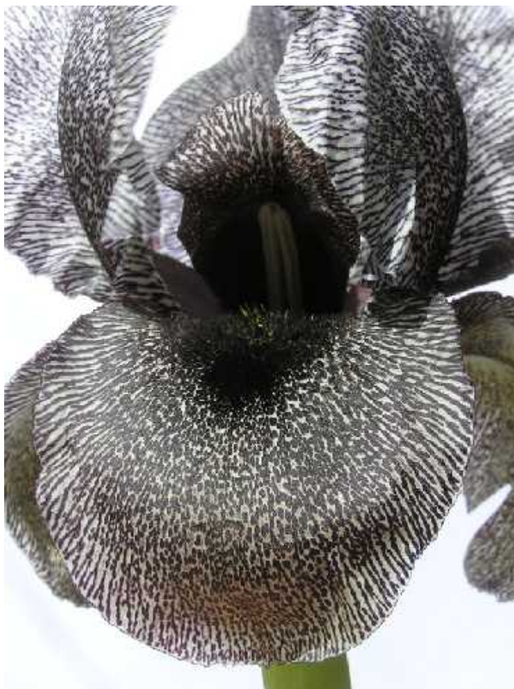
Slika 7. Iris susiana L., izgled cvijeta ( http://www.badbear.com/newsigna/index.pl?Iris-susiana )

Iris susiana L. (sl. 7) jedan je od najduže kultiviranih i najcjenjenijih irisa. Njegova ljepota toliko je fascinirala ljude da su ga zbog sakupljanja vjerojatno iskorijenili u prirodnim staništima. Tipičan je predstavnik Oncocyclus sekcije. Cvjetovi su sivkasi i prošarani tamno sivim do crnim "žilama" i to kicama. Vanjski listi i perigona nose karakterističnu crnu točku. Biljka je nekad naseljavala područja Turske i Libanona. (Köhlein 1981., Schulze 1988., http://www.pacificbulbsociety.org/pbswiki/index.php/ArilIris )