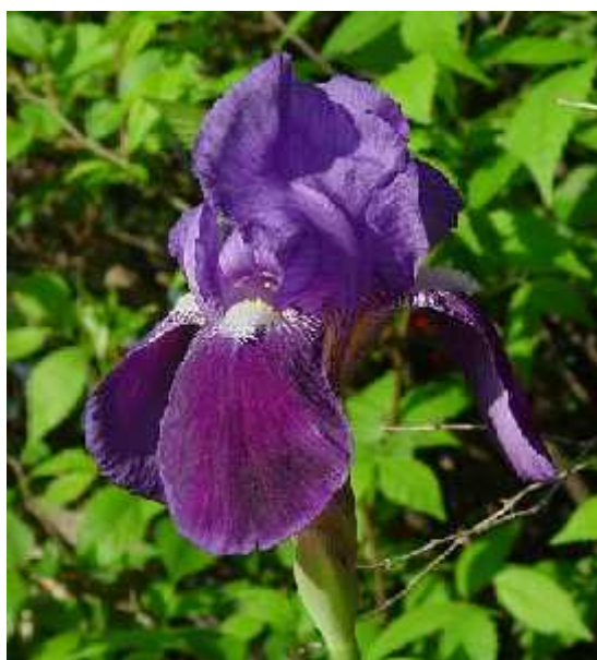
Slika 5. Iris germanica L, cvijet

Iris germanica L. (sl. 5) roditeljska je vrsta brojnim kultivarima bradatih perunika koje možemo pronaći u gotovo svakom vrtu. Smatra se da potječe iz Sredozemnog dijela Južne Europe, a udomaćio se u vrtovima i pobjegao u prirodna staništa diljem Sjeverne hemisfere. U prirodi postoji nekoliko varijeteta s raznim bojama cvjetova, a u hortikulturi kombinacije boja su bezbrojne. (Köhlein 1981., Schulze 1988., http://www.missouriplants.com/Bluealt/Iris_germanica_page.html )