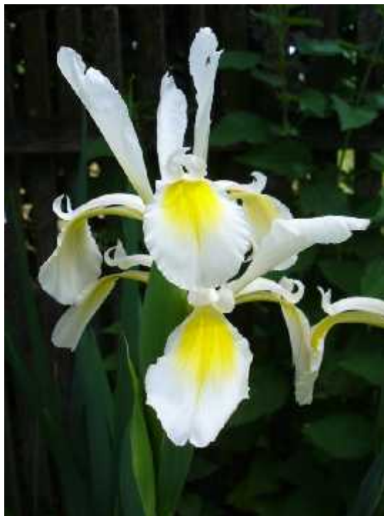
Slika 8. Iris orientalis Mill, izgled cvijeta

Iris orientalis Mill (sl. 8) jest je iris u kulturi. Cvjetovi su mu bijeli sa žutim oznakama ili potpuno žuti bez brade. Listovi prije cvjetanja su uspravni i visoki do 1 m, a cvjetne stapke sa cvjetovima nadvisuju listove. Prirodno stanište biljke je od Grčke, Turske, Male Azije do Sirije. (Köhlein 1981. http://en.wikipedia.org/wiki/Iris_(plant) , http://hr.wikipedia.org/wiki/Perunika , http://rsabg.org/iris/content/view/13/26/ , http://rsabg.org/iris/content/view/77/26/ )