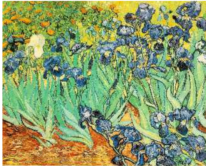
Slika 2. Vincent van Gogh: Iri (1889)

svoje pala e dao oslikati perunikama. Egipatska, ali i indijska kultura koristile su ove cvjetove za prikaz života i ponovnog ro enja. Razne kulture su se kroz povijest koristile ovim cvijetom kao simbolom neke vrste uzvišenosti kao što su pobjeda, vjera, nada, mudrost ili hrabrost, stoga ne udi da ga tako esto pronalzimo u heraldici. Inspiracija su nebrojenim umjetnicima nekada i danas, a možda najpoznatije ovjekovje ene perunike na platnu su one Vincenta van Gogha (sl. 2)