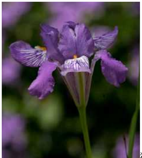
Slika 10. Iris collettii Hooker, cvijet

Iris collettii Hooker (sl. 10) minijaturan je iris koji potječe sa Himalaja, Kine, Burme i Tajlanda. Raste na sunanim suhim travnjacima na visinama od 1650 do 3500 metara nadmorske visine. Ima jako kratak rizom, te jako zadebljalo korijenje (gomolje). Listovi su dugi desetak centimetara u vrijeme cvatnje, a poslije se izdužuju do oko trideset centimetara. Cvjetovi su ljubičaste boje i nose bradu. (Köhlein 1981., http://www.bulbsociety.org/GALLERY_OF_THE_WORLDS_BULBS/GRAPHICS/Iris/Iris_collettii/Iris_collettii.html )