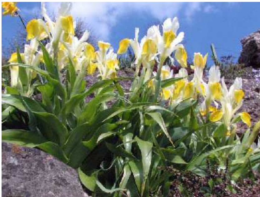
Slika 11. Iris bucharica Foster ( http://www.svz-si.eu/f/pics/V_Rebru/Iris_bucharica_b.jpg )

Iris bucharica Foster (sl. 11) naj eš e je kultivirani pripadnik podroda. Cvjeta bijelo-žutim cvjetovima, a listovi su široki i kao kod ve ine Juno irisa raspore eni tako da podsjeaju na mali kompaktni kukuruz. Potje e iz sjeveroisto nog Afganistana, Tadžikistana i Uzbekistana gdje raste na kamenitim i travnatim obroncima na velikim visinama. ((Köhlein 1981., http://www.pacificbulbsociety.org/pbswiki/index.php/JunoIris )