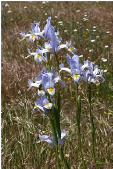
Slika 9. Iris xiphium L.

(Köhlein 1981., http://www.pacificbulbsociety.org/pbswiki/index.php/SpanishIrises , http://en.wikipedia.org/wiki/Iris_xiphium )