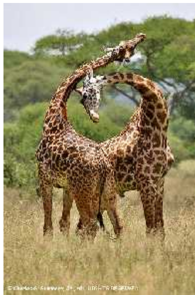
Slika 5. Borba žirafa

zna da je dugi vrat posljedica i spolne, a ne samo prirodne selekcije. Naime, žirafe se rijetko kad hrane s drve a, a kada se i hrane, hrane je mnogo i nema kompeticije. Ono za što im prvenstveno služi vrat je borba (slika 5). U svome radu, gore navedeni znanstvenici, pružili su mnoge dokaze koji potvrđuju da je uistinu riječ o spolnoj selekciji: mužjaci imaju 3,5 puta težu lubanju i 30 – 40 cm duži vrat (da je riječ o prirodnoj selekciji i karakteristikici od koje bi korist imala oba spola, razlika bi bila manja), a tijekom evolucije žirafama su se više produžili vratovi nego noge (da je cilj bio postići i visinu, vjerojatno bi bio razmjerni rast). Mužjaci žirafe koriste vrat i glavu za borbu, borbu za ženu i borbu za teritorij, a ženke takve mužjake prije prihvaćaju kao svoje partnere (Pratt, Anderson 1985), iako takvi mužjaci imaju veći mortalitet i lakši su ulov predatorima.