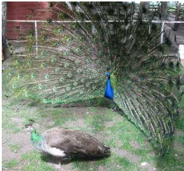
Slika 2. Paun kao primjer spolnog dimorfizma

Morfološke razlike između mužjaka i ženki iste vrste nazivaju se spolni dimorfizam. Prve takve razlike primijetio je još Darwin na svojim slavnim putovanjima. On je tada uočio kako samo paunovi mužjaci imaju veliki šareni rep koji koriste za zavođenje ženke (slika 2). Također je primijetio da mnogi mužjaci imaju na tijelu ukrase koje ponosno pokazuju ženkama, i oružja koja koriste u borbi s drugim mužjacima, što ženke nikada nisu imale. Kasnije je zaključio da su se ukrasi i oružja pojavili kao posljedica spolne selekcije.