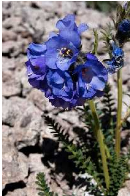
Slika 9. Polemonium viscosum

Darwin je smatrao da se spolna selekcija ne može odnositi na niže životinje i hermafrodite jer oni imaju primitivan živani sustav i preslabe mentalne sposobnosti da bi cijenili tu u ljepotu i druge karakteristike. Zbog toga ni ne udi da u svojim radovima nikada nije spominjao biljke kao organizme na koje bi ta vrsta selekcije mogla djelovati. Još do prije 10 godina, znanstvenici su se slagali s tim stavom prvenstveno zbog mišljenja da je osnovna posljedica spolne selekcije razvoj sekundarnih spolnih karakteristika, koje biljke nemaju. No, krajem 20. stoljeća, javljaju se i prvi znanstvenici sa suprotnim mišljenjem. Jedan od njih je i Arnold, koji 1994. godine ustvrđuje kako je spolna selekcija vrsta selekcije koja proizlazi iz razlika u reproduktivnom uspjehu, a kako kod biljaka postoji borba za oprašivanjem i oplodnjom druge biljke, iako ona nije izravna kao što je to kod životinja, moguće ju je primijeniti i na biljke. Vrsta spolne selekcije koja djeluje na biljke naziva se interakcijski – neovisna spolna selekcija (Murphy 1998).