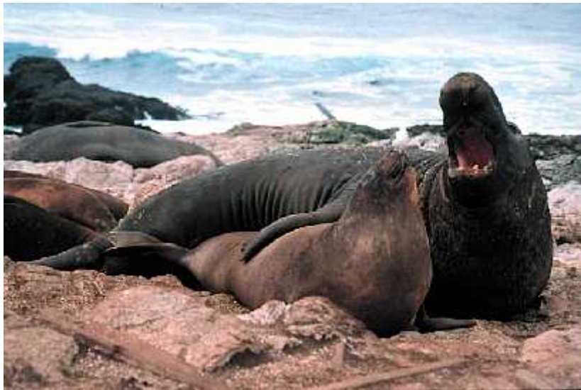
Slika 3. Mužjak i ženka sjevernog morskog lava

Oružja su karakteristike koje su se razvile zbog borbi koje se vode između pripadnika istoga spola (prvenstveno muškog). Najpoznatiji primjer takve karakteristike su rogovi koje imaju mnogi mužjaci, i koji im služe isključivo u te svrhe. Druge karakteristike razvile su se pak radi osvajanja ženki. Takve karakteristike nazivaju se atributi ili nekada ornamenti. Primjer za to su već spomenuti paunov rep, lijepa obojenja ili privlačan pjev kod ptica. Osim ovih razlika, spolni se dimorfizam najčešće poistovjeđuje s jednom, vjerojatno najopitijom karakteristikom, a to je veličina. Kod mnogih skupina mužjaci su snažniji i veći od ženke, samo je kod nekih skupina (kod većine kukaca i paukova) situacija obratna. Drastičan primjer razlike u veličini predstavlja vrsta Mirounga angustirostris (sjeverni morski lav), gdje je mužjak ponekad i pet puta teži od ženke (slika 3).