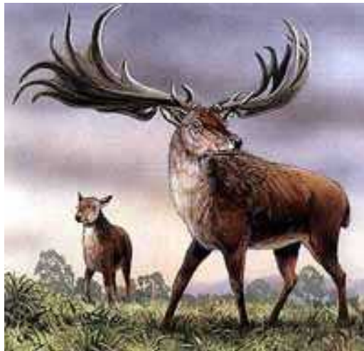
Slika 4. Davno izumrla vrsta – Megaloceros giganteus

esto pitanje koje su si postavljali znanstvenici koji su se bavili razlikama između spolova bilo je – kako su nastale te razlike, ako se prirodnom selekcijom uvaju samo ona obilježja koja vrsti omogu avaju opstanak i koja su za nju najbolja (i za mužjake i za ženke)? I, zašto mužjaci esto imaju nepotrebne i ponekad „skupe“ dodatke koji im, ne samo da ne pomažu, nego i odmažu u opstanku? Jedan od najboljih primjera za to koliko skupi mogu biti takvi dodaci nastali spolnom selekcijom je vrsta Megaloceros giganteus (slika 4), vrsta koja je izumrla prije 10000 tisu a godina (Cohen i sur.1999). Danas se zna da je jedan od najvjerojatnijih razloga njihovog izumiranja bilo njihovo rogovlje koje je bilo preveliko i preteško ak i za najsnažnije mužjake. Što iz razloga što nisu mogli podizati glavu za hranjenje s viših stabala, što zbog usporenosti i ve o j izloženosti predatorima, ove životinje su izumrle zbog svojih atributa i oružja koje im se razvilo spolnom selekcijom.