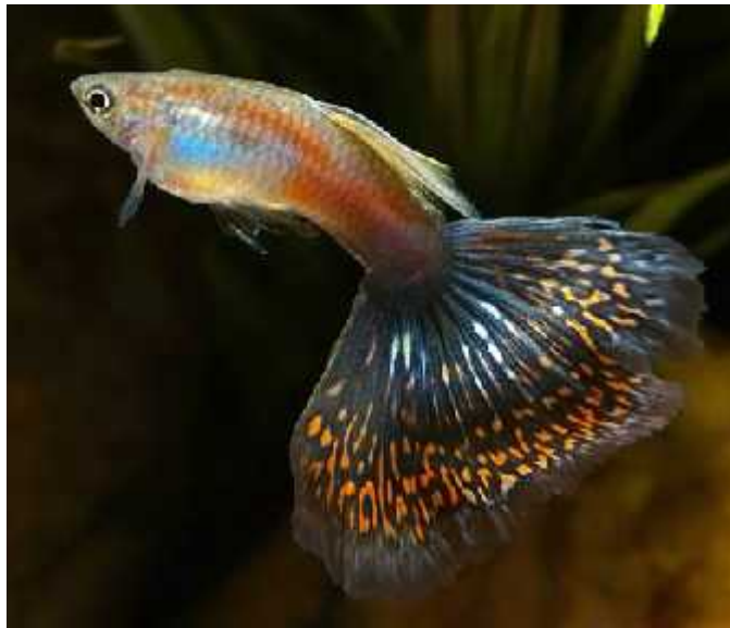
Slika 7. Mužjak Poecilia reticulata

Ova vrsta selekcije naziva se još i „female choice“, a odnosi se na odabir partnera od strane „ograničavajućeg spola“, koji je u velikoj većini ženski spol. Kao posljedica interspolne selekcije mužjaci razvijaju različite ukrase, attribute ili ornamente. Ženke su puno izbirljivije u odabiru partnera za parenje i, kao što je još i Darwin primijetio, često izgledaju nezainteresirano i teško osvojivo. Mužjaci su iz toga razloga razvili razne karakteristike kojima pokušavaju osvojiti i zadiviti ženke. Te karakteristike su: ljepota, snaga, sigurnost koju mogu pružiti, izvor hrane koji mogu osigurati, ratobornost prema drugim mužjacima, plodnost itd.