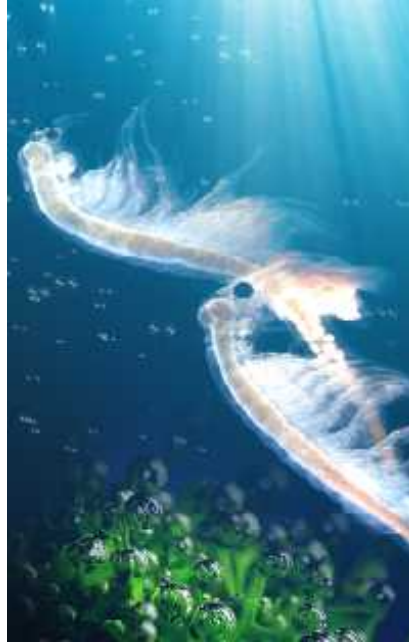
Slika 8. Artemia franciscana za vrijeme parenja