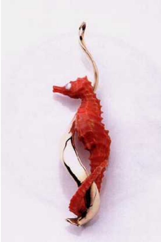
Slika 8.: Ukras od crvenog koralja