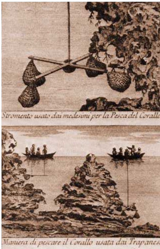
Slika 5.: Inženj ( http://www.archeogate.it/subacquea/article.php?id=122 )