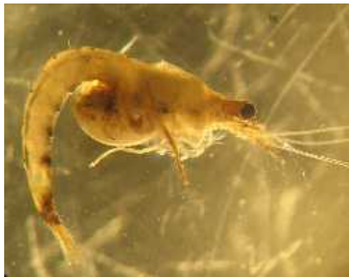
Slika 4. Vrsta Lymnomyxis benedeni (Semenchenko et al., 2007)

Za razliku od mnogih, ova je vrsta namjerno unesena u zapadne slatkovodne sustave. Sredinom 20. st. donesena je u Dnjepr te u jezero Balaton kao hrana za riblju mlađ. Kasnije se proširila i u Dunav te dalje u europske rijeke, uključujući i Dravu.