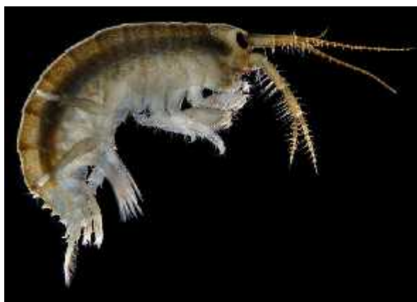
Slika 2. Vrsta Dikerogammarus villosus

Vrsta Dikerogammarus villosus je invazivni rak iz reda Amphipoda (Müller et al., 2002). Proširio se južnim koridorom u Dunav gdje je zabilježen od 1992. godine (sl. 2). U rijeci Dravi, kao dominantna vrsta u bentosu, najuzvodnije je pronađen 175 km uzvodno od ušća u Dunav (Žganec i sur., 2009).