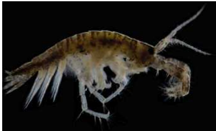
Slika 3. Vrsta Chelicorophium curvispinum

Ova vrsta je danas najrasprostranjeniji Ponto-kaspijski rak iz reda Amphipoda (sl. 3) u slatkovodnim ekosustavima Europe pa tako i u Hrvatskoj (Žganec i sur., 2009). Proširio se putem velikih rijeka koje se ulijevaju u Crno more, a već početkom 20. st. počeo se širiti centralnim koridorom na zapad i sjever. U naše rijeke, kao i D.villosus dospio je preko Dunava.