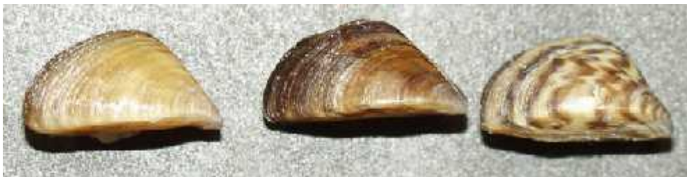
Slika 5. Vrsta Dreissena polymorpha - različita koloracija školjke

Vrsta raznolika trokutnja školjka Dreissena polymorpha , je mali školjkaš iz reda Veneroidea. Sama školjka može znatno varirati bojom, ali uvijek ima oblik nepravilnog trokuta (sl. 5).