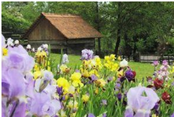
Slika 2. Hrvatski vrt perunika (preuzeto sa www.agroklub.com )