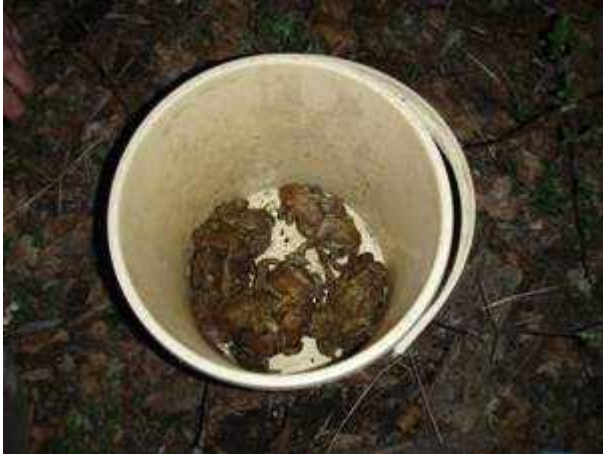
Sl. 17. Skupljanje žaba u kante te njihovo prebrojavanje nakon toga

Ženke nemaju tih problema. One prihvate mužjaka te ga tako za vrijeme migracije nose do bare i ne staju putem. Pošto ženka ide pravocrtno prema bari, izmjereno vrijeme koje joj je potrebno da prijeđe 5.4 metara široku cestu iznosi 3:50 minuta. (Samardžić, 2003.)