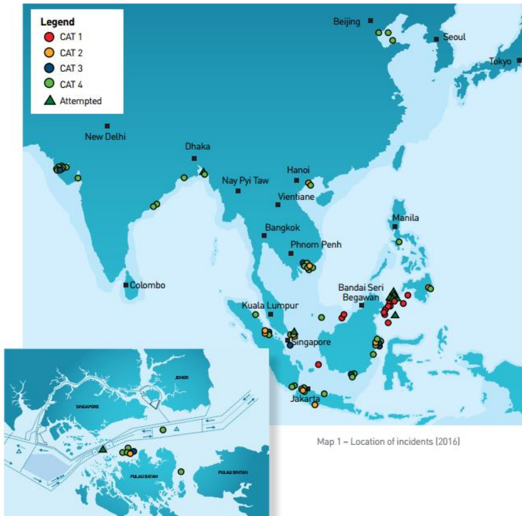
Sl. 1. Lokacije gusarskih napada prema kategoriji 2 na području Azije 2016. godine