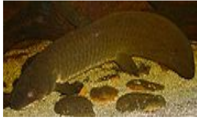
Sl. 2. Neoceratodus forsteri

trihotomiju između ove 3 grupe. Ipak, znanstvenici su na temelju otkrića ovih vizualnih pigmenata smještenim u čunjićima vrste N. Forsteri zaključili da su prvi kopneni kralježnjaci ukoliko im dvodihalice jesu najbliži živi srodnici, mogli imati vizualna osjetila osjetljiva na boje, što je izuzetno važno s obzirom na to da se perzistentnost, gubitak ili duplikacija gena za opsin reflektira na spektralni okoliš i vizualne potrebe određene vrste.