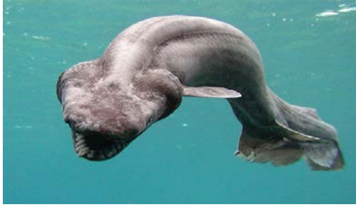
Sl. 4. Chlamydoselachus anguineus