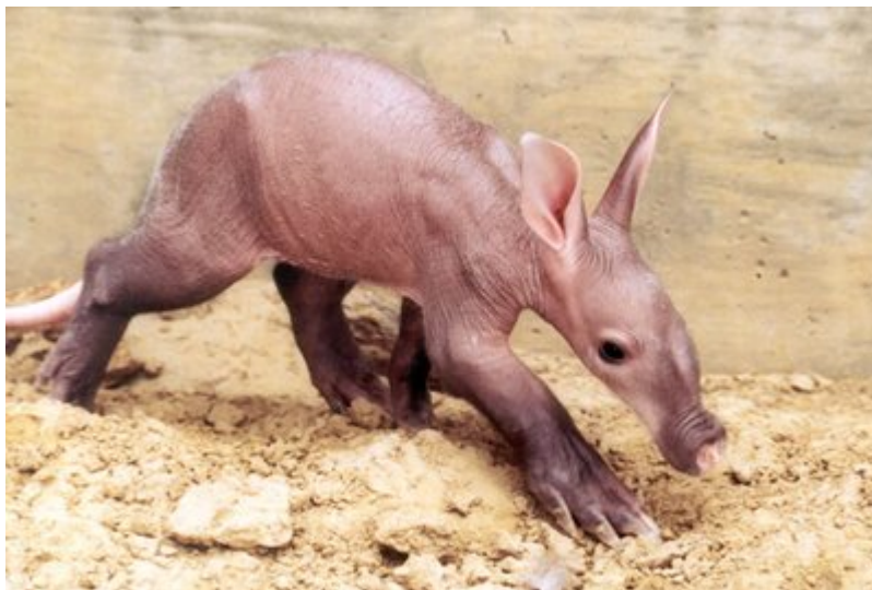
Sl. 14. Mladunče aardvarka

Aardvark je životinja prilično slična svinji. Tijelo im je lagano zakrivljeno u leđima i rijetko pokriveno oštrom čekinjastom dlakom. Stražnja stopala imaju po 5 prstiju, a prednja stopala završavaju sa 4 prsta od kojih svaki nosi veliki, robustan nokat u obliku lopatice, za koji se vjeruje da predstavlja prijelazni oblik između pandže i kopita. Izdužena glava smještena na kratkom vratu drži disproporcionalne uši i mala tubularna usta specifična za životinje koje se hrane termitima. Može narasti do maksimalne dužine od 2,2 metra. Kao primarna obrana mu služi debela koža.