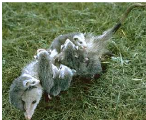
Sl.16.Ženka sjevernoameričke naboruše sa mladuncima

Svejed je, dobro se penje, pliva i snalazi na tlu. Kada je u opasnosti, pretvara se da je mrtav-nepomično leži otvorenih usta iz kojih viri jezik i otvorenih očiju i iz izmetnog otvora ispušta smrdljivu tekućinu.