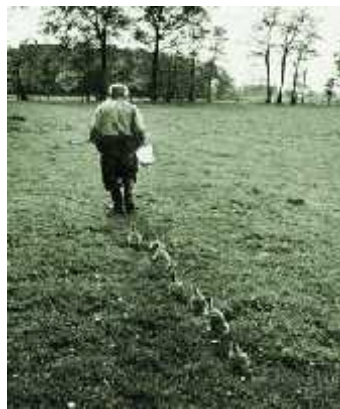
Slika 1. ( Konrad Lorenz ).

Imprint se ne može precizno definirati. Za predstavljanje teme imprinta znanstvenim krugovima najzaslužniji je Konrad Lorenz (1960-ih) sa svojim eksperimentima sa tek izlegnutim guskama, kojima je usadio da ga prate i doživljavaju kao majku.