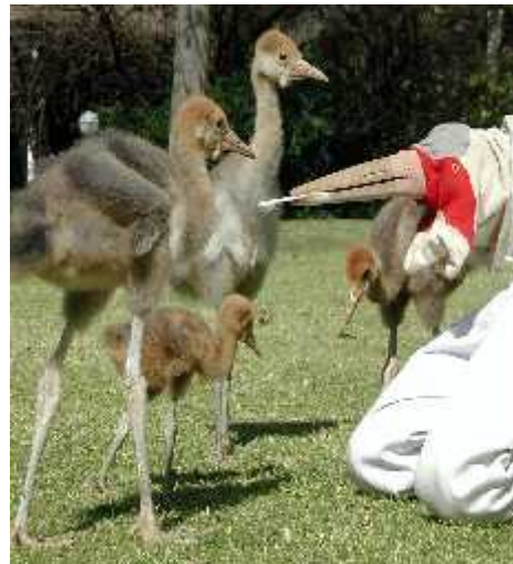
Slika 3. ( Imitacija majke kod hranjenja kako bi se izbjeglo pretjerano imprintanje na ljude ).

Graf prikazuje postotak Mallard pa i a koji e privu i zov njihove vrste, kao i ostalih vrsta koje proizvodi objekt, u ovom slu aju umjetna patka , a da do tog trenutka nisu bili izloženi niti jednom od tih zvukova.