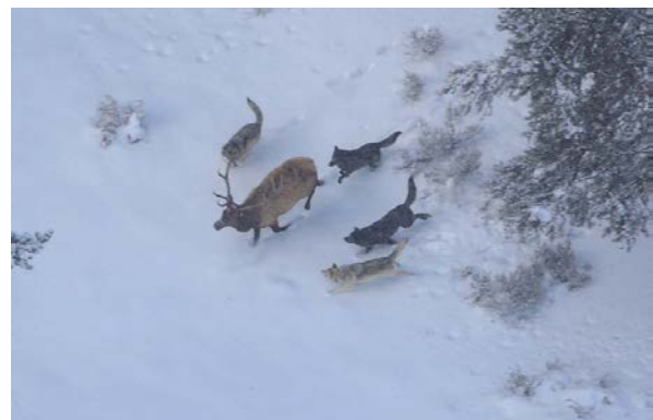
Slika 13. Los trči i smanjuje si šanse za preživljavanje en.wikipedia.org

Ako plijen ostane stajati (sl.12), može otjerati vukove iako vukovi češće ostanu čekati. Većina čopora odmara dok jedan ili dva člana iskušavaju plijen i traže znakove zamora. Pri napadu se plijen hvata ili za njušku ili zadnjicu. Plijen iskrvari, umire od šoka ili oboje. Ako je plijen manji, može mu puknuti vrat od siline ugriza (www.wolfcountry.net). Alfa par jede prvi, a onda ostali sukladno hijerarhiji ako je plijen manji, ali ako je dovoljno velik svi se hrane u isto vrijeme (Mech, 1999). Plijenu prvo pojedju unutarnje organe ili zadnjicu ako je bila oštećena u lovu, mišići i meso su zadnji na redu. Budući da vukovi imaju jake čeljusti, mogu zdrobiti kosti da dođu do njihove meke unutrašnjosti. Vukovi ostavljaju jako malo svoga plijena nepojedeno (www.wolfcountry.net).