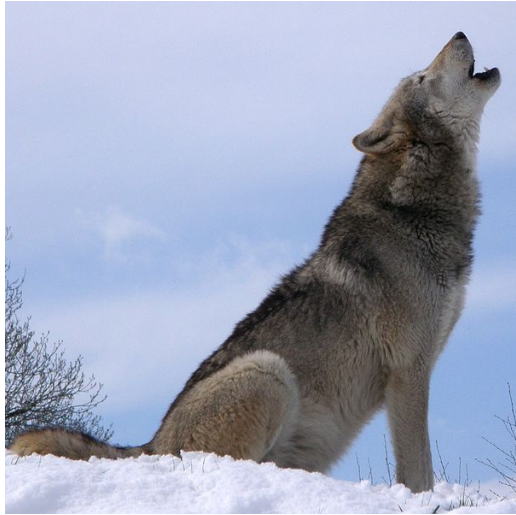
Slika 10. Zavijanje en.wikipedia.org

što onemogućava slušatelju da odredi točan broj članova čopora (Mech, Boitani, 2003). Takvo prikriivanje pravog broja može loše izaći za suparnički čopor ako su krivo procijenili broj. Zavijanje se čuje na udaljenosti od 16 km pri povoljnim vremenskim uvjetima (en.wikipedia.org).