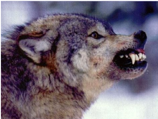
Slika 8. Agresivnost www.lioncrusher.com

Uspravne uši i nakostriješeno krzno na leđima su signali ljutnje. Usne se pomaknu prema gore ili nazad da se vide očnjaci. Vuk također može i svinuti leđa u luk i režati (Feldhamer, Thompson, Chapman, 2003).