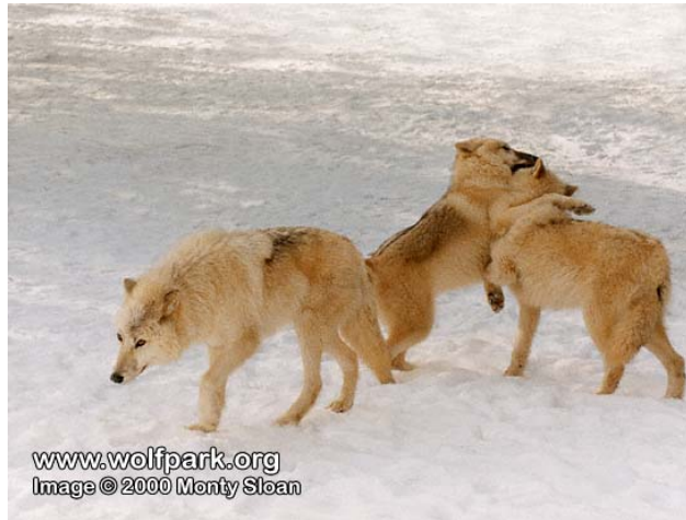
Slika 11. Igra www.vukovi.hr

Vukovi izvođe lažne borbe, love se i skaču jedni na druge (sl.11). Najdraža igra im je „napadanje“ iz zasjede neopreznih članova čopora. Igru može započeti bilo koji vuk s bilo kojim drugim članom čopora, neovisno o hijerarhiji ( www.wolfcountry.net ).