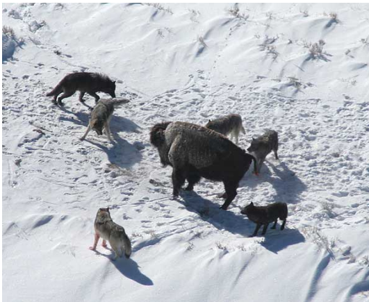
Slika 12. Bizon stoji i povećava si šanse za preživljavanje

Vukovi su primarno noćne životinje i izbjegavaju dnevnu vrućinu. Obično počinju loviti u sumrak. Plijen pronadu pomoću njuha i sluha te slučajnog susreta. Oslabljene životinje mogu pokazati svoje stanje položajem tijela, nekoordiniranim pokretima, mirisom rana ili infekcija te nekim drugim određenim signalom. Neposredno prije potjere vukovi prilaze žrtvi niz vjetar da ih ne bi odao miris upozoravajući plijen. Ako plijen počne trčati (sl.13), vukovi ga progone (www.wolfcountry.net).