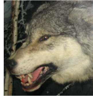
Slika 3. Očnjaci vuka

Vuk se hrani gotovo isključivo mesom, kostima i drugim dijelovima tijela životinja koje lovi, pa mu je i glava građena tako da omogućava hvatanje i jedenje plijena. Glava vuka je izdužena prema naprijed, duga prosječno 25, a široka 14 cm. Volumen mozga je od 150 do 170 cm 3 , što je najmanje 30 cm 3 više nego u većine pasa. Masivne čeljusti daju osnovu za koju su pričvršćeni snažni žvačni mišići i 42 specijalizirana zuba. Očnjaci (sl. 3) su najveći, a služe za hvatanje i ubijanje plijena. Za žvakanje i "rezanje" mesa i tetiva vuk se najviše koristi četvrtim gornjim pretkutnjakom i prvim donjim kutnjakom (karnasijalni zubi), koji pri žvakanju djeluju kao škare, dok mu za lomljenje kostiju služe snažni kutnjaci ( www.life-vuk.hr ). Sva osjetila, a naročito njih i sluh, u vuka su odlično razvijena ( www.life-vuk.hr ).