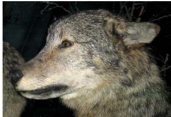
Slika 9. Strah en.wikipedia.org

Uplašen vuk (sl.9) pokušava sebe učiniti što manjim i manje napadnim; uši su polegnute uz glavu, rep može biti između nogu kao i kod podčinjenog vuka. Također može cviliti ili lajati iz straha te svinuti leđa u luk. Agresivan vuk (sl.8) ima nakostriješenu dlaku, reži i u čučnju je spreman napasti ako treba (Mech, Boitani, 2003). Opuštenom vuku rep pokazuje prema zemlji te može mahati njime. Što je rep bliže zemlji to je vuk opušteniji. Vuk odmara u položaju sfinje ili na bočnoj strani. Sreću pokazuje kao i psi, mašući repom, može imati isplažen jezik. Ako je vuk zaigran, drži rep visoko i maše njime, može skakutati okolo ili spustiti prednji dio tijela do zemlje, dok zadnji dio drži visoko u zraku (Mech, Boitani, 2003).