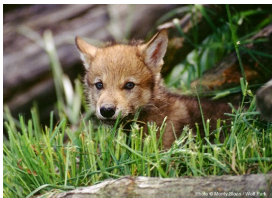
Slika 5. Štene www.vukovi.hr

Kada alfa ženka uđe u estrus, ona i mužjak će provesti neko vrijeme odvojeni od ostatka čopora. Tjeranje traje 5 – 14 dana, za vrijeme kojeg dolazi do parenja ( www.animaldiversity.ummz.umich.edu ). Trudnoća traje 62, 63 dana, a vučići (sl. 5) se rađaju u brlogu koji je vučica prije iskopala (Feldhamer, Thompson, Chapman, 2003). Ako se brlog