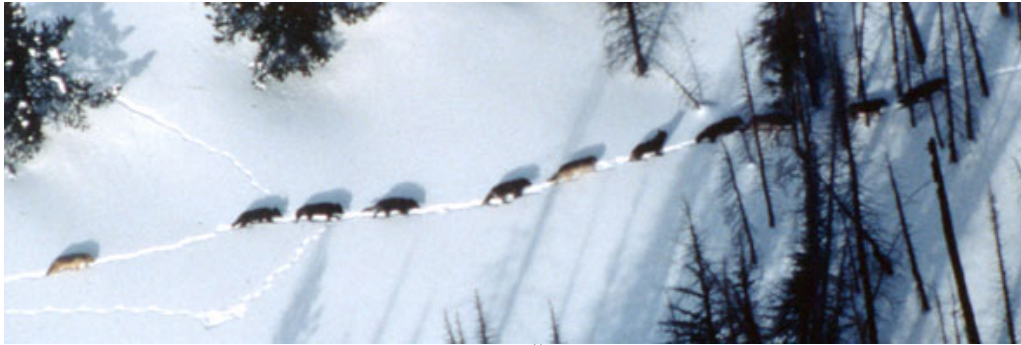
Slika 6. Čopor

kojoj žive vukovi zove se čopor (sl. 6). Vukovi mogu živjeti i sami, ali to su obično starije jedinke istjerane iz čopora ili mladi vuk u potrazi za vlastitim teritorijem.