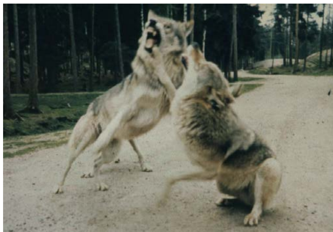
Slika 7. Borba www.ae.imcode.com

Vukovi su izrazito teritorijalni; prostor na kojemu žive obilježavaju urinom, izmetom, grebanjem po tlu i zavijanjem i time si osiguravaju plijen. Strani vuk može ući u teritorij čopora, no ako to čopor otkrije, gotovo redovito će ga ubiti, a katkad i pojesti. Isto se može dogoditi i psu ako uđe u teritorij vukova jer i njega vjerojatno doživljavaju kao stranoga vuka ( www.life-vuk.hr ).