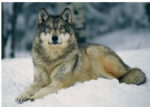
Slika 1. Vuk

Najveći vukovi (sl. 1) žive na sjeveru (prosječna masa = 41 kg - Aljaska, Northwest Territory,) dok su predstavnici južnijih populacija (Indija, Pakistan, Afganistan) upola manji ( www.life-vuk.hr ). Mužjaci mogu težiti do 60 kg, a ženke su između 10 i 15% manje (Grzimek, 2003). U Hrvatskoj odrastao vuk dugačak je prosječno 1.70m, od čega 42cm otpada na rep. Masa odraslog vuka je prosječno 31 kg ( www.life-vuk.hr ). Boja krzna je tamnosiva na leđima i repu, a svijetlosiva na nogama i truhu (Brehm, 2003). U različitim dijelovima svijeta žive vukovi kojima boja varira, u rasponu od bijele na Arktiku, preko