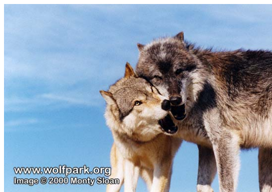
Slika 4. Vučji par

Dominantan par jedini ima potomstvo u čoporu. Par je monogaman, ali ako dođe do smrti alfa jedinke, novi alfa mužjak ili ženka će preuzeti reprodukcijsku ulogu ( www.animaldiversity.ummz.umich.edu ). Vučica se tjera jednom u godini, između siječnja i travnja – u sjevernim dijelovima kasnije, u južnim ranije (Feldhamer, Thompson, Chapman, 2003). Za vrijeme sezone parenja, alfa par postane nježan jedno prema drugome dok čekaju ženski ovulacijski ciklus. U to vrijeme alfa par (sl. 4) ponekad mora spriječiti ostale vukove da se ne pare međusobno. Reprodukcija ženskih vukova se regulira agresivnošću među ženkama, prekidanjem pokušaja kopulacije i odgađanjem reprodukcije mladih ženki (Feldhamer, Thompson, Chapman, 2003).