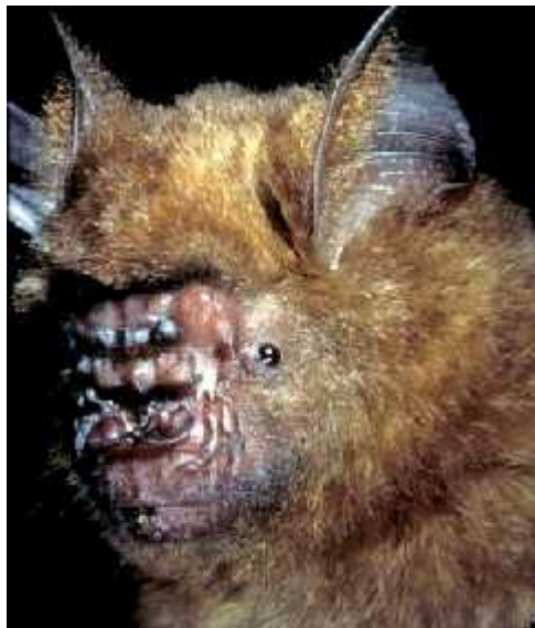
Slika 2. Pteronotus parnellii vrsta porodice