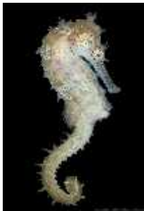
Slika 17. Hippocampus barbouri