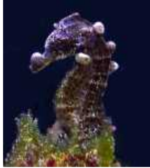
Slika 39. Bakterijska infekcija koja uzrokuje mjehuriće ispunjene plinom ( http://gallery.seahorse.org/ )