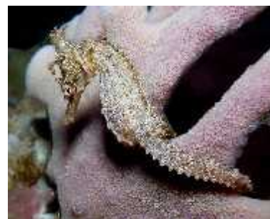
Slika 37. Hippocampus whitei ( http://www.scuba-equipment-usa.com/ )