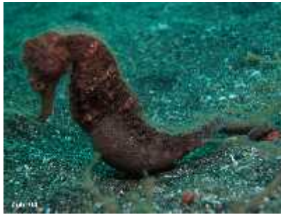
Slika 31. Hippocampus mohnikei ( http://www.starfish.ch/photos/ )