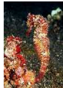
Slika 36. Hippocampus spinosissimus