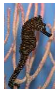
Slika 38. Hippocampus zebra ( http://gallery.seahorse.org/ )