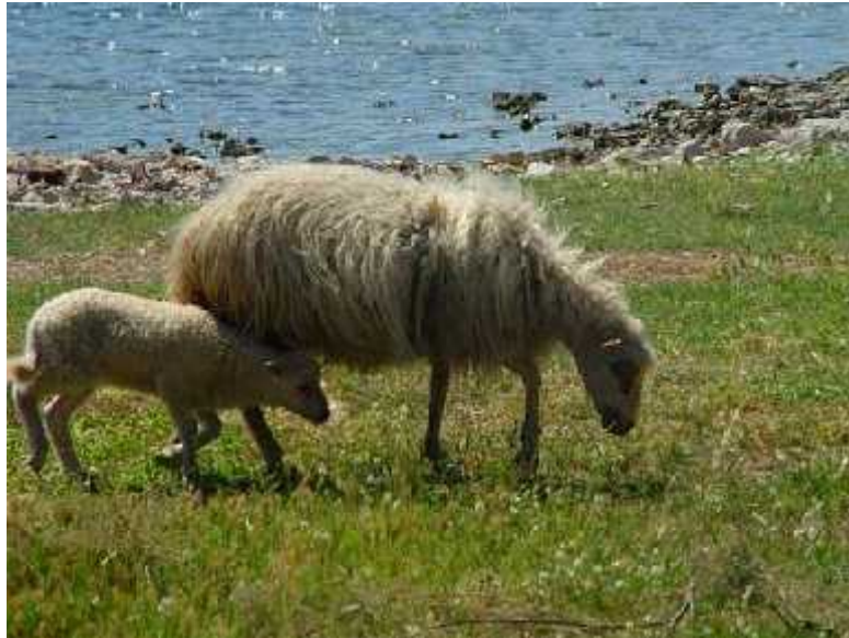
Slika 9. Kornatska ovca

piju more, a zapravo je ta voda boata. U prošlosti su bile važan izvor prihoda Betinjanima i Murterinima zbog mesa, vune, mlijeka i sira. Danas samo rijetki kornatski pastiri šišaju ovce i prodaju vunu (Feri, 1999).