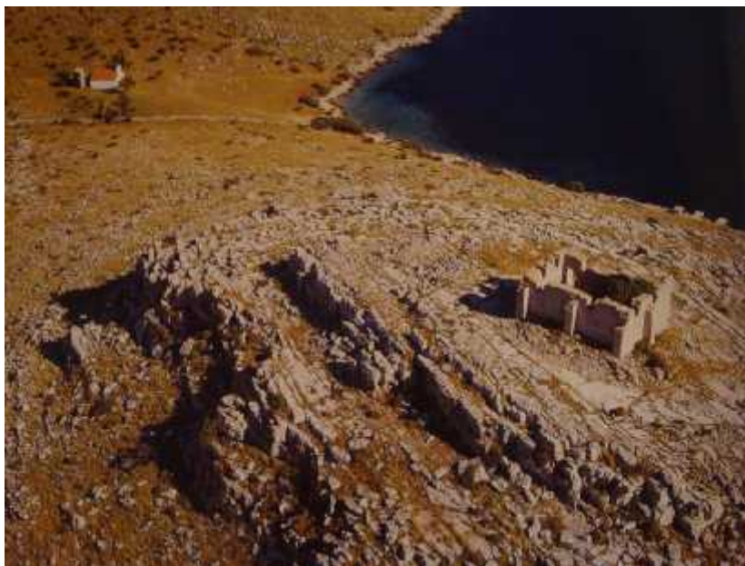
Slika 4. Utvrda Tureta i Crkva Pohođenja Marijina (Kornati – okrunjeni otoci)

Danas se slavi sve više blagdan Gospoje o Tarca, o čemu svjedoče utabane staze od mora do crkvice. Pohod je određen za prvu nedjelju srpnja kada brojni hodočasnici dolaze svojim brodovima na blagoslov. Blagoslov je u današnje vrijeme više posvećen moru, a nekada je bio više posvećen polju (Skra i , 2003).