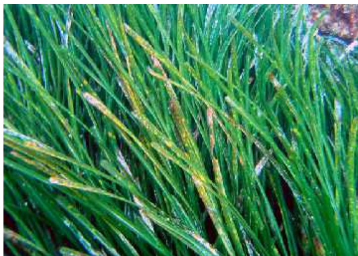
Slika 7. Posidonia oceanica

Morska cvjetnica Posidonia oceanica predstavlja najvažniji element biološke raznolikosti priobalnog dijela Kornatskog otoka jer je hranilište, mrijestilište i stanište brojnih morskih organizama (slika 7). U današnje vrijeme je ugrožena zbog sve većeg broja brodova koji posjećuju kornatski arhipelag i sidre se na mjestima njena rasta. Posidonia oceanica obogaćuje morsku vodu kisikom, korijenjem uvršćuje sediment i sprječava eroziju obale svojim dugim listovima ( http://www.mzopu.hr/doc/PPNPKornati ).