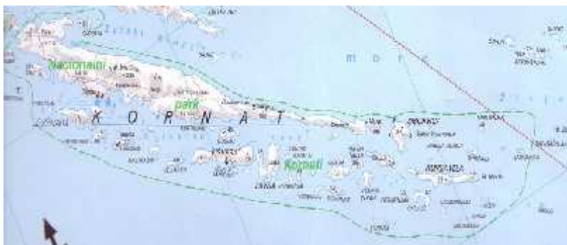
Slika 2. Karta Nacionalnog parka Kornati ( http://www.mein-kroatien.info )

Dana 24. srpnja 1980. godine otprilike dvije trećine kopna i akvatorija Kornatskog otoka je proglašeno nacionalnim parkom (slika 2). Sitski i Žutski otoci ni nizovi su izostavljeni prilikom uvođenja najvećeg stupnja zaštite tako da oni danas ne ulaze u granice Nacionalnog parka Kornati iako po svim karakteristikama pripadaju kornatskoj otojnoj skupini (Skra i , 2003). Na Kornatima su provedena brojna znanstvena istraživanja, ali usprkos njima Kornati još uvijek nisu dovoljno istraženi (Kulušić , 2006). Nacionalnim parkom su postali zbog mnogih specifičnosti; obala otoka Kornatskog niza je strmo odsječena prema otvorenom moru, podmorje predstavlja i pri čija posebnu prirodu, otoci su svjedoci nekog drugog vremena, priroda je gotovo u potpunosti netaknuta... Na Kornatima su prisutne i antropološke vrijednosti i to iz ne tako davne prošlosti što ih čini još zanimljivijima.