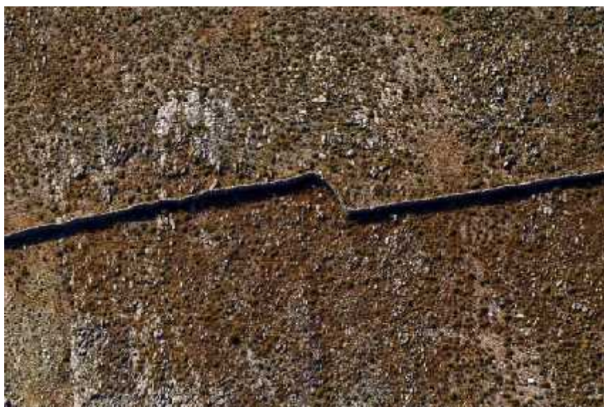
Slika 3. Kornatski suhozid

1889. godine izgrađeni su prvi zidovi „u suho“ koji su polovili Kornat i Žut od mora do mora, to jest s jedne strane otoka na drugu (slika 3). Zidovi su se poeli graditi kako bi se postavile granice prilikom ispaše stoke. Za ljude na Kornatima zidovi su predstavljali znak vlastitog identiteta u prostoru. U prošlosti su se suhozidi gradili najčešće zimi, a ljetinom – po mjesecima jer je danju bilo prevruće. Procjenjuje se da je ukupna dužina sagrađenih suhozida na Kornatima približno 300 kilometara. Kamenje nije spojeno nikakvim vezivom, a zidovima vrsto udaje samo vještina slaganja kamena tako da jedan kamen drži drugi (Kulušić, 2006).