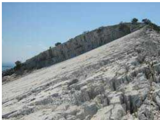
Slika 5. Magazinova škrila ( www.odisej.org )

Magazinova škrila, koja se još naziva i Velom plo om, specifi no je klizište kod kojega je veliki sloj vapnenca kliznuo po svojoj podlozi gra enoj tako er od vapnenca istog sastava i osobitosti (Feri , 1999) (slika 5). Magazinova škrila je veoma neuobi ajena pojava. Geolozi smatraju da je do klizanja tako velike kamene plohe došlo zbog potresa. Nastala je prije otprilike 200 godina. Njena površina iznosi 9100 m 2 . Nalazi se na otoku Kornatu, a odli no se vidi sa Žuta (Feri , 1999).