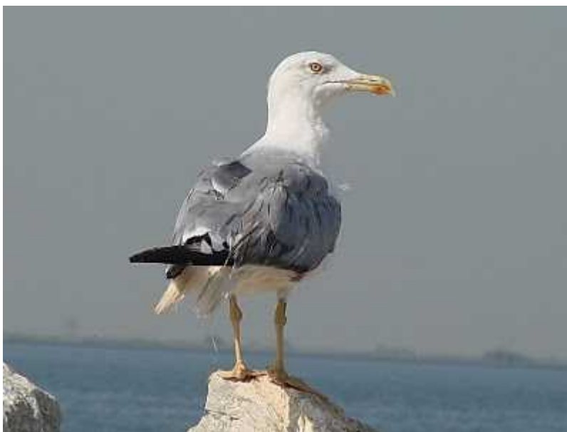
Slika 8. Galeb klaukavac – Larus cachinnans