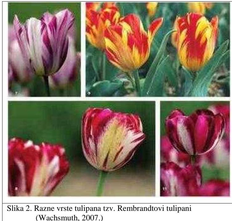
Slika 2. Razne vrste tulipana tzv. Rembrandtovi tulipani (Wachsmuth, 2007.)