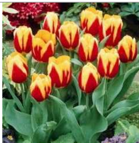
Slika 3. Tip Keizerkroon

Nizozemci su postali vješti uzgajivači tulipana već u vrijeme kad su tulipani izazvali tulipomaniju te skoro uzrokovali krah ekonomije, njihova se strast za ljubljenim im cvijećem nije smanjila do danas. Do vremena kada se više nisu smjeli uzgajati tulipani inficirani virusima zbog činjenice da takve lukovice dovode do degeneracije biljke, uzgajivači tulipana su već savladali tehniku kako hibridizacijom uzgojiti tulipane koji slični su „Rembrandtovim“, a da su pritom bez virusa i genetički stabilni. Tako je crveno-žuti tip „Keizerkroon“ (sl. 3. i 4.) poznat još od 1750. godine. Od tih vremena, uzgajivači hibrida neumorno rade na razvoju novih i ljepših kultivara. Danas su mnogi različiti kultivari dostupni za uzgajanje kod kuće. Nizozemska je pak najveći proizvođač cvijeća na svijetu i izvozi više lukovica tulipana nego ijedna druga zemlja (Pi-Yu, 2007).