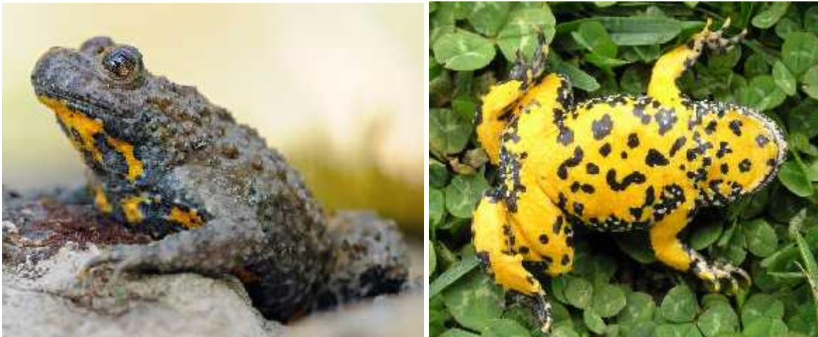
Slika 2.) Bombina variegata – žuti muka (dorzalna i ventralna strana)

Pojavljuju se u zapadnoj, središnjoj, južnoj i istočnoj Europi.