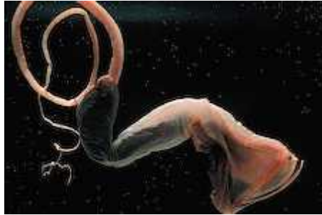
Slika 3. velika usta kod vrste Saccopharynx lavenbergi

pliće slojeve mora gdje je hrana uvijek dostupna u velikim količinama dok nemigratorne vrste moraju maksimalno iskoristiti svaki teško pronađen i ulovljen obrok (Drazen i sur. 2007).