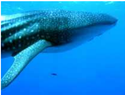
Slika 1. Rhincodon typus ( www.fishbase.org )

Iako takva mjesta osiguravaju vrlo malo uvjeta za razvoj života, ribe su im se uspjele prilagoditi. Evolucija je nevjerojatna sila koja savladava i najve e prepreke a pogotovo u tako dugom vremenskom razdoblju. Pogledamo li samo razliku izme u najve e (kitopsina, Rhincodon typus , dužina do 20 metara i teži do 34 tone, slika 1) i najmanje ( Paedocypris progenetica , dužina 1 cm, slika 2) ribe na svijetu, možemo tek naslutiti kakva je raznolikost me u ribama ( www.fishbase.org ).