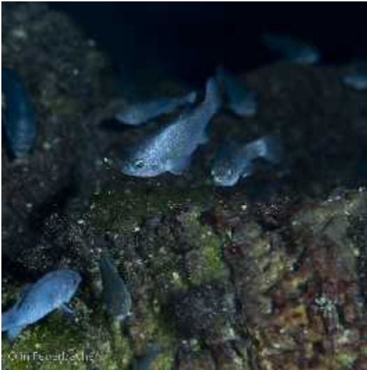
Slika 7. Cyprinodon diabolis

Najekstremniji primjer je riba Cyprinodon diabolis (slika 7) koja živi u pustinji Ash Meadows u saveznoj državi Nevadi. Njezino stanište je izvor u vapnena koj stijeni nazvan Devil's hole (slika 8). Dimenzije izvora su 3.5 sa 22 metra. Riba se zadržavaju samo na jednom podru ju, 30 cm dubokom platou obraslom algama kojima se i hrane. Sveukupna populacija ovih riba se kre e izme u 200 i 500 jedinki, ovisno o koli ini algi koje su se te godine razvile (Hutchins i sur. 2003).