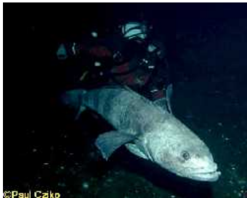
Slika 5. Dissostichus mawsoni

Cijela porodica Nototheniidae (najpoznatiji predstavnik Dissostichus mawsoni , slika 5) je karakteristična isključivo za antarktičke vode. Ribe ove porodice nemaju pliva i mjehur, tamne su boje i okrugle u presjeku. Proizvode mali broj velikih jaja u kratkom razdoblju mrijesta. Karakterizira ih spor rast. Hrane se oportunistički: zooplankton, rakovi, ribe. Imaju hrskavične dijelove kostura i sadrže mnogo masti u tijelu pa održavaju neutralnu plovnost. Neke ribe iz ove porodice nemaju hemoglobin ni mioglobin, pa iako je hladno more bogato kisikom njihov metabolizam je vrlo usporen. Temperatura vode je ovdje većim dijelom godine ispod nule pa ove ribe u krvi imaju antifriz glikopeptid (AFGP). Molekule AFGP-a se vežu na mikroskopske kristale leda sprečavajući da kristal naraste do veličine koja bi oštetila stanicu (Hutchins i sur. 2003).