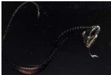
Slika 4. Idiacanthus atlanticus sa svjetlećim mamcem