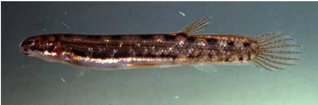
Slika 6. Lepidogalaxias salamandroides

Afrička dvodihalica u stanju mirovanja dušični otpad skladišti u obliku uree koja je manje otrovna od amonijaka, koji ribe proizvode u normalnim uvjetima (Wilkie i sur. 2007).