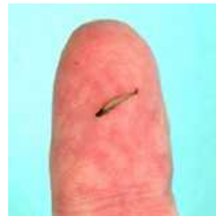
Slika 2. Paedocypris progenetica