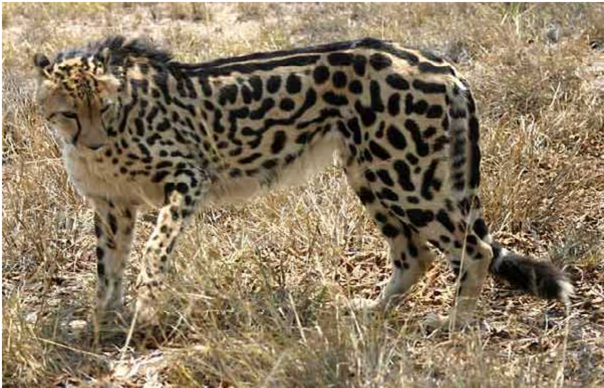
Slika 12. Kraljevski gepard

podvrsta nego samo rijetka mutacija nasljeđena jednim recesivnim genom (oba roditelja moraju imati taj gen da bi mladi bili takvi). Kraljevski gepard je jako rijedak, ima ga svega oko 30 jedinki u Zimbabveu, ali je važan zbog porasta genetičke diverziteta unutar potporodice Acinonychinae . (R. J. van Aarde, A. van Dyk 1986).