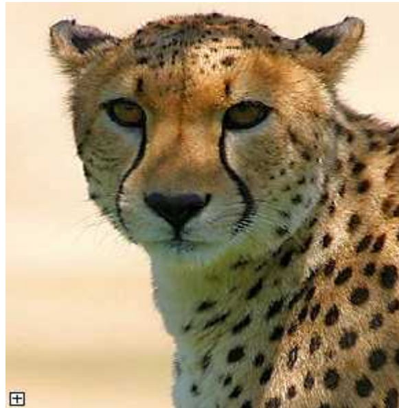
Slika 2. „Tear stripes“ na glavi geparda

Prosječna jedinka geparda teži do 60 kg, visoka je do 135 cm i ima do 90 cm duga ak rep. Osnovna boja krzna je žuta, a na truhu je prilično svjetlija. Krzno je prosuto velikim brojem malih, crnih, solitarnih pjega koje prekrivaju cijelo tijelo osim grla i trbuha. Glava je mala i okrugla sa licem koje je malo tamnije i bez pjega sa malim zubima i visoko postavljenim oči ima zbog proširenih nosnica. Glava im je uvijek fokusirana tj. okrenuta prema naprijed kao prilagodba na predatorski način života. Uši su također male i spljoštene. Na glavi nalazimo dvije crne pruge koje idu od oči do kuta usana (tzv. „tear stripes“) po kojima možemo razlikovati geparda od ostalih mačaka koje to nemaju. (D. W. Macdonald 2006).