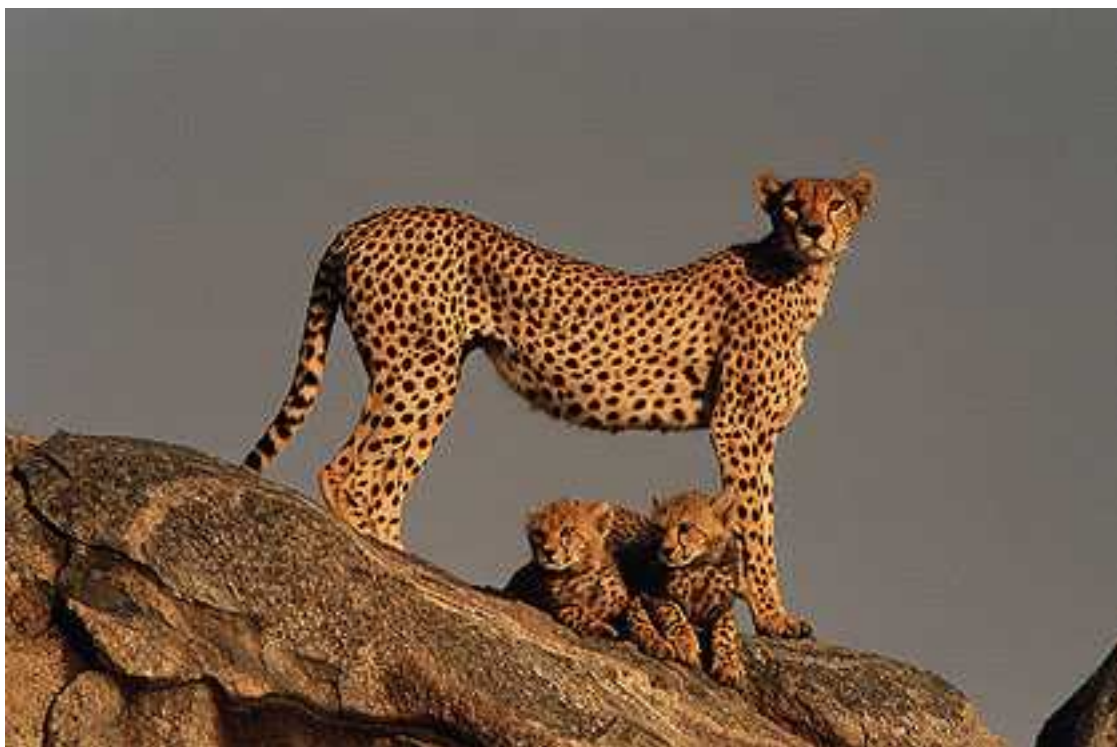
Slika 1. Gepard na uzvišenju promatra okolinu

Gepard je životinja savana ( travnjaci tropskog i subtropskog podneblja s rijetkim šumarcima stabala i grmlja). Osim savana nastanjuju i šume, brežuljke, planinska područja pa čak i pustinje ( Acinonyx jubatus hecki ), a kišna šuma je područje koje u potpunosti izbjegavaju. Daju prednost područjima s visokom travom koja pruža mogućnost prikrivanja i s uzvišenjima koja koriste kao mjesto s kojeg imaju dobar pogled na okolinu. Područja s puno stabala i grmlja nisu pogodna za geparde jer u takvom okolišu ne mogu u punoj mjeri iskoristiti svoju najveću prednost, a to je brzina.