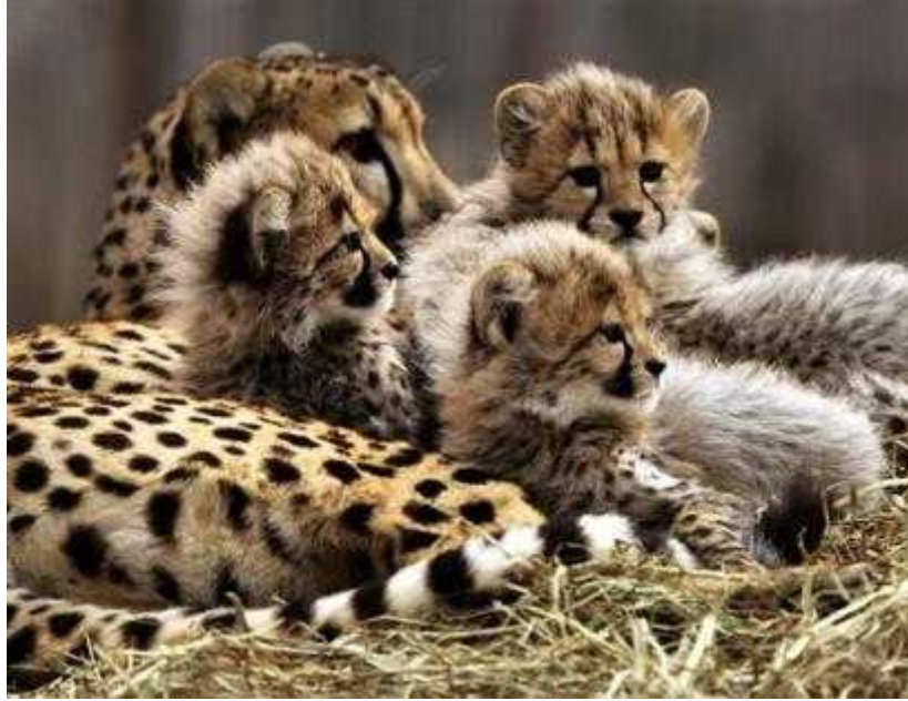
Slika 4. Majka sa mladima