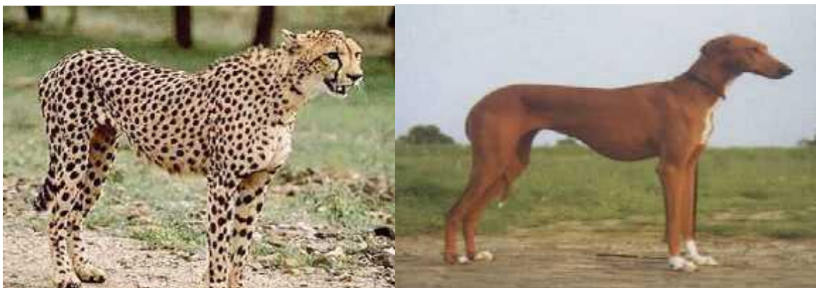
Slika 13. Sli nost tijela geparda i hrta