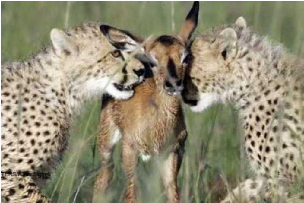
Slika 3. U enje lova na mladoj antilopi

Ženke žive same ili s mladima dok mužjaci lutaju u grupama od 3-4 jedinke ili sami. Sre u se samo u vrijeme parenja i odmah se razilaze. Ženke koje su spremne za parenje obilježe područje na kojem se nalaze urinom i tako privuku mužjake. ( Marker-Kraus, Kraus 1993). Oko jedne ženke se uvijek skupi ve i broj mužjaka, ali samo onaj najdominantniji osvoji ženku. Ženka živi s mladuncima dok ne odrastu i u i ih loviti nakon 5-6 tjedana starosti. U enje mladih lovu je jedna od specifi nih osobina geparda. Majka ulovi živu mladu životinju pr. gazelu da bi mladunci mogli vježbati lov. Pusti ju ispred njih te ih u i osnove lova: tiho prikradanje, kako srušiti plijen, kako ga ubiti jednim ugrizom za vrat, a isto tako u e savladati strah.