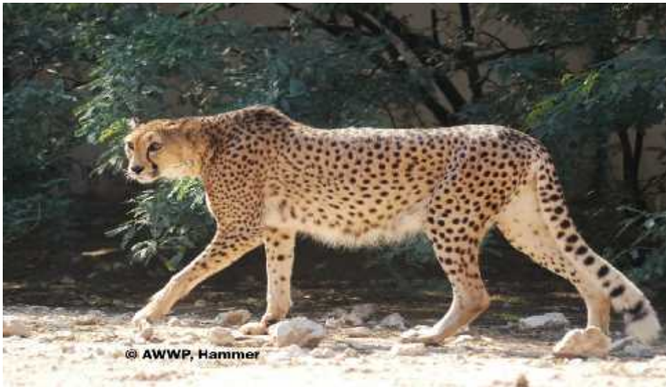
Slika 11. Acinonyx jubatus soemmerringii

Acinonyx jubatus soemmerringii ( Slika 11.) ili Sudanski gepard je posljednja podvrsta geparda o kojoj kao i o prethodne tri podvrste ne znamo gotovo ništa osim područja na kojem živi. Viđen je na području sjeveroistodne i centralne Afrike ( Sudan, Kamerun, Etiopija, Nigerija, Egipt, Somalija). Broji oko 500 jedinki od kojih najviše obitava na području Sudana. Specifična karakteristika za tu podvrstu su posebno intenzivne crne pjege po tijelu. Znanstvena istraživanja na temelju mitohondrijske DNA i sveukupne genetske diferencijacije pokazuju da se ova podvrsta na molekularnoj razini malo razlikuje od ostalih podvrsta koje su međusobno gotovo identične. ( P. Charrum 2011.) Kao i prethodne tri podvrste ubrajamo ga u kategoriju zaštite VU ( Osjetljivi) prema IUCN-ovoj listi zaštite.