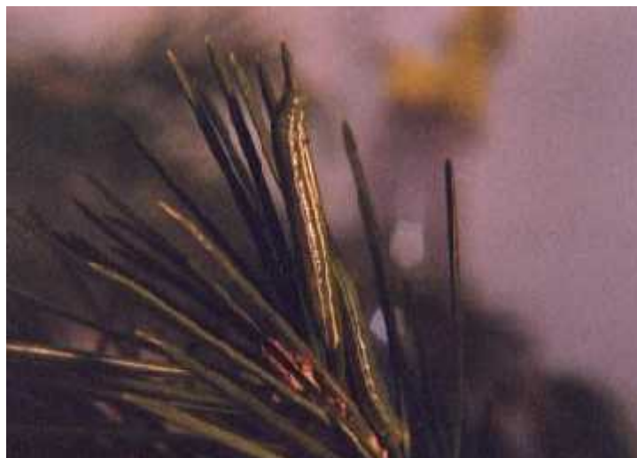
Slika 6. Gusjenica vrste Neophasia menapia menapia na iglici bora.

Gusjenice vrste Neophasia menapia menapia hrane se borovim iglicama (Slika 6). Tako su dobro kamuflirane da su jako teško uo ljive. Uo lživije postaju ako se granicu na kojoj se nalaze pošprica s malo vode. Tada se po nu gibati kao da kimaju glavom ( http://www.raisingbutterflies.org/finding-immatures/mimicry-and-camouflage/ ).