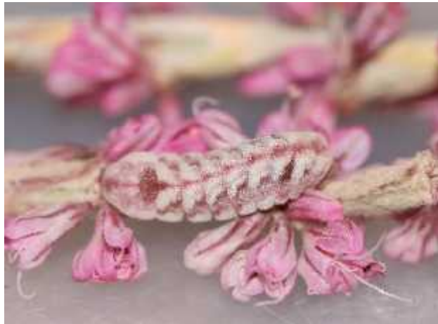
Slika 5. Gusjenica vrste Celastrina ladon echo na biljci vrste Eriogonum racemosum ( http://www.raisingbutterflies.org/picture/c_1_echo_kooshcn_3rdinstar.jpg?pictureId=3050850 )

Gusjenice vrste Neophasia menapia menapia hrane se borovim iglicama (Slika 6). Tako su dobro kamuflirane da su jako teško uo ljive. Uo lživije postaju ako se granicu na kojoj se nalaze pošprica s malo vode. Tada se po nu gibati kao da kimaju glavom ( http://www.raisingbutterflies.org/finding-immatures/mimicry-and-camouflage/ ).