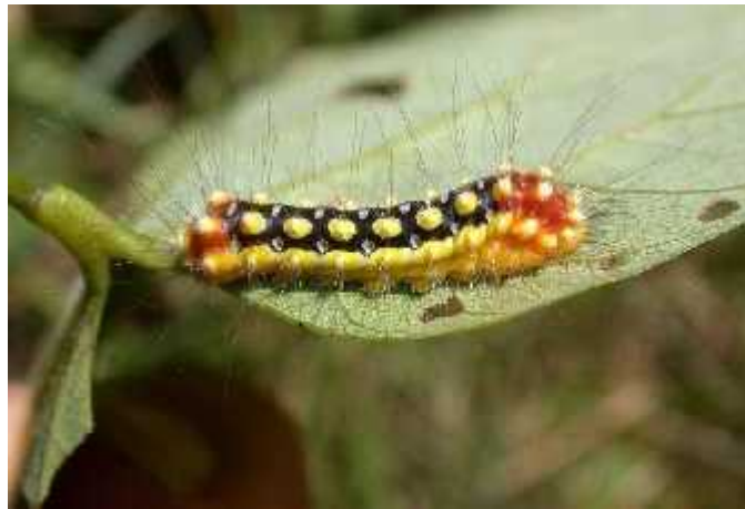
Slika 10. Gusjenica vrste Norape ovina prekrivena bodljama ( http://pics.davesgarden.com/pics/2007/01/20/DiOhio/5d9464.jpg )

Dok neke gusjenice koriste žarke boje i loš okus ili otrov kako bi se zaštitile, druge su razvile direktniju obranu – one bodu. No, ne unose otrov ubodom kao što to rade pčele ili ose, već umjesto toga posjeduju šuplje bodlje duž leđa koje su povezane sa žlijezdama koje sadrže otrov (Slika 10). Kada se te bodlje prelome uslijed napada od strane predatora, dođe do ispuštanja otrova ( http://www.ehow.com/info_8289181_caterpillar-varieties.html ).