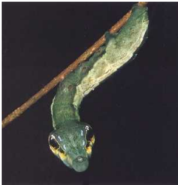
Slika 3. Primjer mimikrije kod gusjenica porodice Sphingidae

Neke gusjenice iz porodice Sphingidae mogu oponašati zmiju (Slika 3). Kada se osje aju ugroženima, napušu " rep" koji tada izgledom podsje a na glavu zmije, okrenu ga prema predatoru te ga na taj na in prestraše ( http://www.animalpicturesarchive.com/view.php?tid=3&did=20703 ).