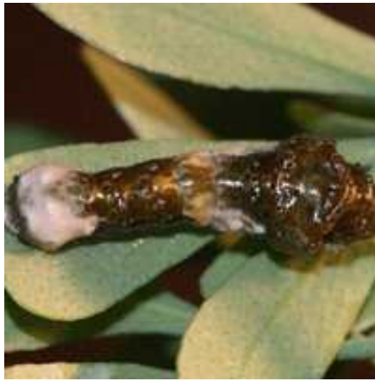
Slika 7. Gusjenica vrste Papilio cresphontes na jasenu Ruta graveolens .

Neke se gusjenice štite kamufliraju i se kao pti ji izmet. Pošto su ptice prirodni neprijatelji gusjenica, a i leptira, biti obojan kao pti ji izmet ima velike prednosti. Jer zašto bi ptica željela jesti vlastiti izmet. Neke od vrsta kod kojih se ovaj vid mimikrije pojavljuje su Papilio cresphontes (Slika 7.), Papilio glaucus ( http://www.raisingbutterflies.org/finding-immatures/mimicry-and-camouflage/ ).