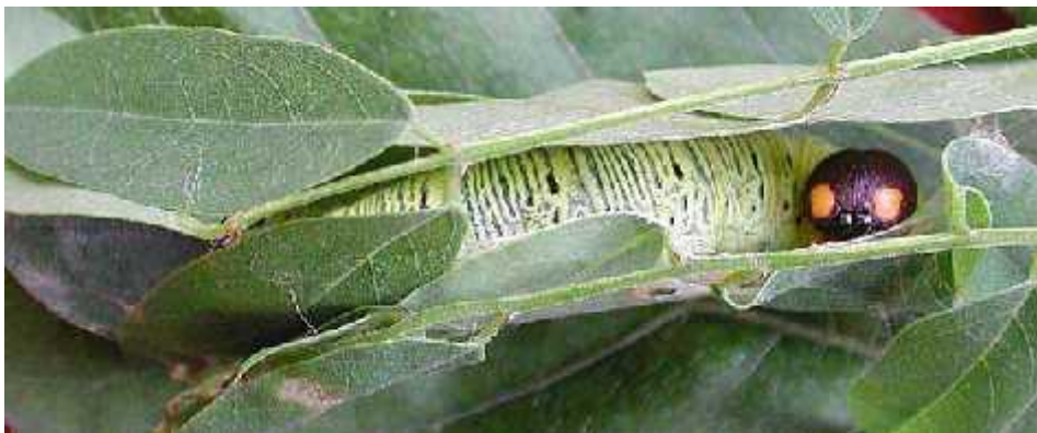
Slika 2. Primjer skloništa gusjenice vrste Epargyreus clarus ( http://www.dallasbutterflies.com/Butterflies/LARVA/pics/claruslarva.jpg )

Na istraživanjima provedenim na vrsti Epargyreus clarus utvrđeno je da su nezaštićene gusjenice imale manju stopu preživljavanja prilikom izlaganja predatorima. Prilikom izlaganja gusjenica mravima vrste Crematogaster opuntiae utvrđeno je da skloništa odgađaju ili sprječavaju detekciju gusjenica. Mravi su u više navrata hodali po samome skloništu, no kako mogu detektirati najvažniju samo gusjenicu u kretanju, osim ako nije u dometu od jedne duljine njihova tijela, gusjenice su ostale zaštićene u skrovištima (Jones i sur., 2002.).