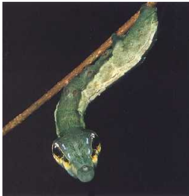
Slika 3. Primjer mimikrije kod gusjenica porodice Sphingidae

Neke gusjenice iz porodice Sphingidae mogu oponašati zmiju (Slika 3). Kada se osje aju ugroženima, napušu ” rep” koji tada izgledom podsje a na glavu zmije, okrenu ga prema predatoru te ga na taj na in prestraše ( http://www.animalpicturesarchive.com/view.php?tid=3&did=20703 ).