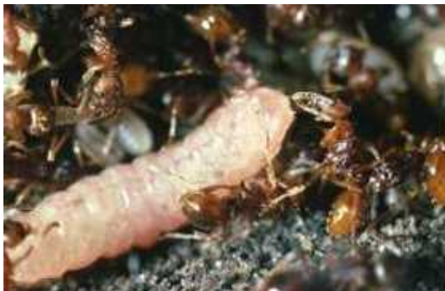
Slika 4. Mravi radnici vrste Myrmica schencki brinu se za gusjenicu vrste Maculinea rebeli ( http://www.macman.ufz.de/data/12204.jpg )

Prevnstveno, gusjenice ispuštaju kemijske spojeve koji nalikuju spojevima koji se nalaze na površini li inki mrava. Zanimljivo je da osim kemijskih spojeva i gusjenica i kukuljica ispuštaju zvukove koji nalikuju glasanju mravlje kraljice (i mravi radnici se glasaju, no glasanje gusjenice i kukuljice je sli nije onom od kraljice). Kraljica posjeduje stridulatorne organe, no nepoznato je na koji na in gusjenica i kukuljica proizvode zvuk ( http://whyevolutionistrue.wordpress.com/2009/02/07/a-bizarre-case-of-sound-mimicry-involving-caterpillars-and-ants/ ).