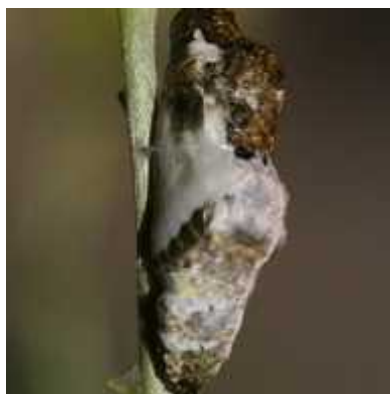
Slika 8. Kukuljica vrste Pontia beckeri koja nalikuje na pti ji izmet ( http://www.raisingbutterflies.org/picture/p_beckeri_pupa1_5_commpit_w600_h780.jpg?pictureId=3593651&asThumbnail=true )

Kod nekih vrsta obojenost kukuljice nalikuje na pti ji izmet (Sl. 8.) ( http://www.raisingbutterflies.org/finding-immatures/mimicry-and-camouflage/ ).