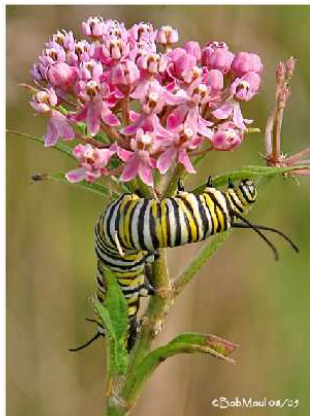
Slika 9. Gusjenica monarha ( Danaus plexippus ) na biljci iz roda Asclepias . ( http://www.wild-facts.com/wp-content/uploads/2009/10/65105265.OZIfsVJH.47693502.MonarchCatMilkweed2.jpg )

Neke vrste, kao npr. gusjenice monarha ( Danaus plexippus ) apsorbiraju toksine iz biljke domaćina (rod Asclepias ) i akumuliraju ih u svojim tijelima (Slika 9). Pošto je lišće tih biljaka otrovno i gorko, i same gusjenice postaju otrovne i gorke. Gusjenice koje imaju taj mehanizam obrane su žarkih boja kako bi upozorile predatore da nisu dobre za jelo ( http://www.ehow.com/info_8289181_caterpillar-varieties.html ).