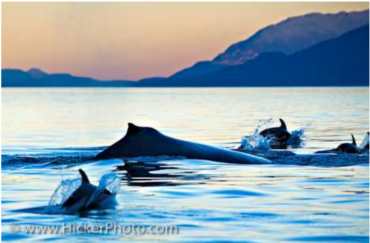
Slika 5: Lagenorhynchus obliquidens & Megaptera novaeangliae – preuzeto s

Osim zajedništva unutar istih vrsta, ve ina vrsta dupina vi ena je u društvu drugih vrsta. U isto nom tropskom Pacifiku poznate su zajednice dupina Stenella attenuata i Stenella longirostris u agregaciji sa tunom žutih peraja ( Thunnus albacares ) i brojnim vrstama morskih ptica. U Meksi kom zaljevu pet vrsta iz roda Stenella živi na relativno malom podru ju, što je više vrsta iz tog roda nego u ikojem drugom dijelu tropskih oceana. Ostala poznata interspecifi na udruženja su ona izme u vrsta Peponocephala electra i Lagenodelphis hosei , te izme u dobrog dupina i vrste Globicephala macrorhynchus , Nekoliko vrsta, poput Lissodelphis borealis i Lagenorhynchus obliquidens , su vi ene s brojnim drugim vrstama morskih sisavaca iz skupina Mysticeti i Pinnipedia (Sl. 5).