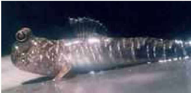
Slika 4. Periophthalmus gracilis

Šume mangrova svojim bogatim i raznolikim sustavom korijena te visokim krošnjama mnogim organizmima pružaju utočište, stanište te mjesto za lov i hranjenje. Sustav mangrova se temelji na detritusnom tipu hranidbene mreže. Otpalo lišće i razgrađuju detritivori i time se produktivnost povećava.