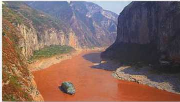
Slika 1. Taloženje mulja u akumulaciji HE Tri klanca na rijeci Jangce (NR Kina)