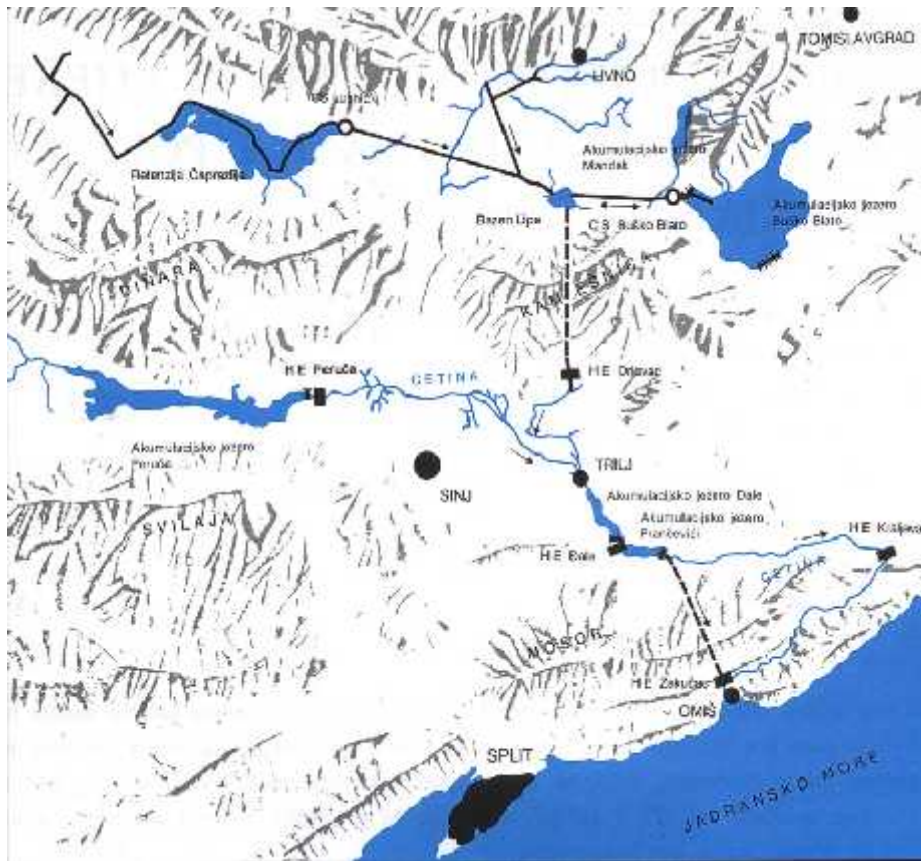
Slika 5. Hidroenergetski sustav rijeke Cetine