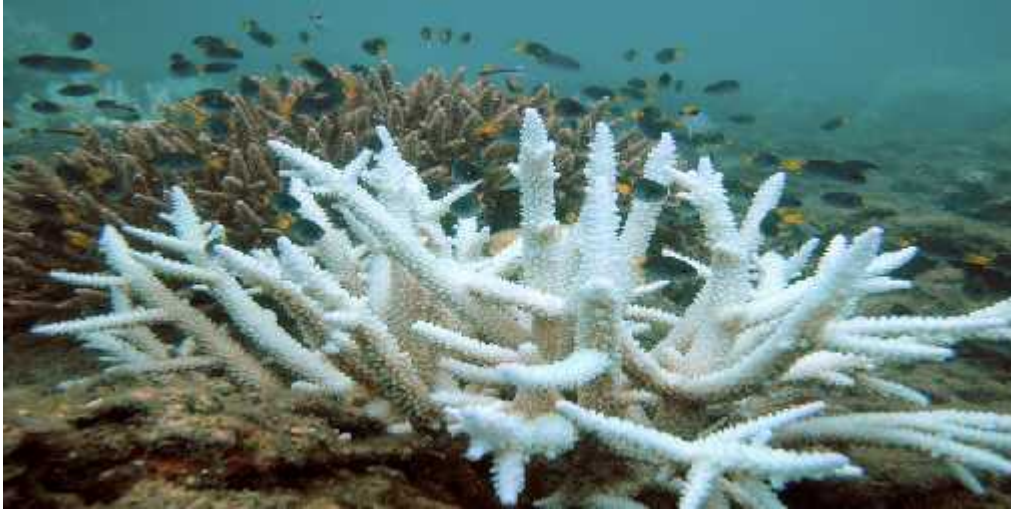
Slika 1. Izbjeljeni koralj ( http://www.climateshifts.org/?p=2549 )